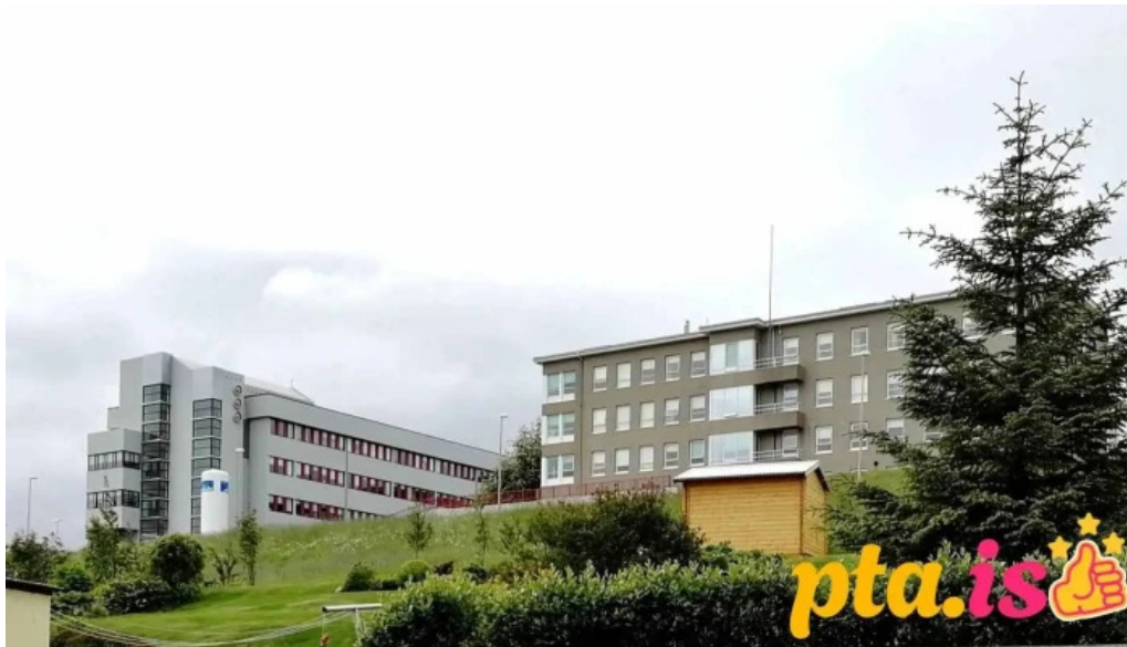
Þyrlulendingarsvæði sjukrahussins akureyri