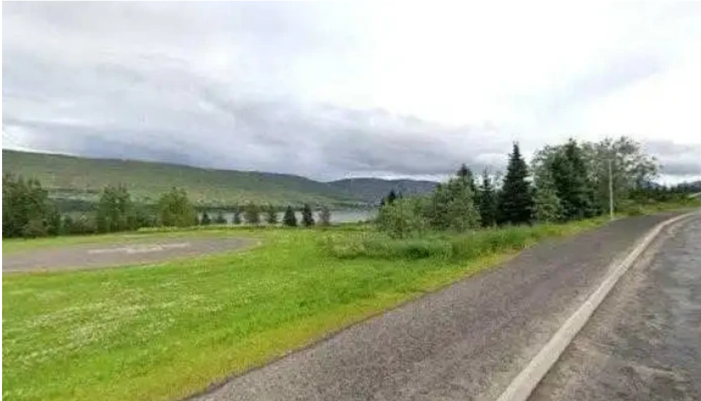
Thyrlulendingarsvaedi sjukrahussins street view 360deg