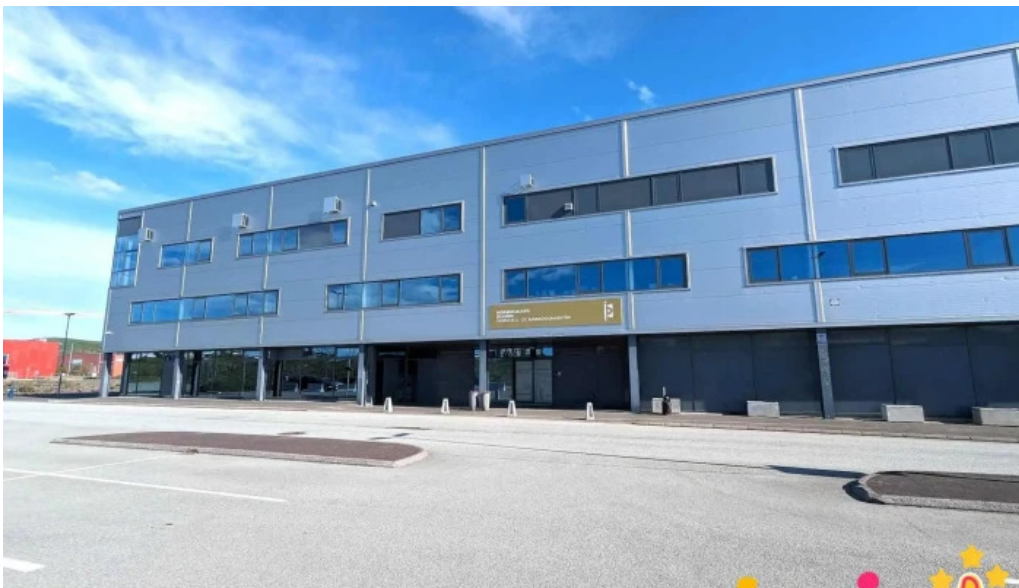
Thjóðminjasafn íslands skrifstofur office vorugeymsla