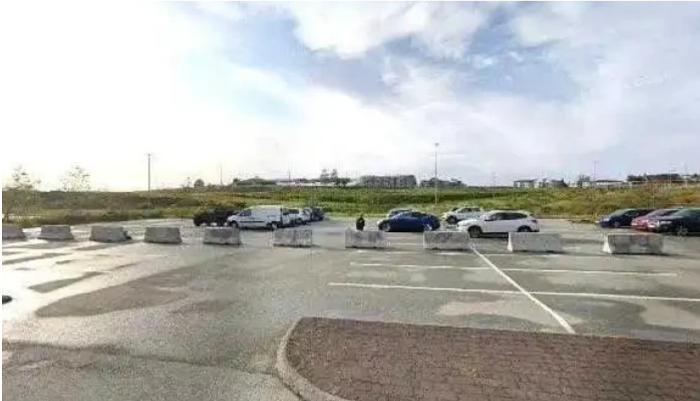
Thjodminjasafn islands skrifstofur office street view 360deg