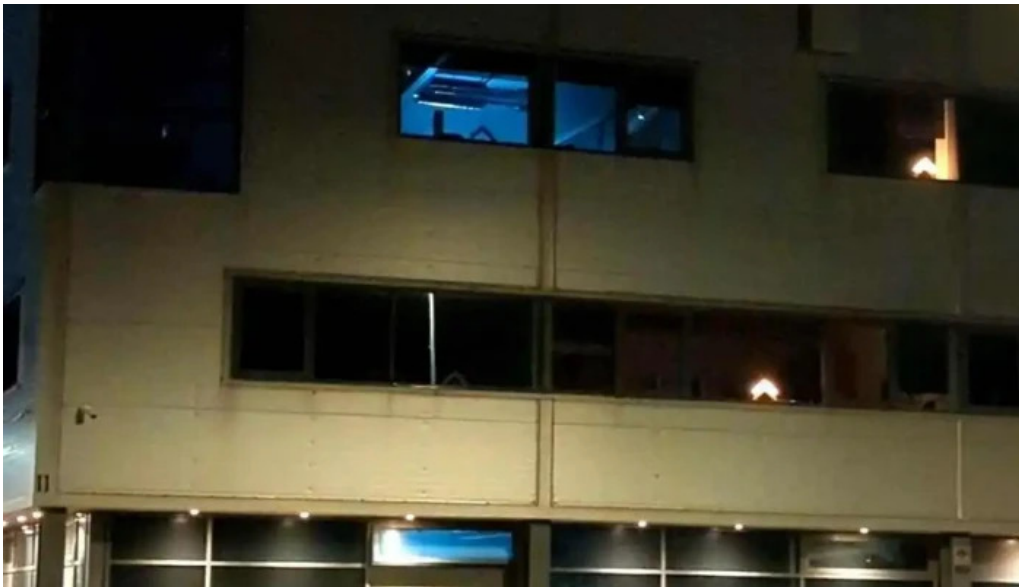
Thjodminjasafn islands skrifstofur office myndskleid