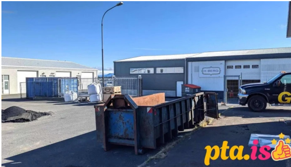
H berg hafnarfjorður