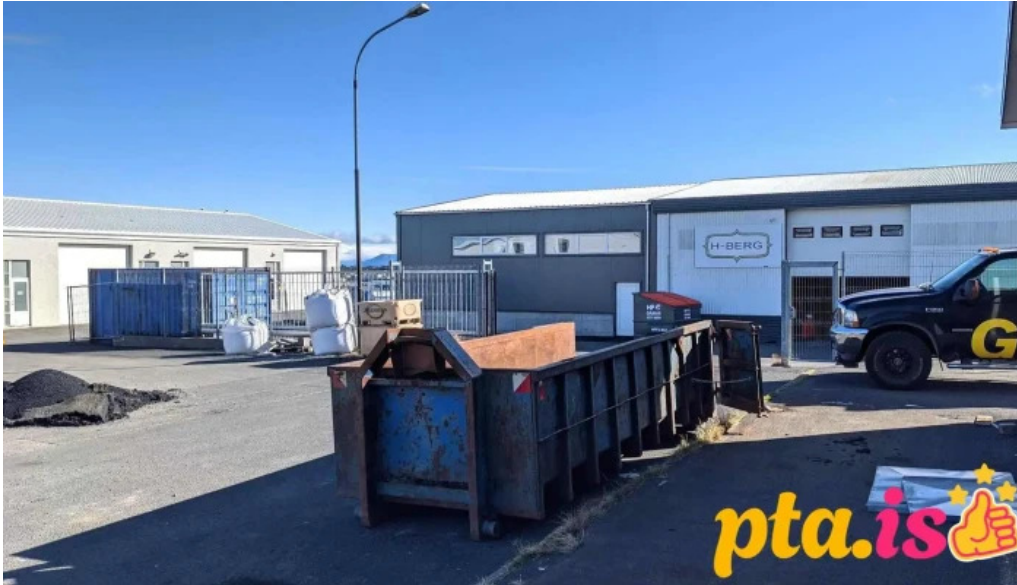
H berg vorugeymsla