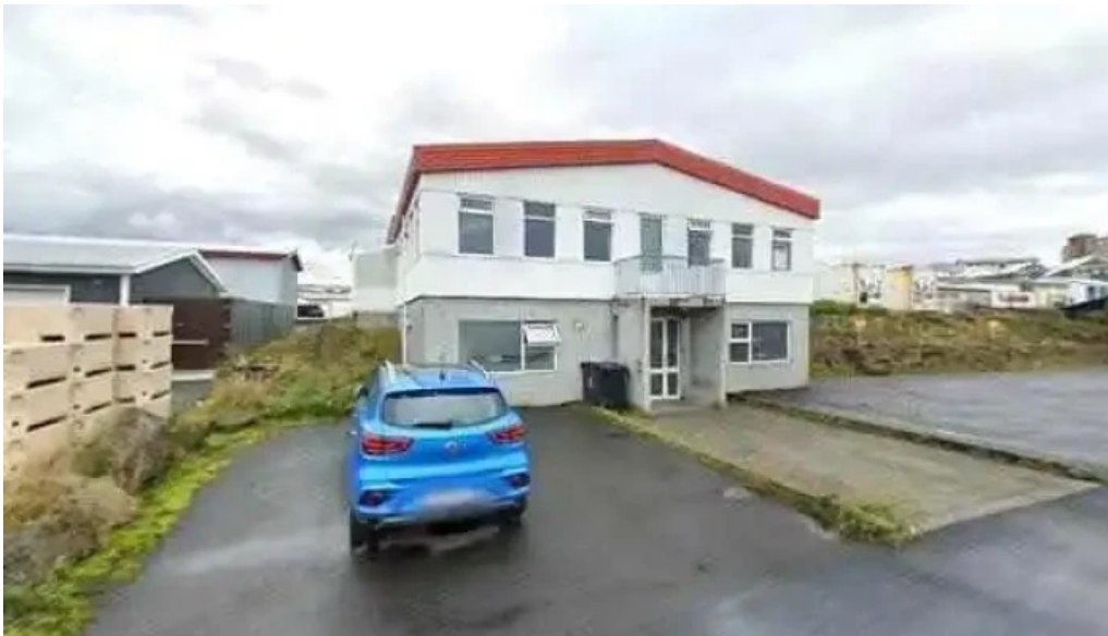
H berg street view 360