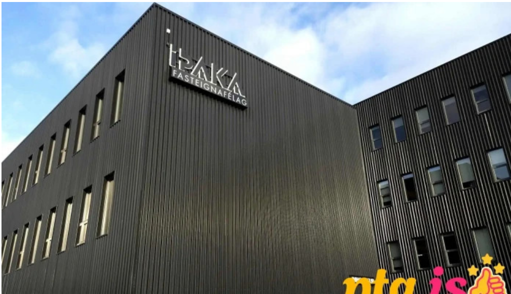
Hofdatorg fra eiganda