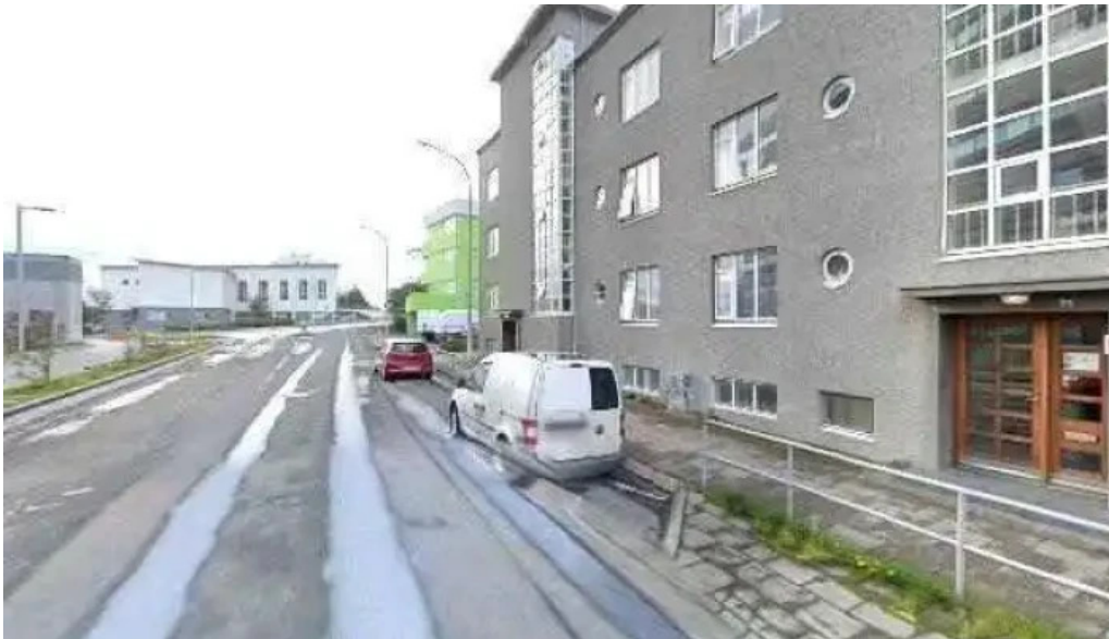
Hofdatorg street view 360deg