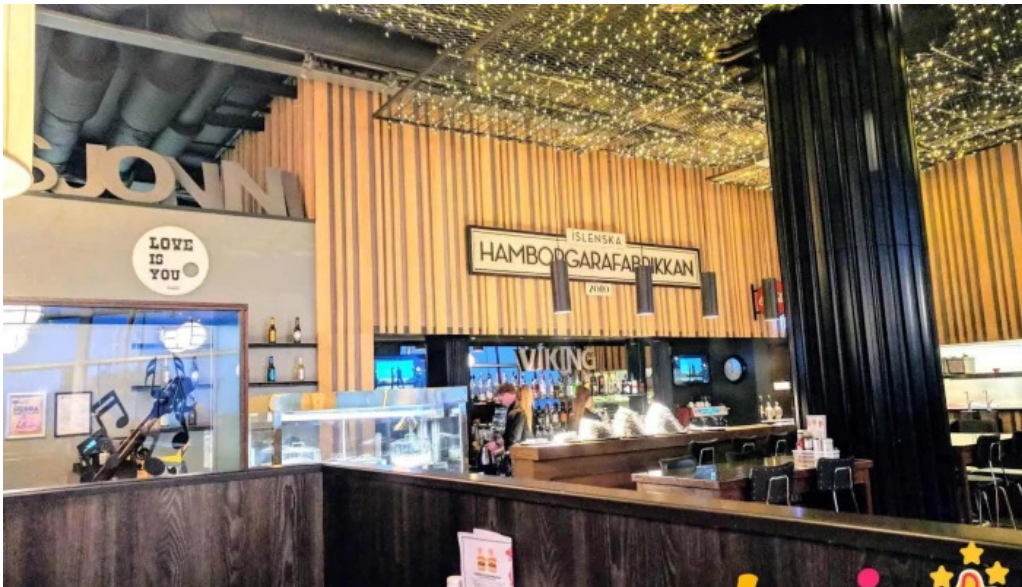
Hofdatorg ad innan