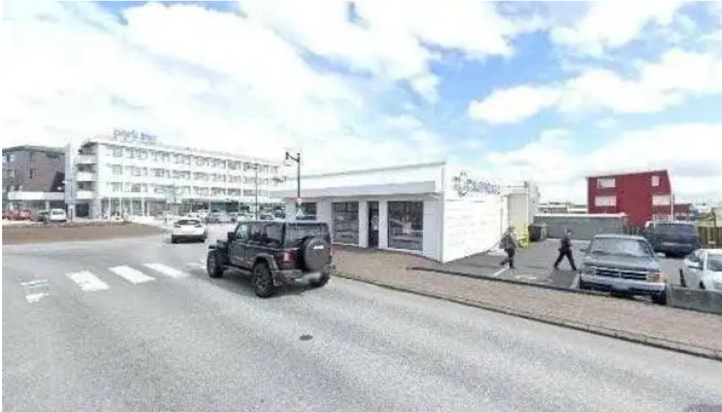
Geosilica iceland street view 360deg