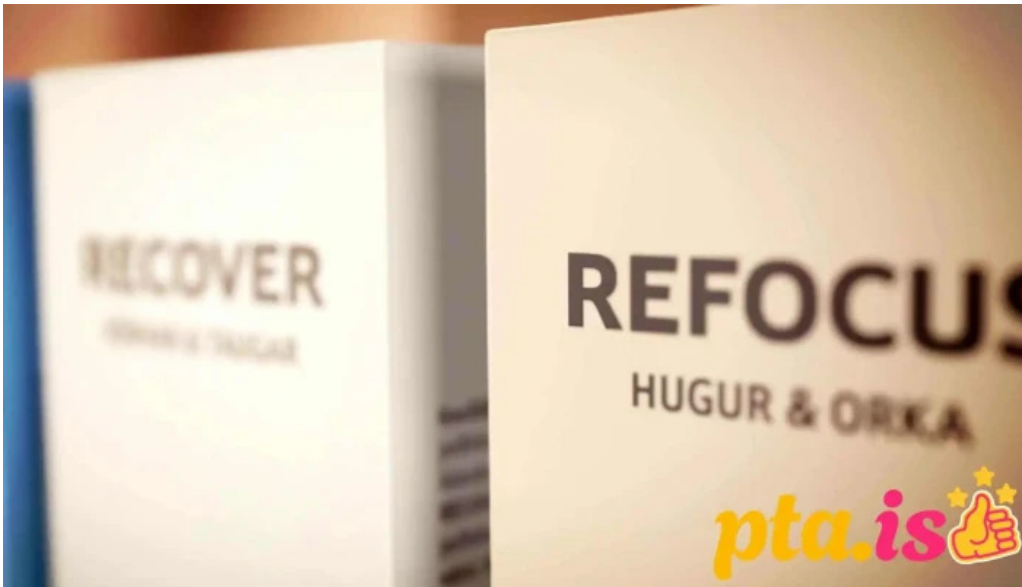
Geosilica iceland myndskid