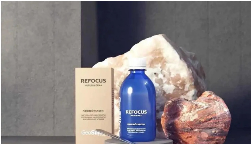
Geosilica iceland keflavik