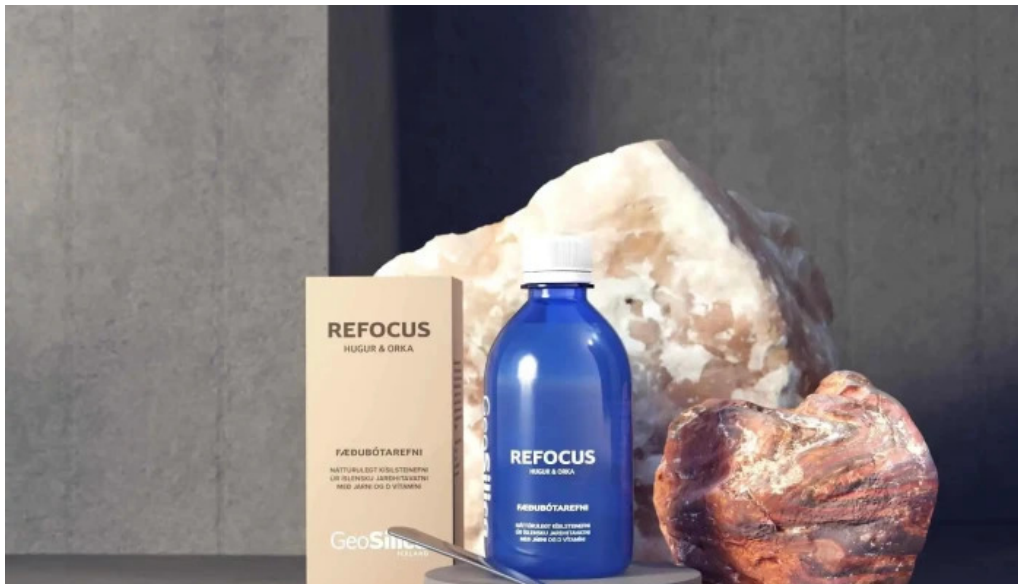
Geosilica iceland vitamina og bætiefnaverslun