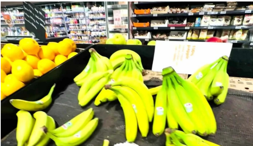
Hagkaup hvernig a að komast þangað