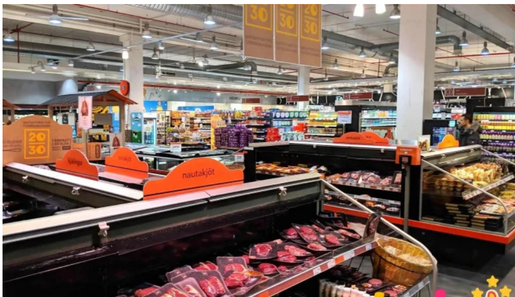
Hagkaup ad innan