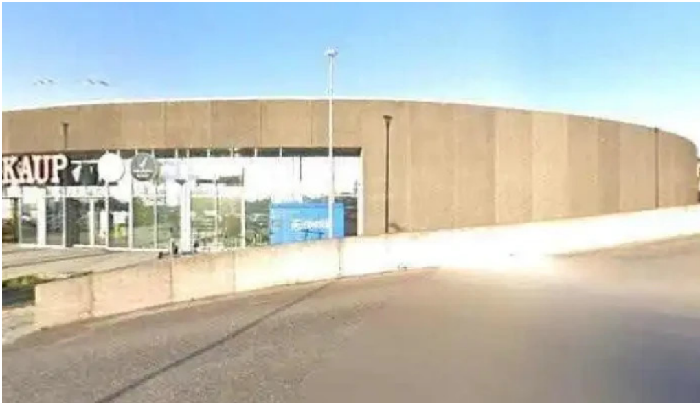
Hagkaup street view 360deg