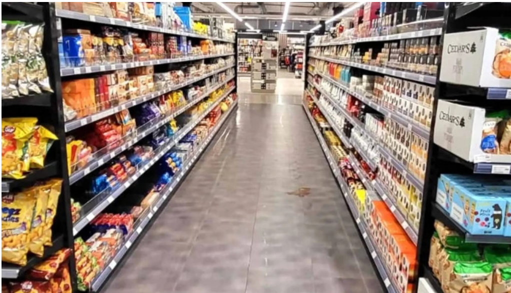
Hagkaup nalægt mer