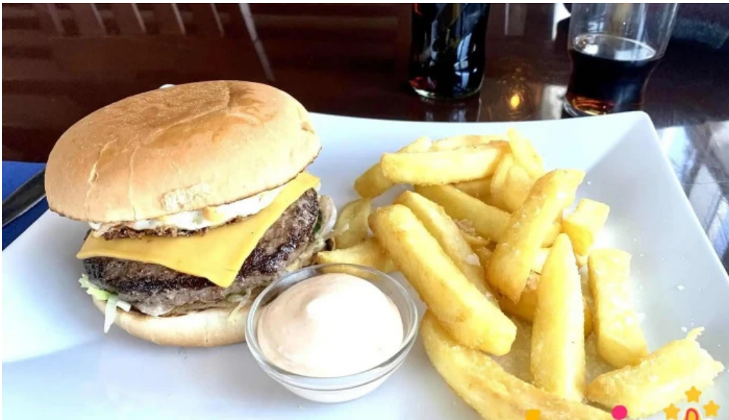
Sjavarsetrid franskar kartoflur