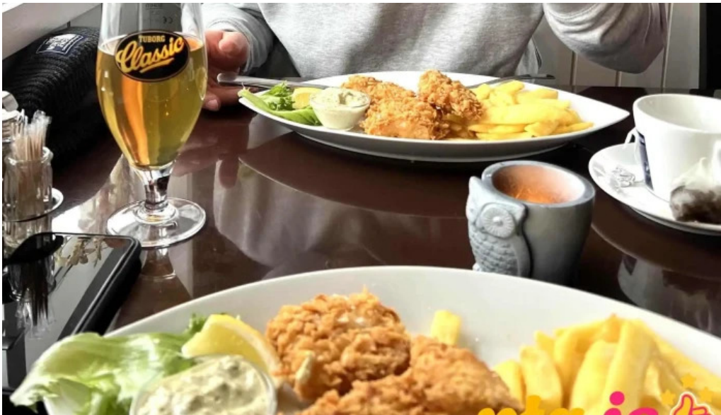
Sjavarsetrid fiskur og franskar