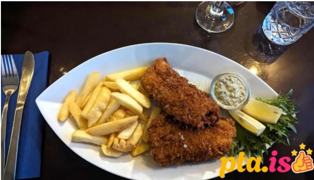
Sjavarsetrid matur og drykkur