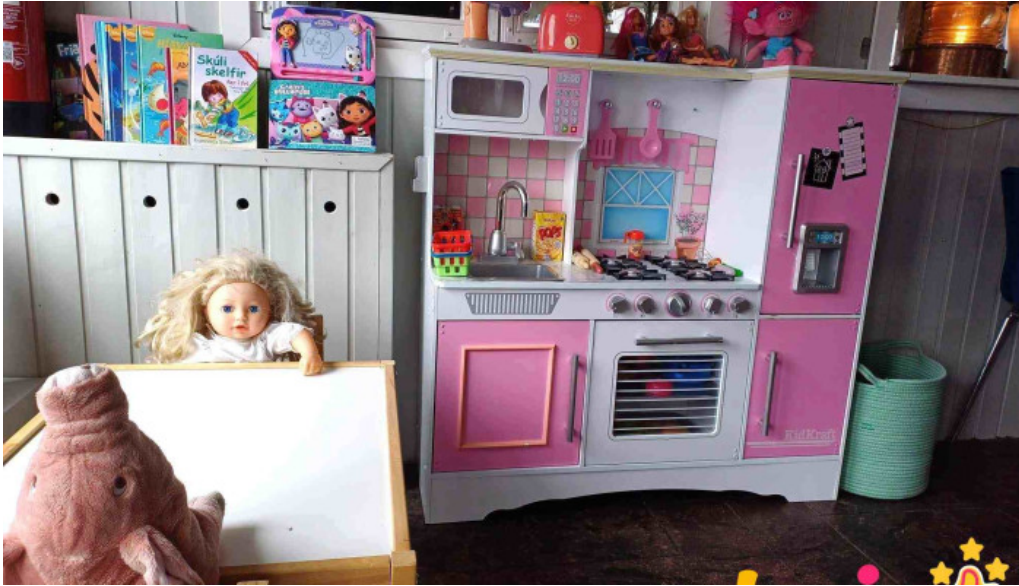
Sjavarsetrid fra eiganda