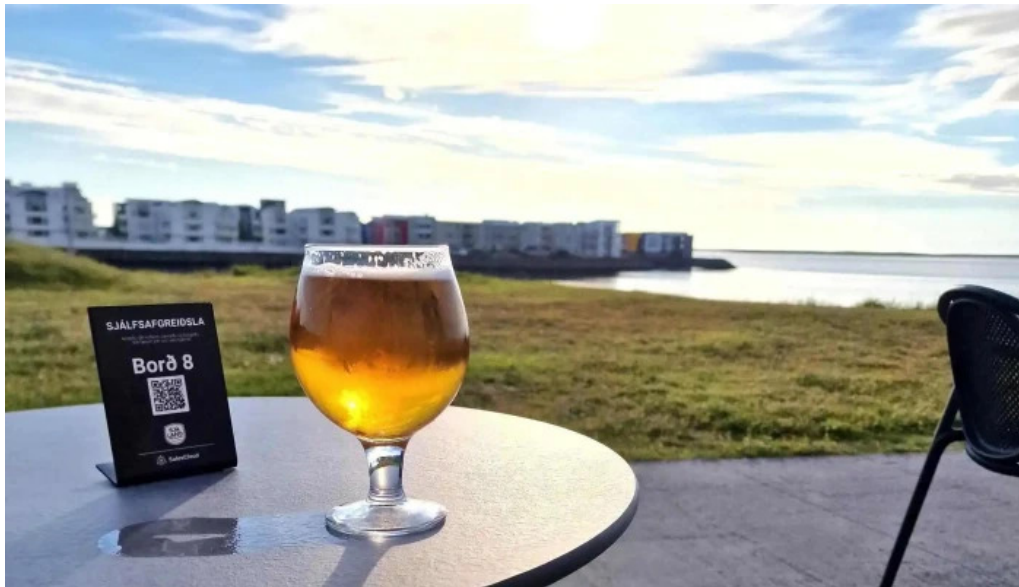
Sjaland matur veisla staðsetning