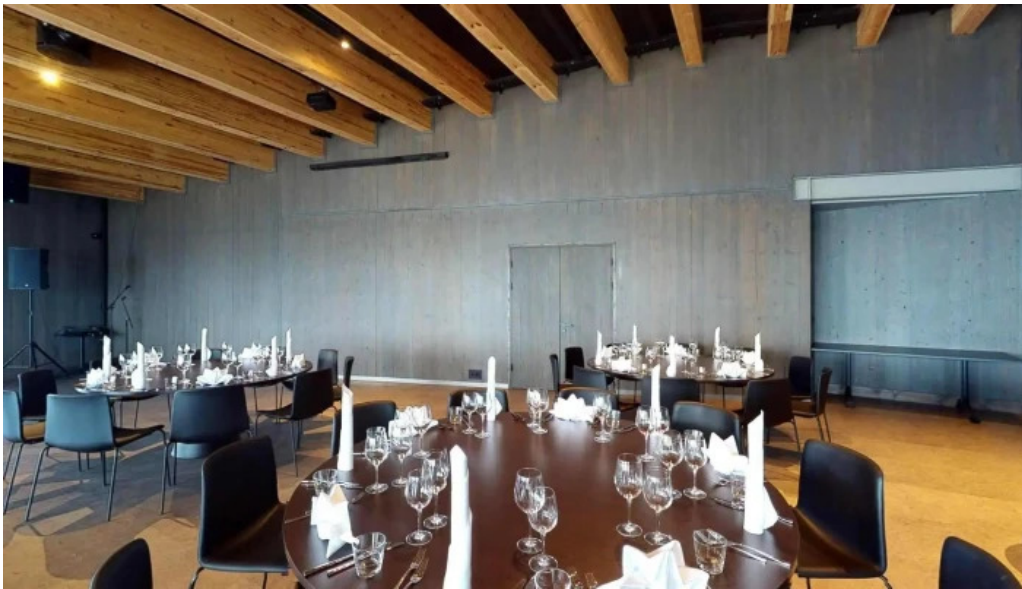
Sjaland matur veisla stemning