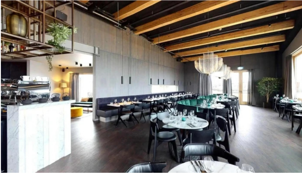
Sjaland matur veisla street view 360deg