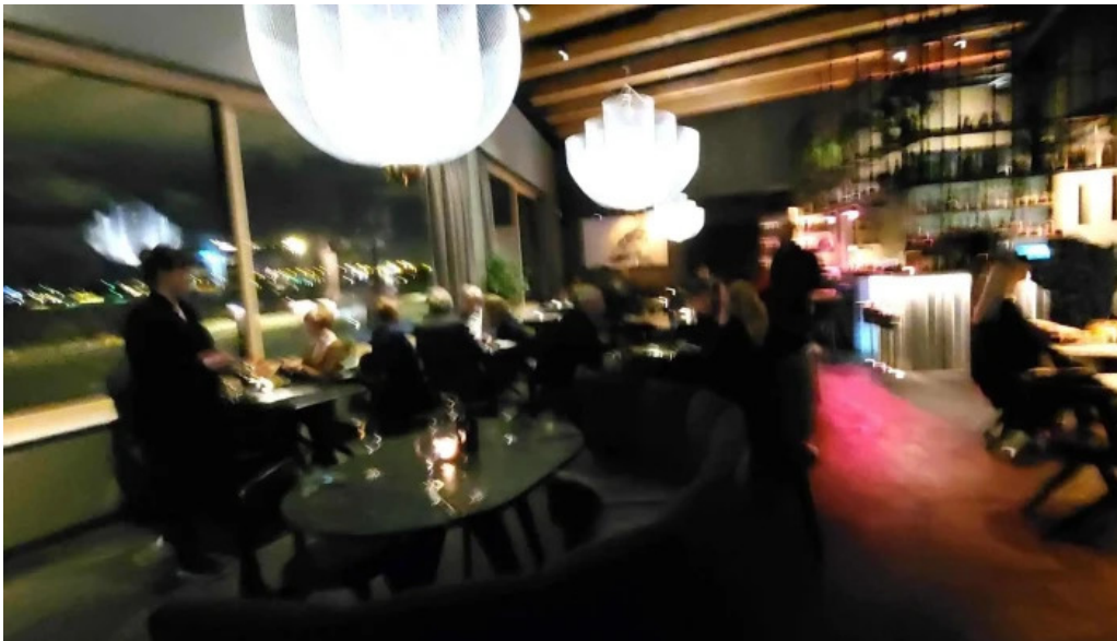
Sjaland matur veisla hvernig a að komast þangað