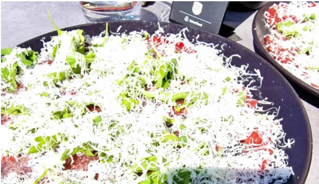
Sjaland matur veisla safn