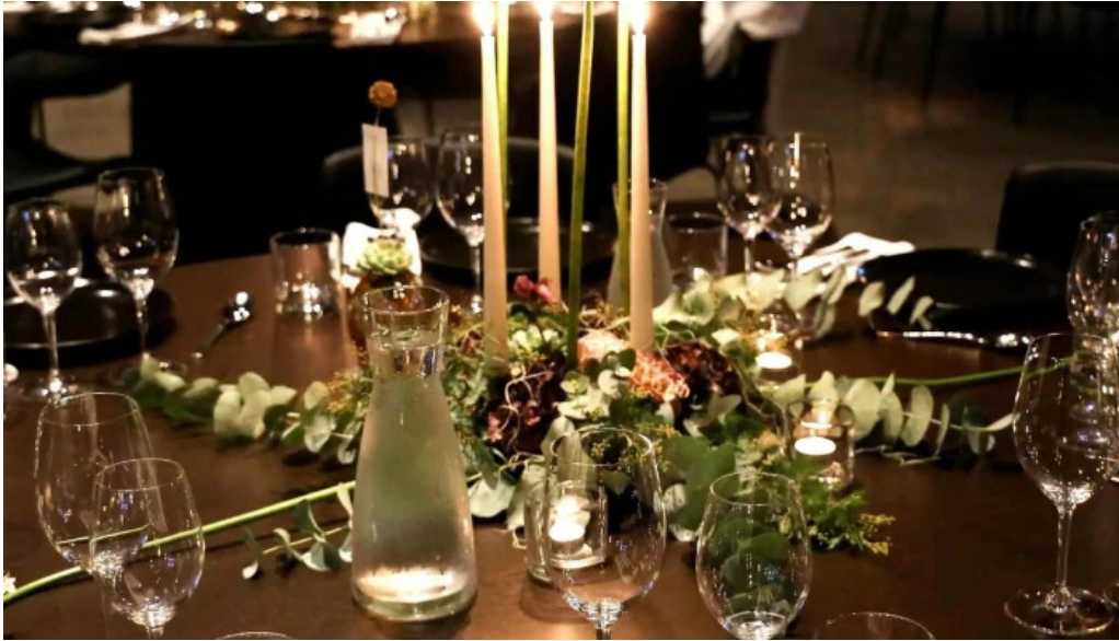
Sjaland matur veisla kynning