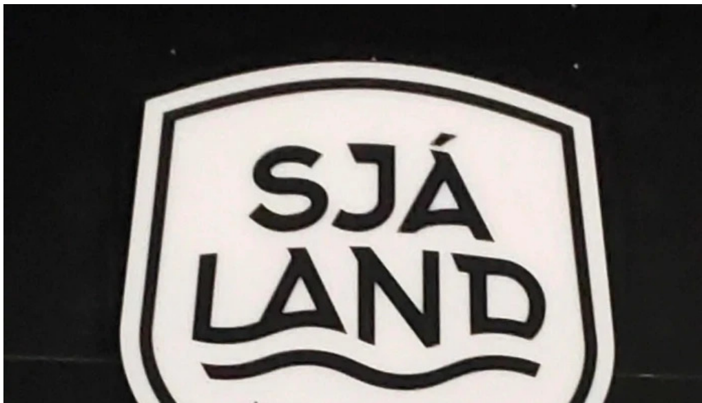
Sjaland matur veisla simi