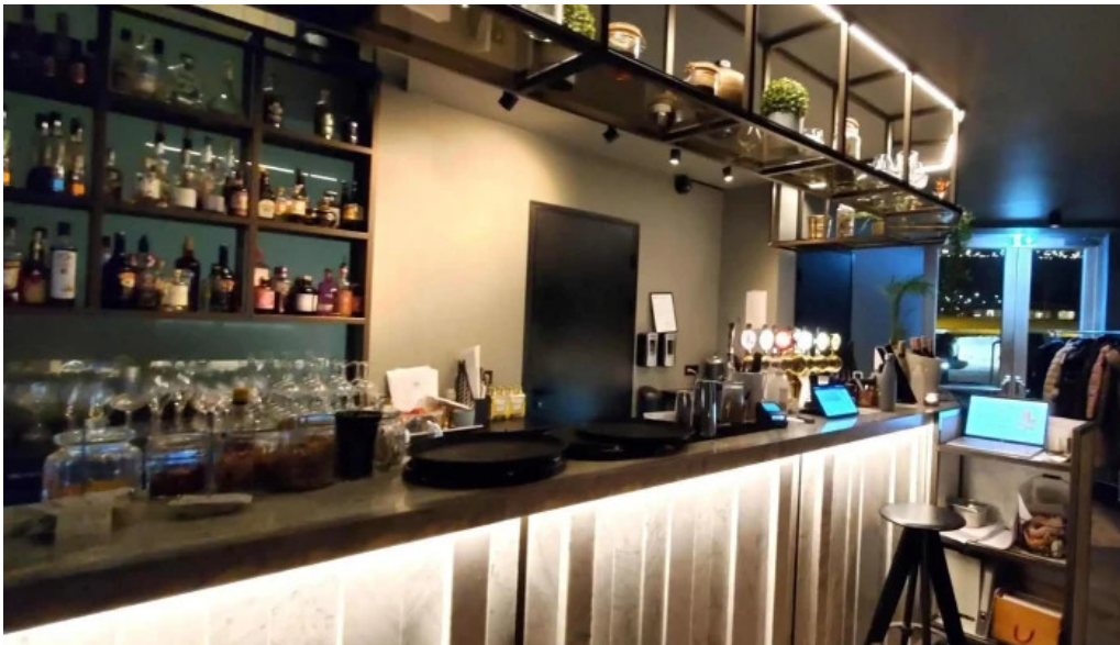
Sjaland matur veisla svæði