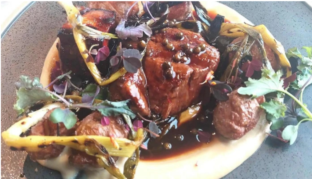
Sjaland matur veisla garðabær