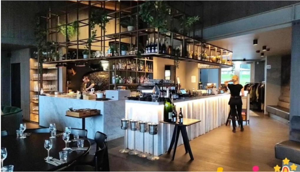
Sjaland matur veisla veitingastaður