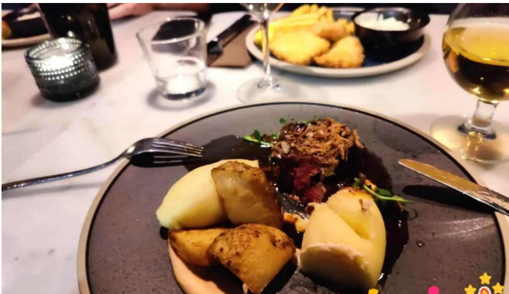
Sjaland matur veisla matur og drykkur