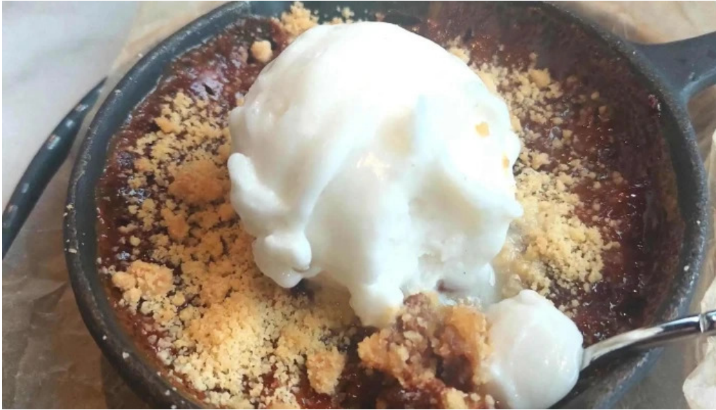
Sjaland matur veisla hvar