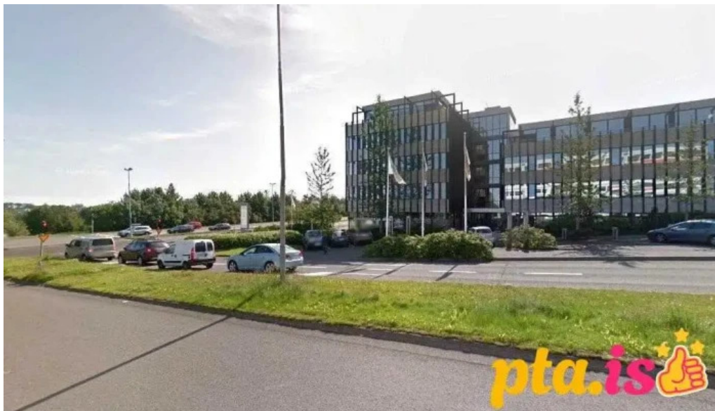
Þin raðgjof reykjavík