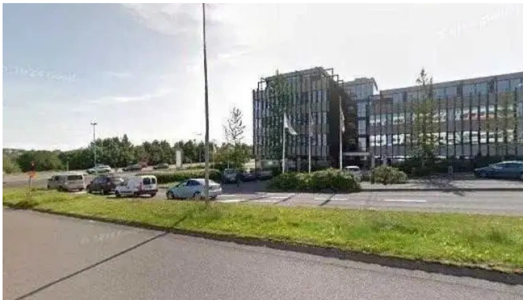
Þin raðgjof vegabjónusta