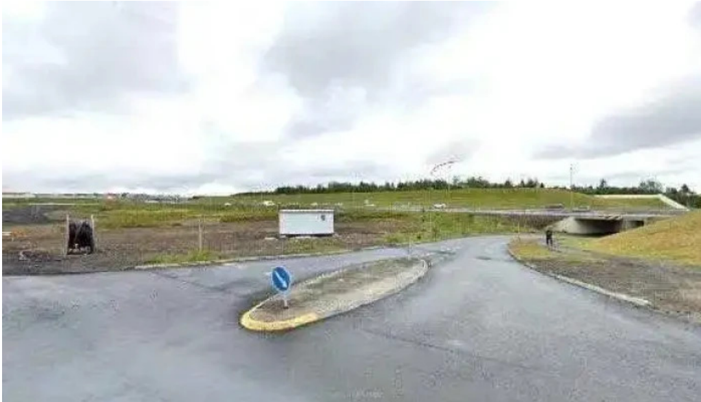
Daelustod vatnsveitu gardabaer vatnsveita