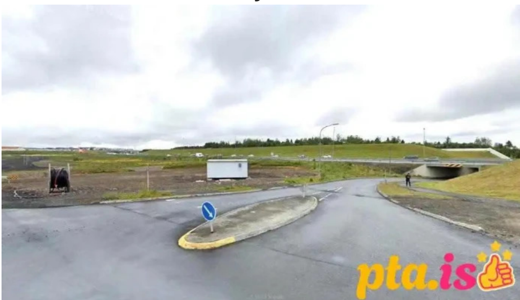
Dælustöð vatnsveitu garðabær garðabær