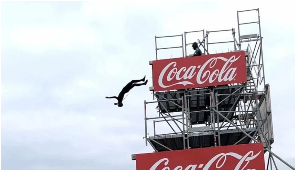
Hoppland nálægt mer