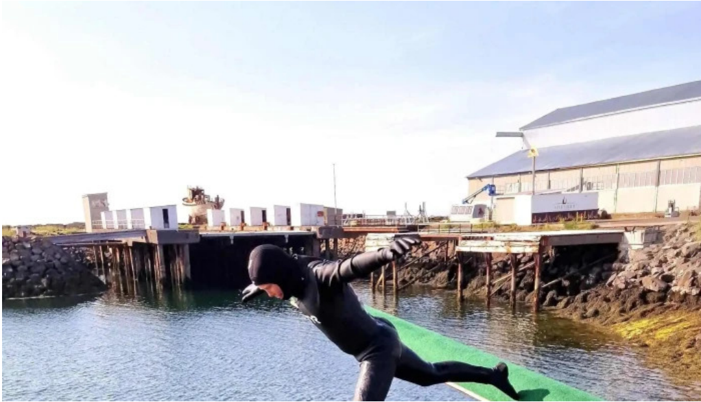
Hoppland opið nuna