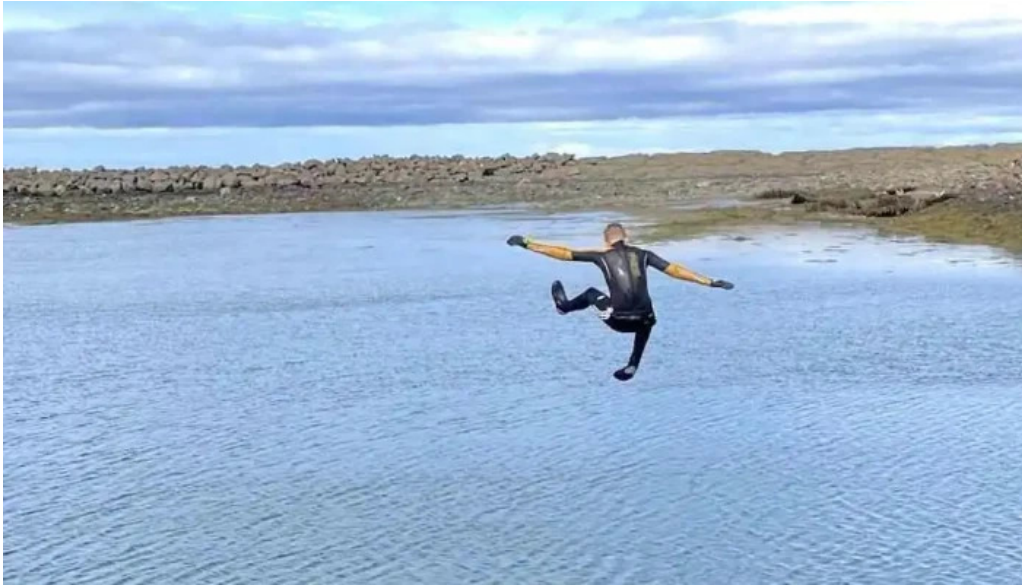
Hoppland fra eiganda