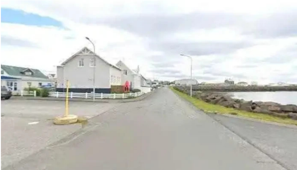
Hopland street view 360deg