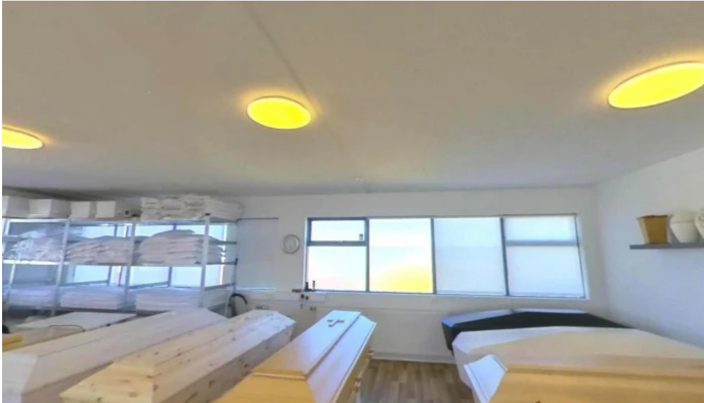
Frimann og halfdan utfararhjonusta hafnarfjardar street view 360