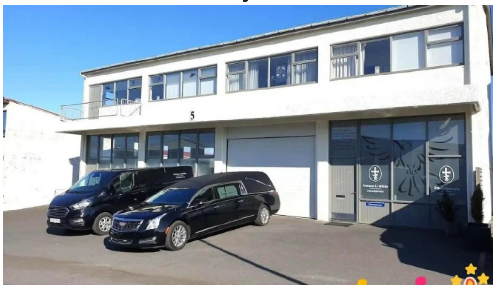
Frimann og hálf dán útfararþjónusta hafnarfjarðar hafnarfjarður