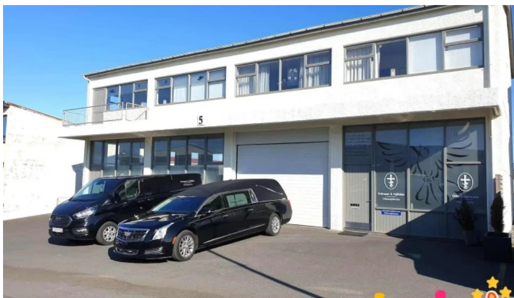
Frimann og hálf dán útfararþjónusta hafnarfjarðar útfararstofnun