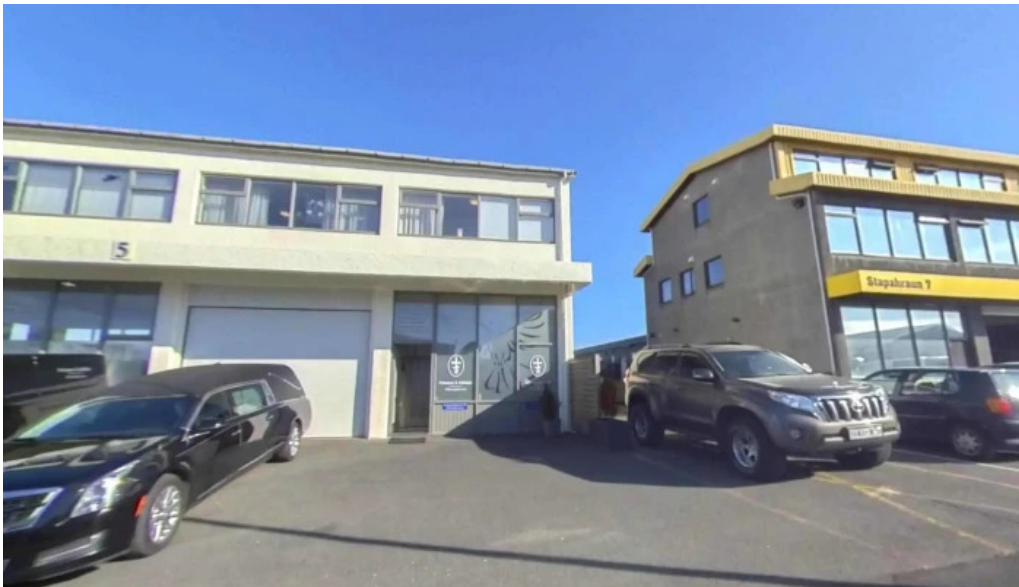
Frimann og halfdan utfararhjonusta hafnarfjardar fra eiganda