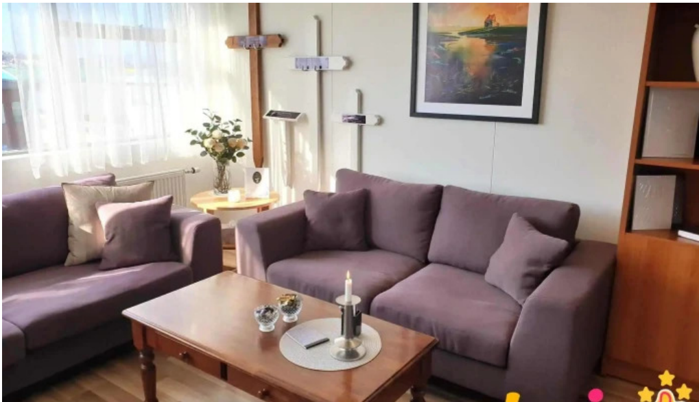
Frimann og halfdan utfararþjónusta hafnarfjardar ad innan