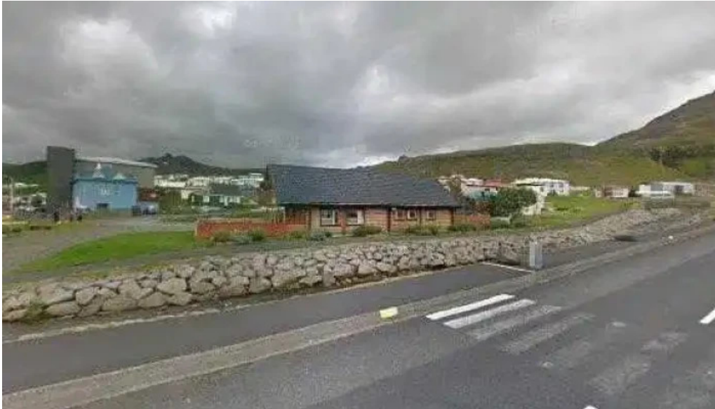
Upplýsingamidstod ferdamanna snaefellsbae street view 360deg