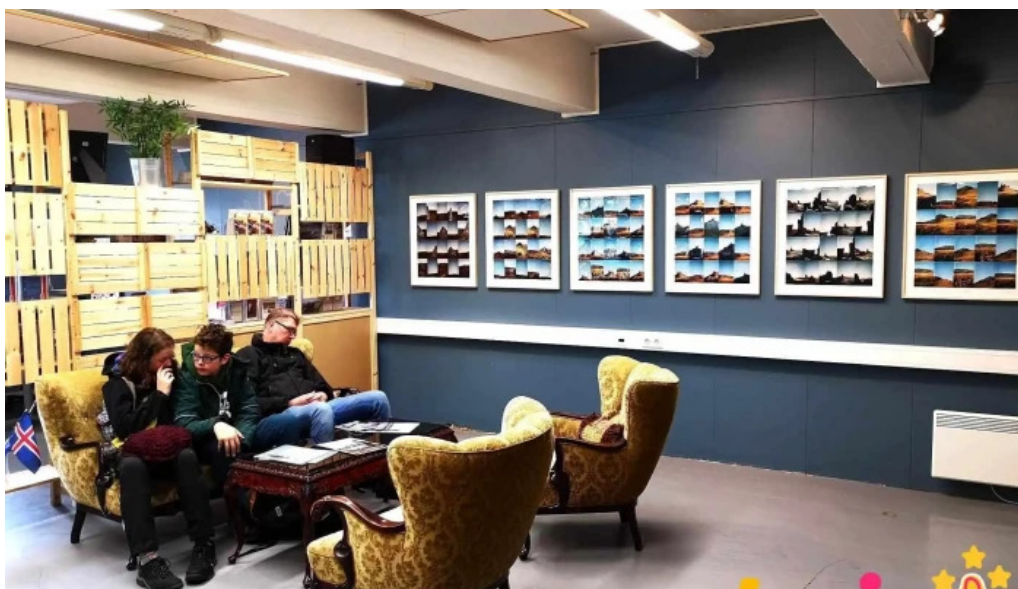
Upplýsingamidstod ferdamanna snaefellsbae upplýsingamiðstoð ferðamanna