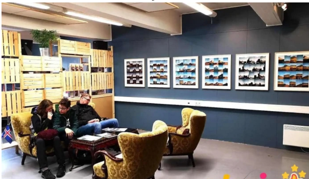
Upplýsingamiðstoð ferðamanna snæfellsbæ olafsvik