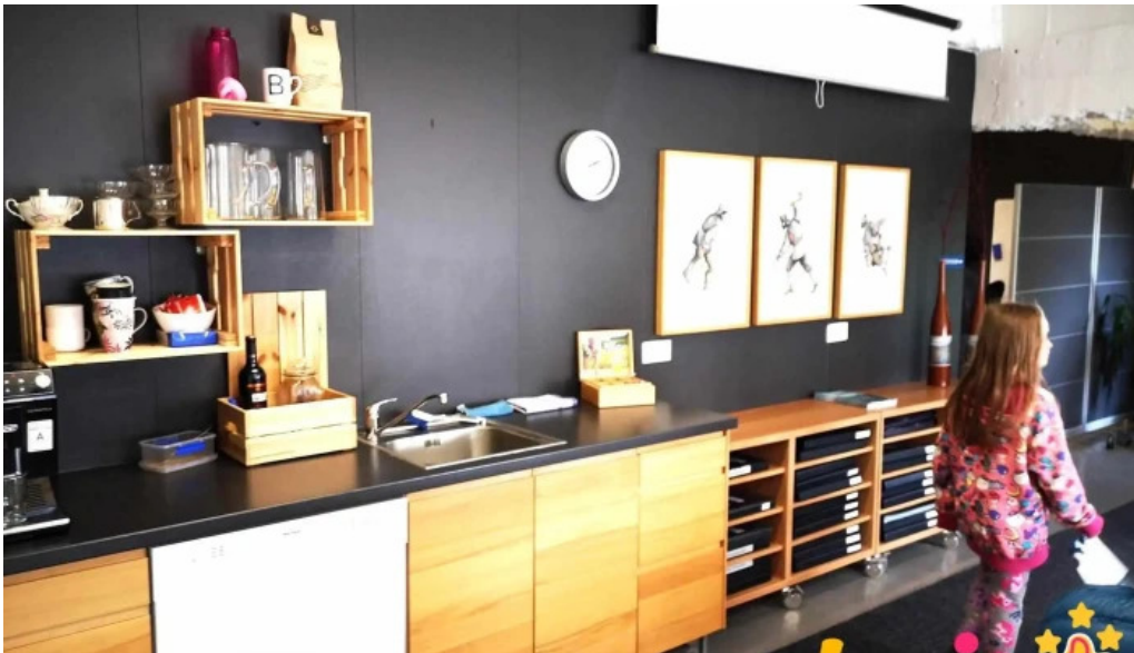
Upplýsingamidstod ferdamanna snaefellsbae ad innan