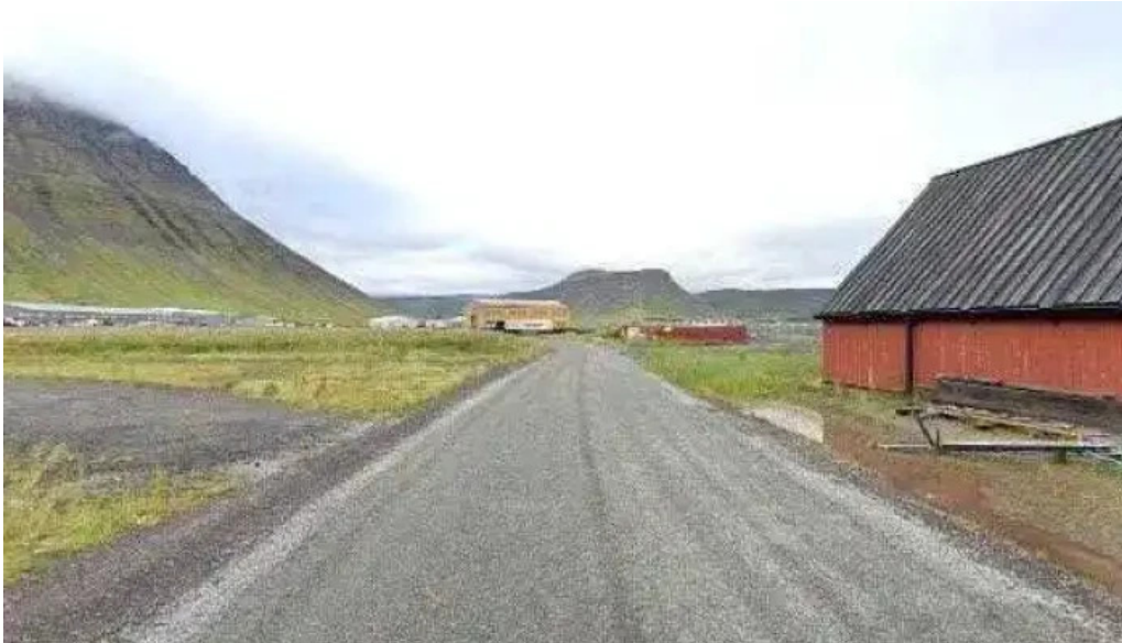
Upplýsingamidstod ferdamanna street view 360