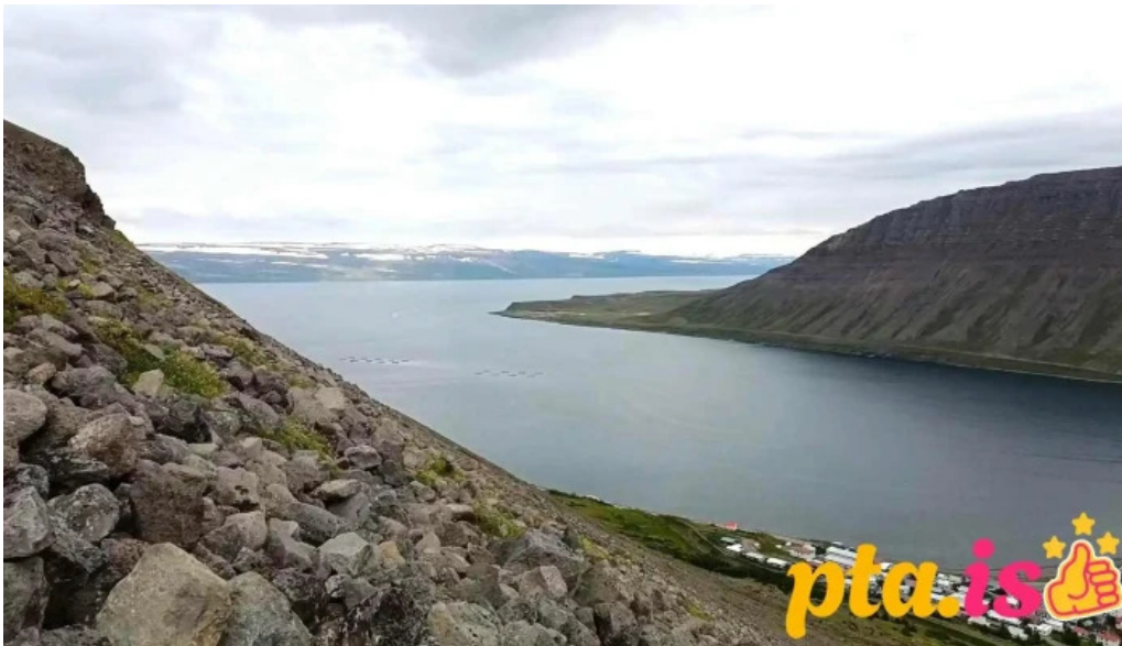
Upplýsingamidstod ferdamanna myndskid