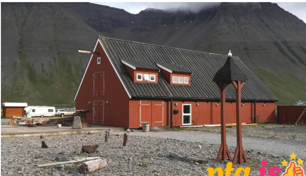
Upplýsingamiðstöð ferðamanna upplýsingamiðstöð ferðamanna