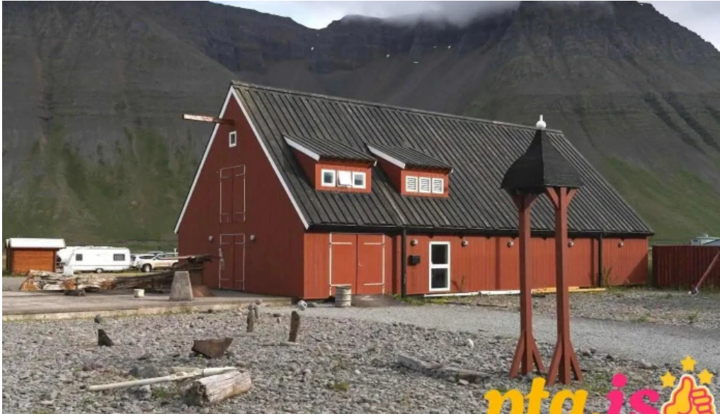
Upplýsingamiðstöð ferðamanna isafjorður