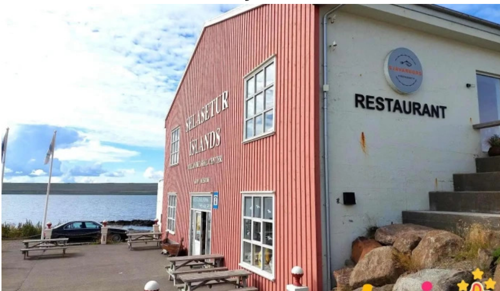
Selasetur islands upplýsingamiðstoð ferðamanna