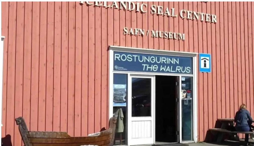
Selasetur islands naerumhverfi