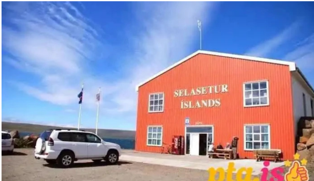
Selasetur islands fra eiganda