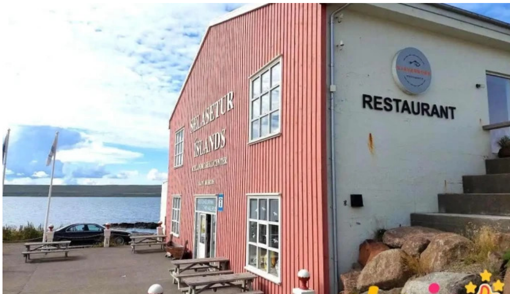
Selasetur islands hvammstangi