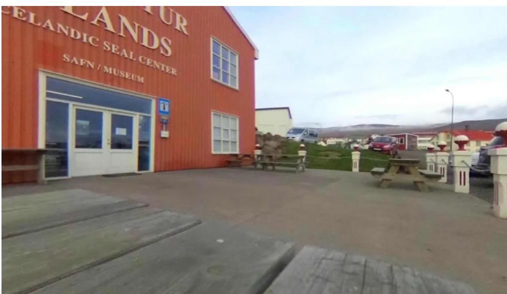
Selasetur islands street view 360deg