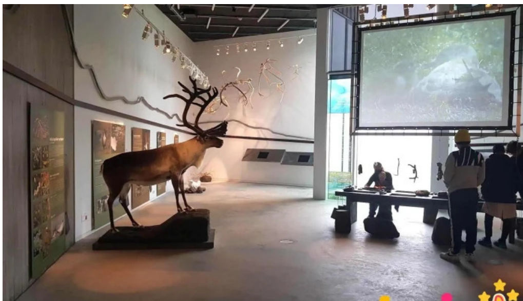
Snæfellsstofa ad innan