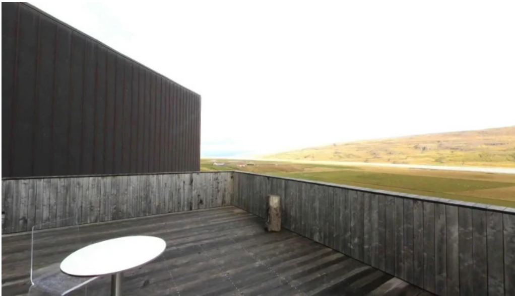
Snaefellsstofa street view 360deg