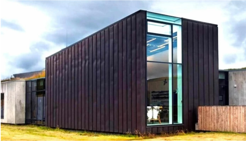
Snaefellsstofa nálægt mer