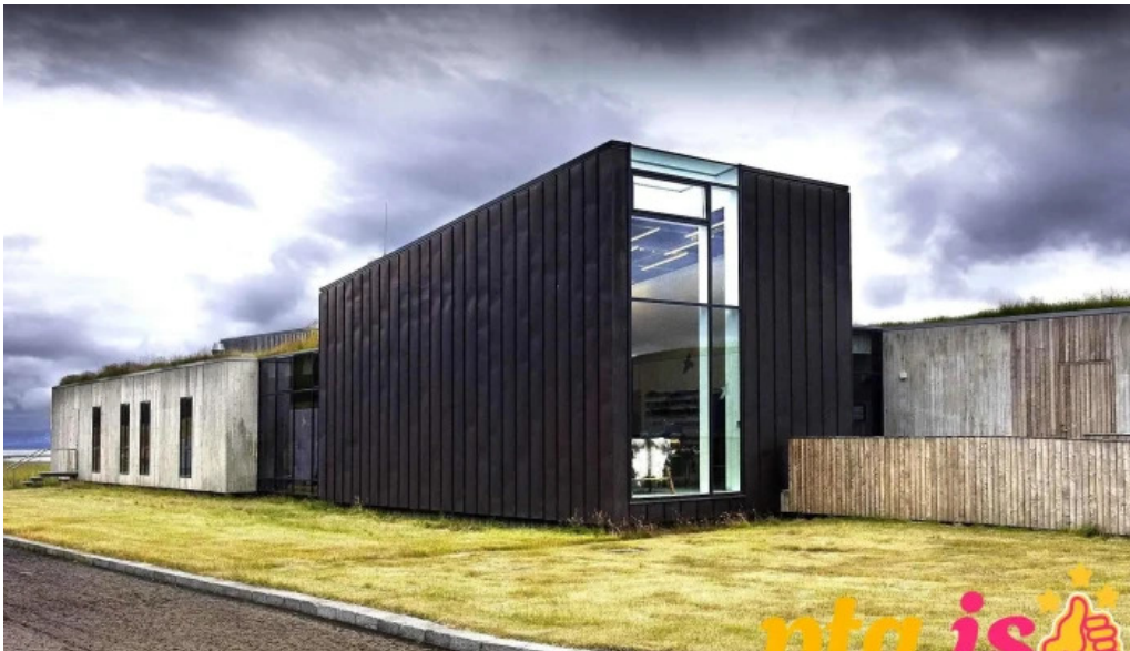
Snæfellsstofa upplýsingamiðstöð ferðamanna