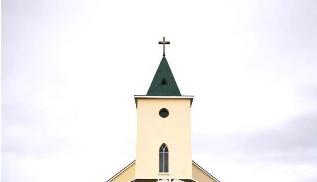
Upplýsingamidstöð akureyrar afslættir