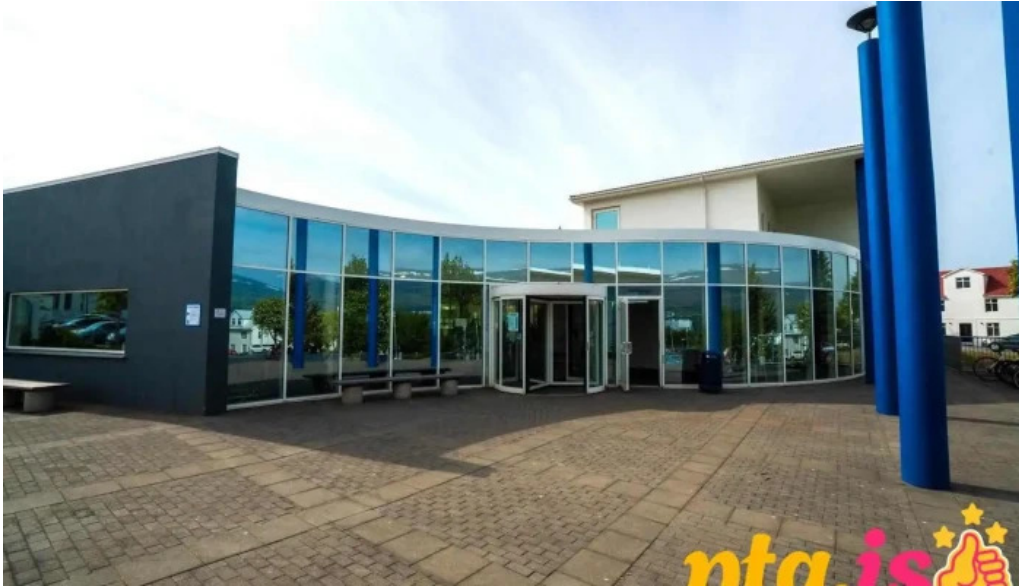
Upplýsingamiðstoð akureyrar akureyri