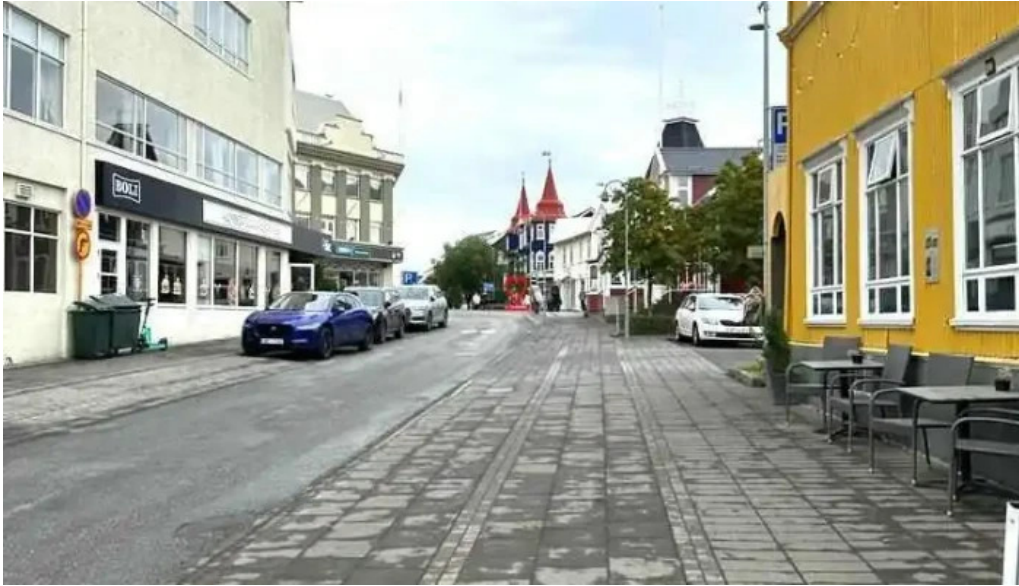
Upplýsingamidstöð akureyrar nærumhverfi