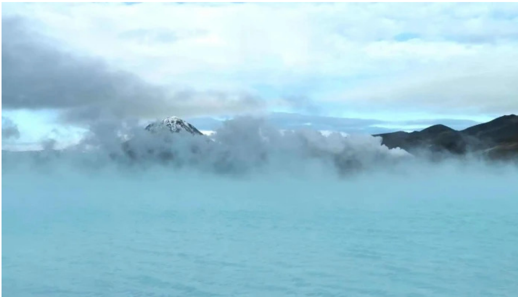
Upplýsingamidstöð akureyrar opið nuna