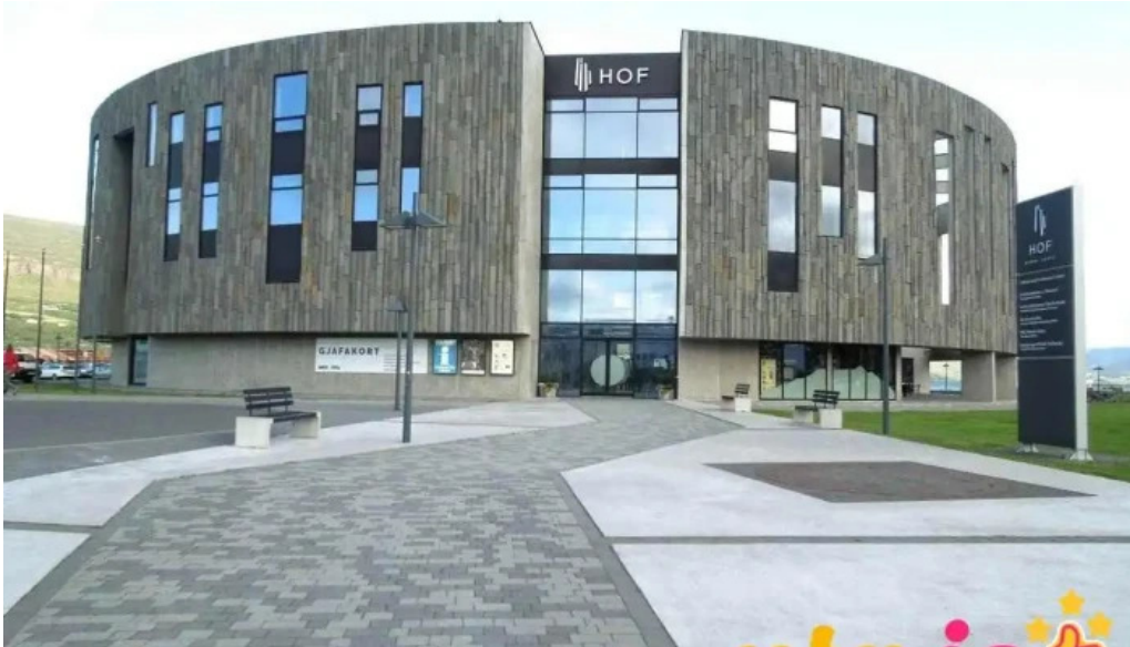
Upplýsingamidstöð Akureyrar frá eiganda