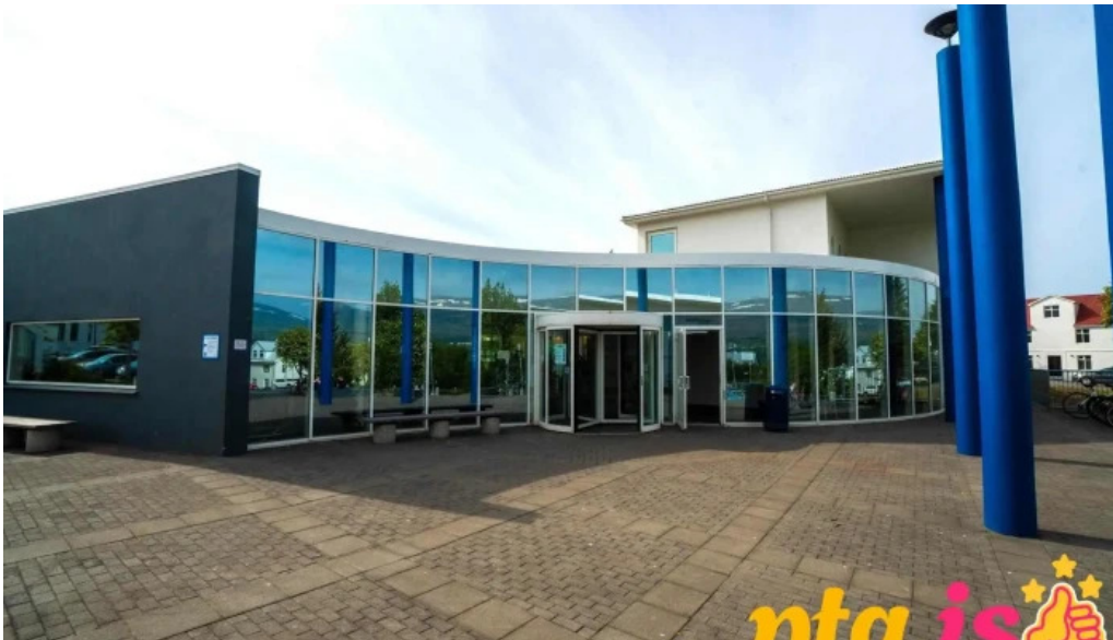
Upplýsingamidstod akureyrar upplýsingamiðstoð ferðamanna