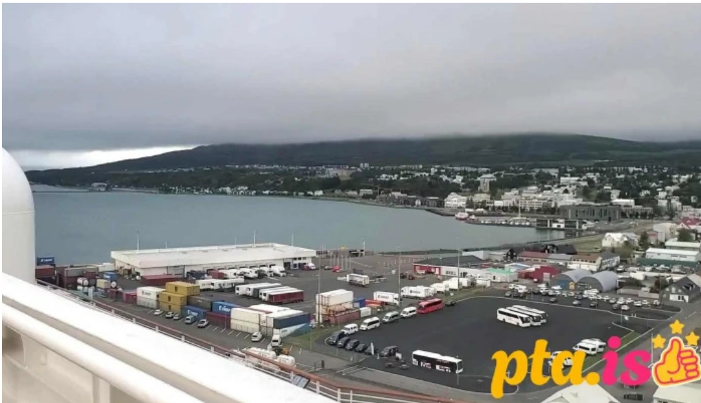
Upplýsingamidstöð akureyrar myndskeld