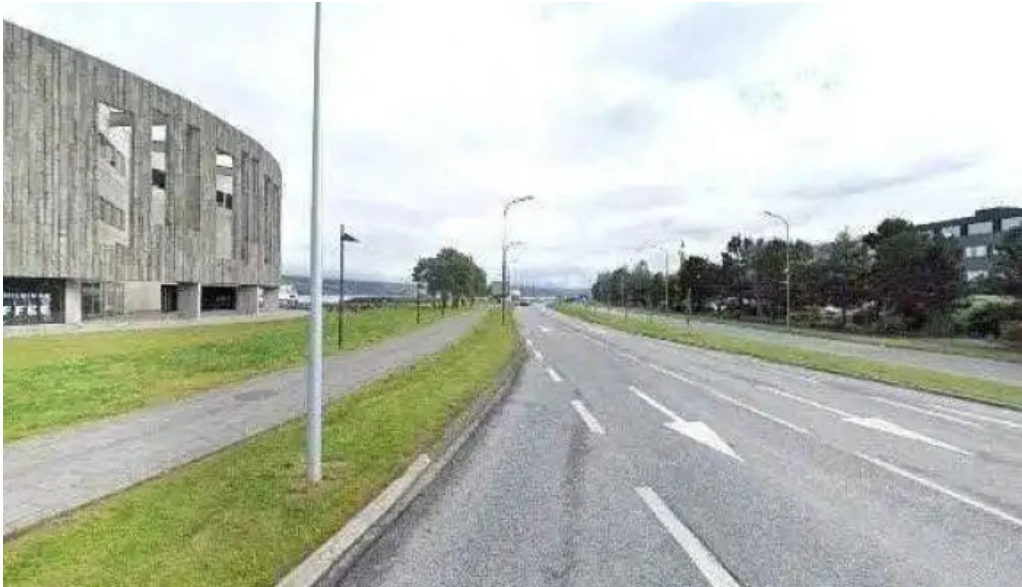
Upplýsingamidstod akureyrar street view 360deg