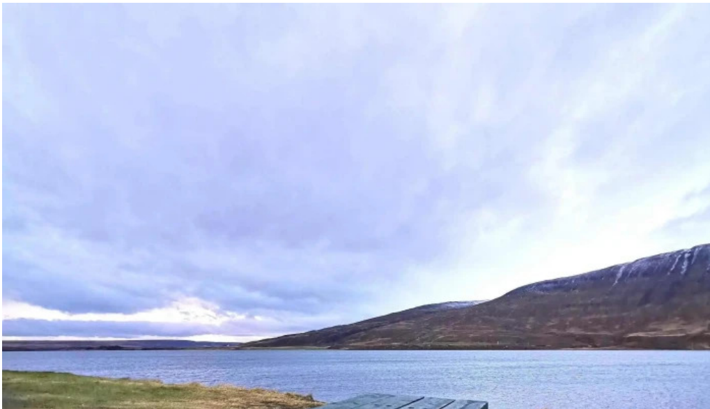
Upplýsingamidstod akureyrar nálægt mer