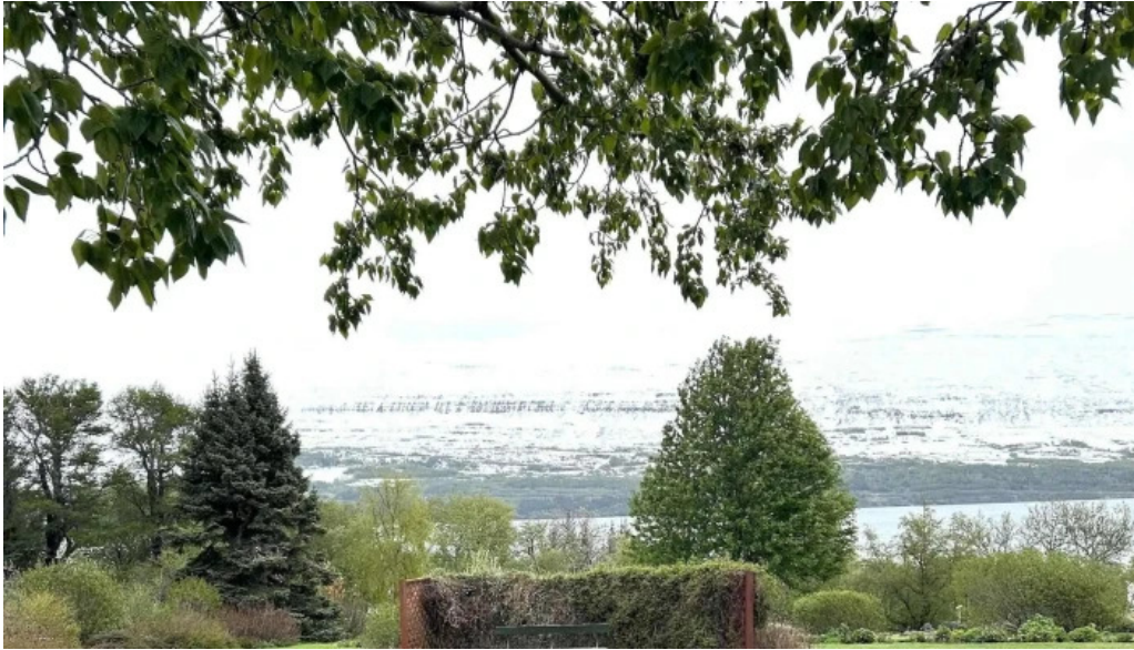
Upplýsingamidstod akureyrar svæði