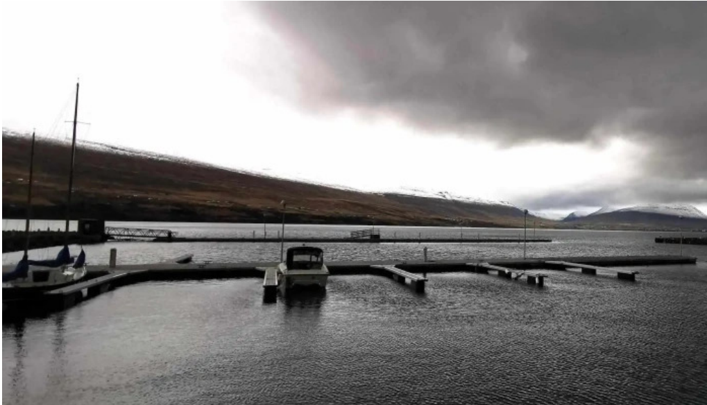
Upplýsingamidstod akureyrar myndbond