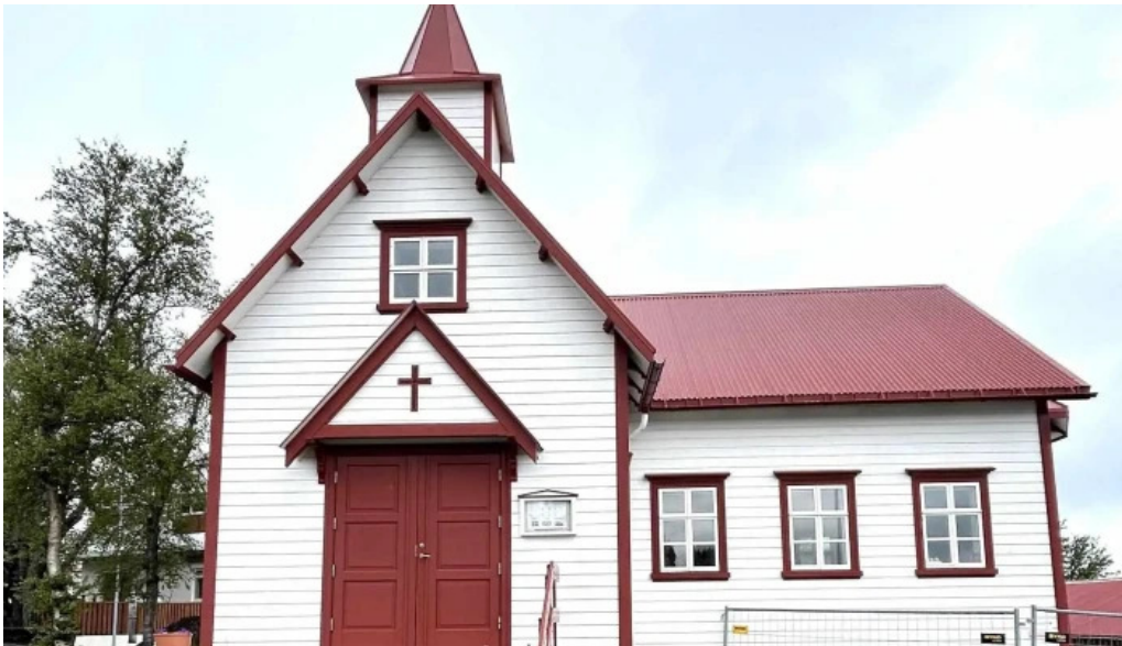
Upplýsingamidstöð Akureyrar Akureyri