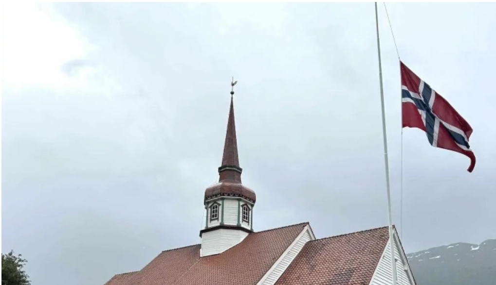
Upplýsingamidstod akureyrar hvar