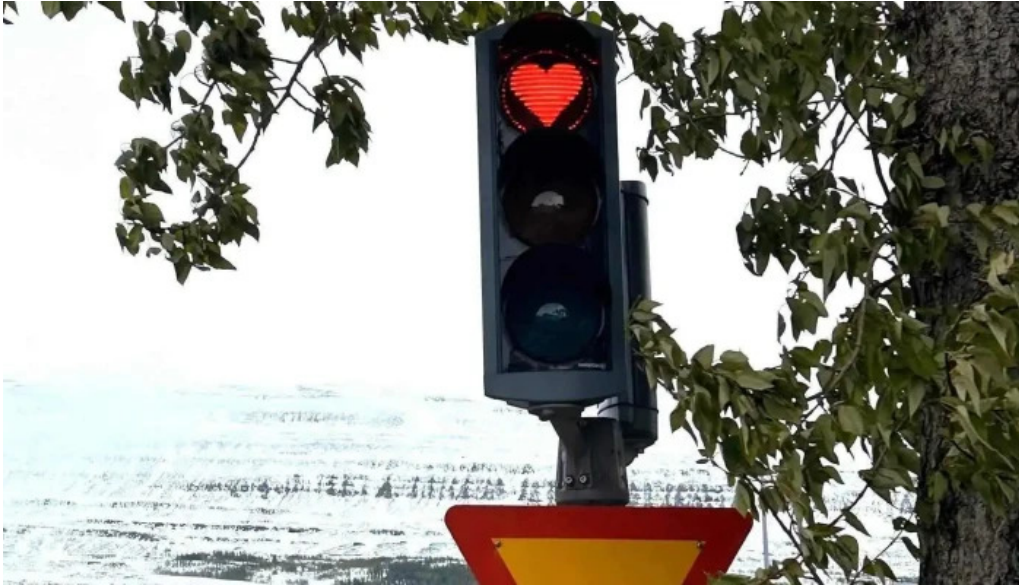
Upplýsingamidstod akureyrar nýjast