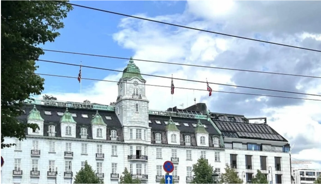
Upplýsingamidstöð akureyrar sími