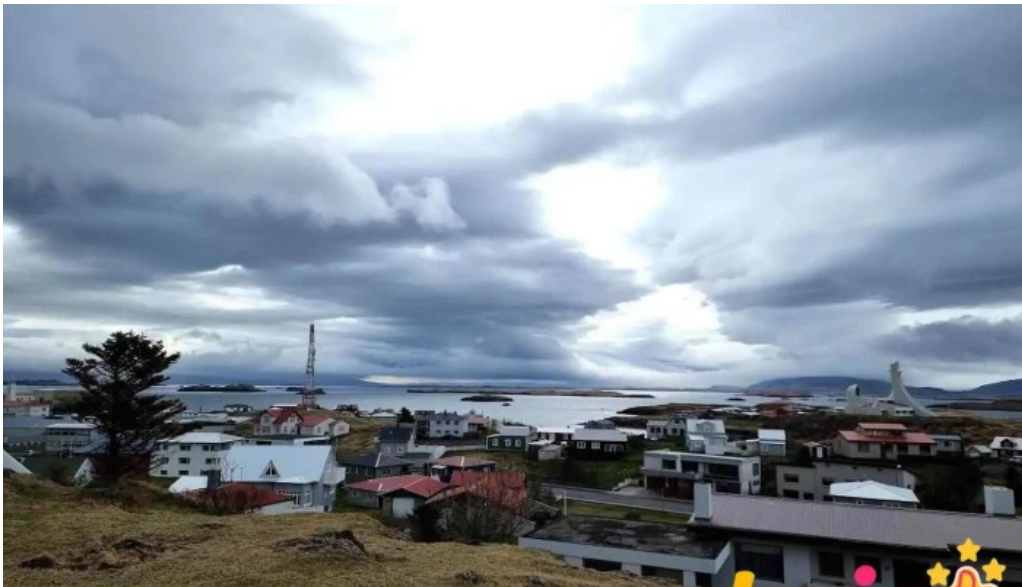
Tonlistarskoli stykkisholms stykkisholmur