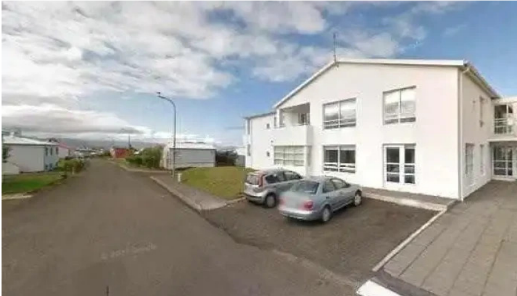
Tonlistarskoli stykkisholms street view 360deg