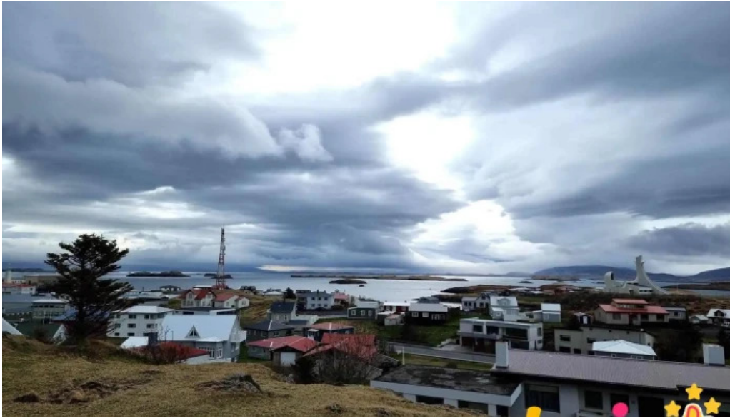
Tonlistarskoli stykkisholms tonlistarskoli