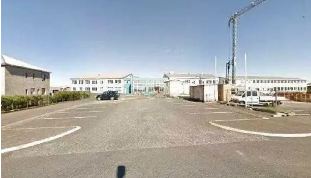
Tonlistarskolinn i grindavik tonlistarskoli