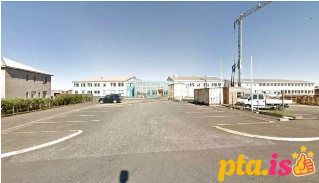
Tonlistarskolinn i grindavik grindavik