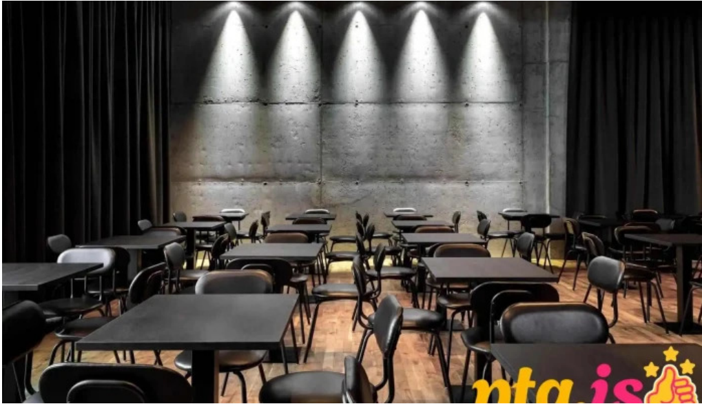
Sykursalur tonleika eða veislusalur