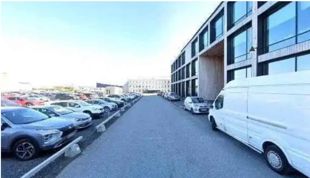
Sykursalur street view 360deg