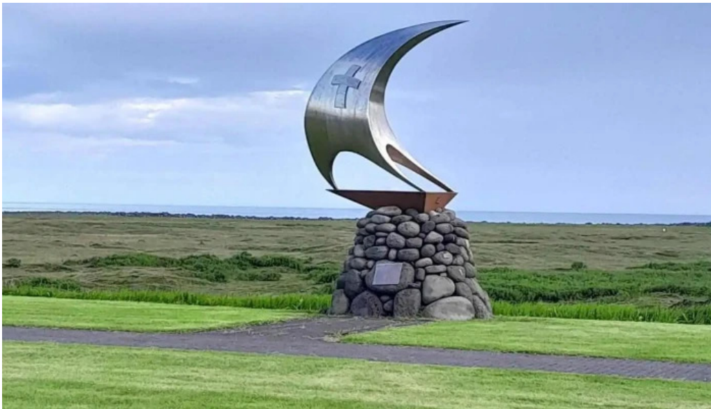
Thorlakshofn tjaldsvæði frá gestum