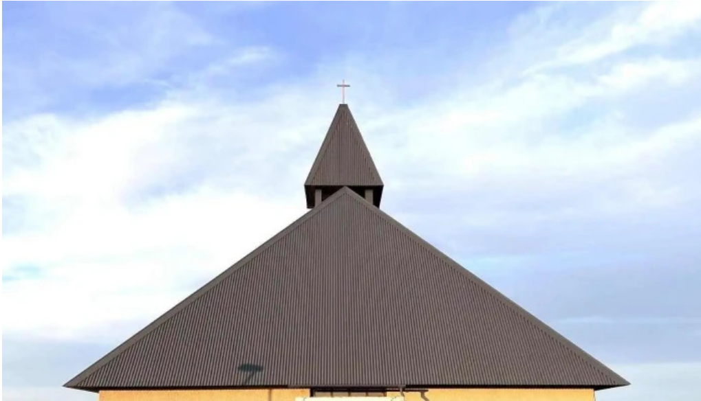
Thorlakshofn tjaldsvæði tjaldstæði