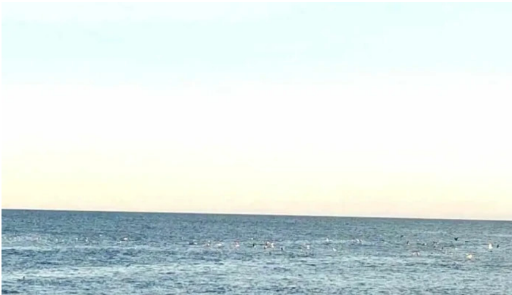
Thorlakshofn tjaldsvæði myndскеid