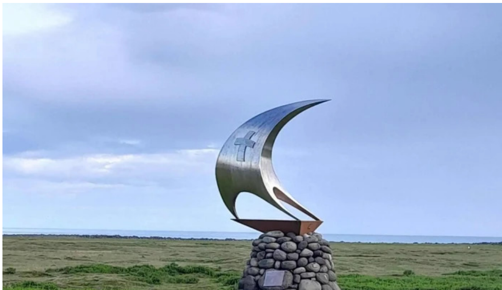
Thorlakshofn tjaldsvaedi opið nuna