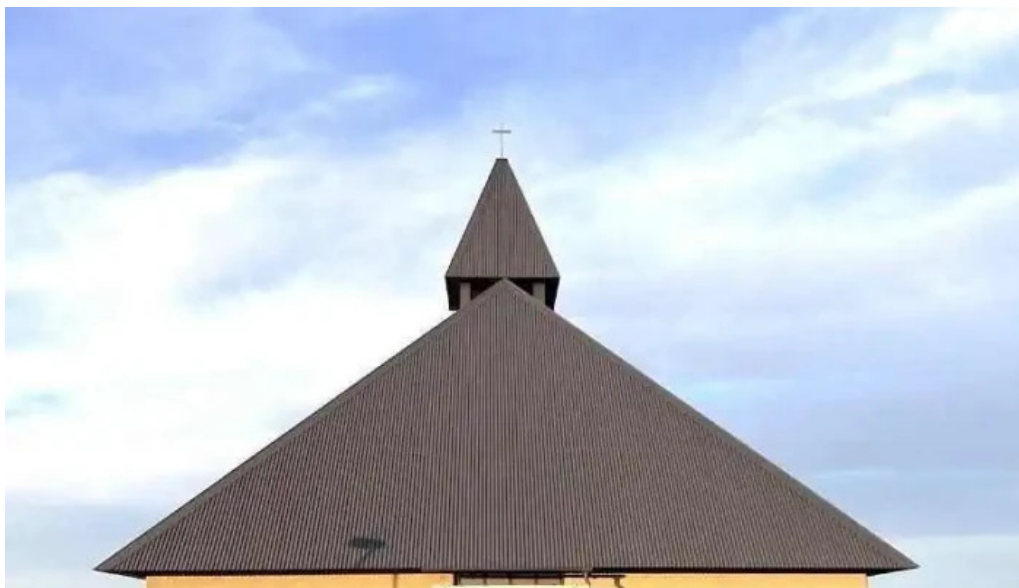
þorlákshöfn tjaldsvæði þorlákshöfn