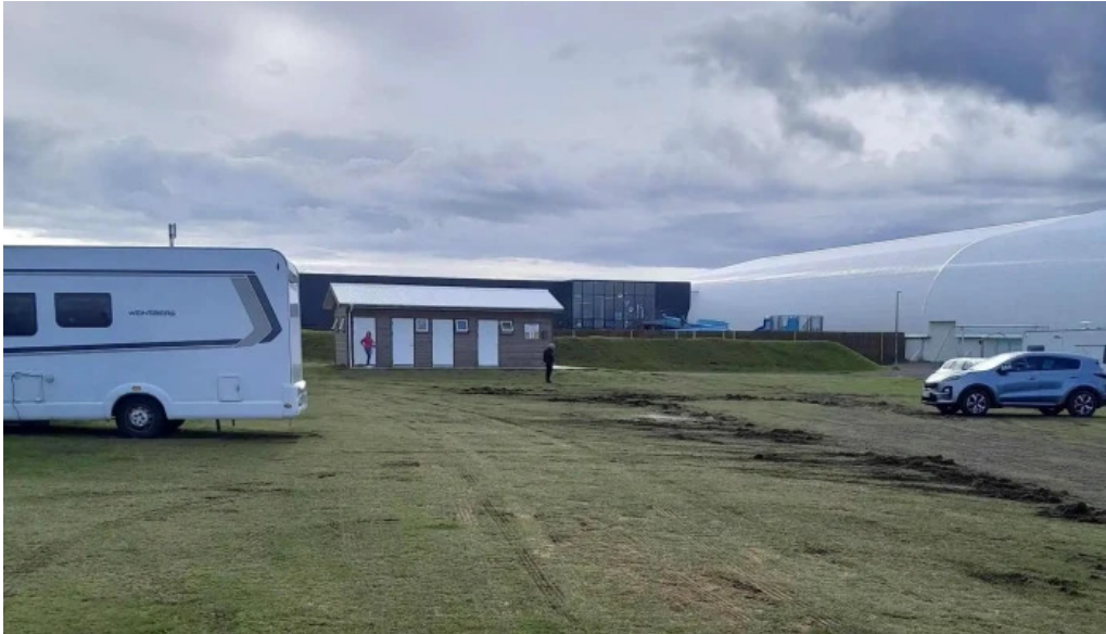
Thorlakshofn tjaldsvæði þorlakshofn