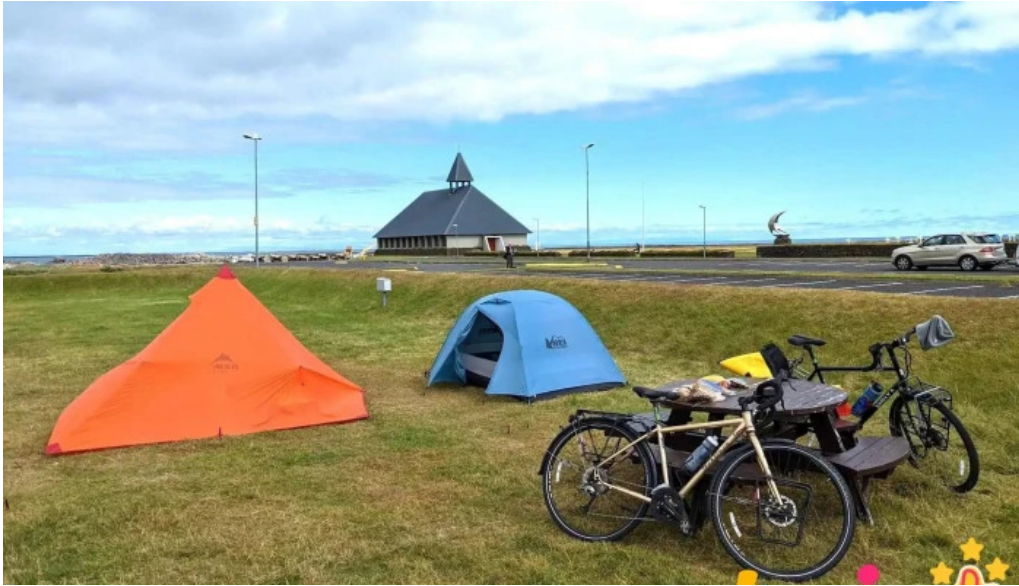
Thorlakshofn tjaldsvæði ganga