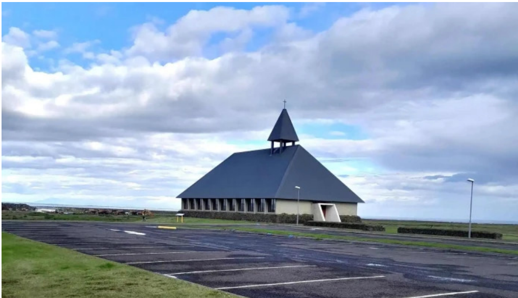
Thorlakshofn tjaldsvæði umsagnir