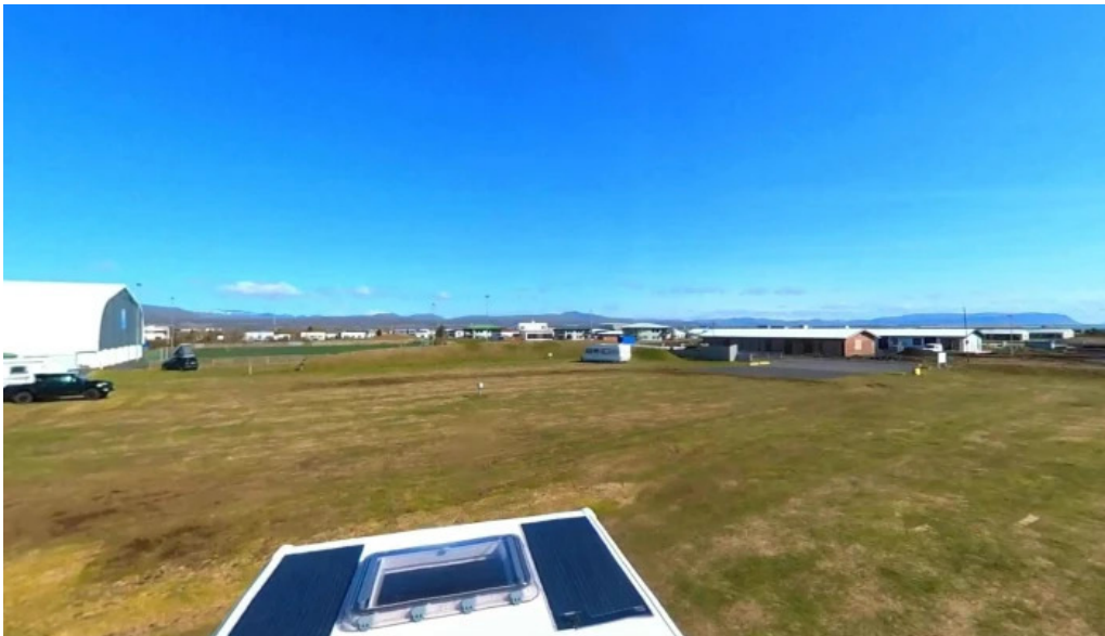
Thorlakshofn tjaldsvæði street view 360deg