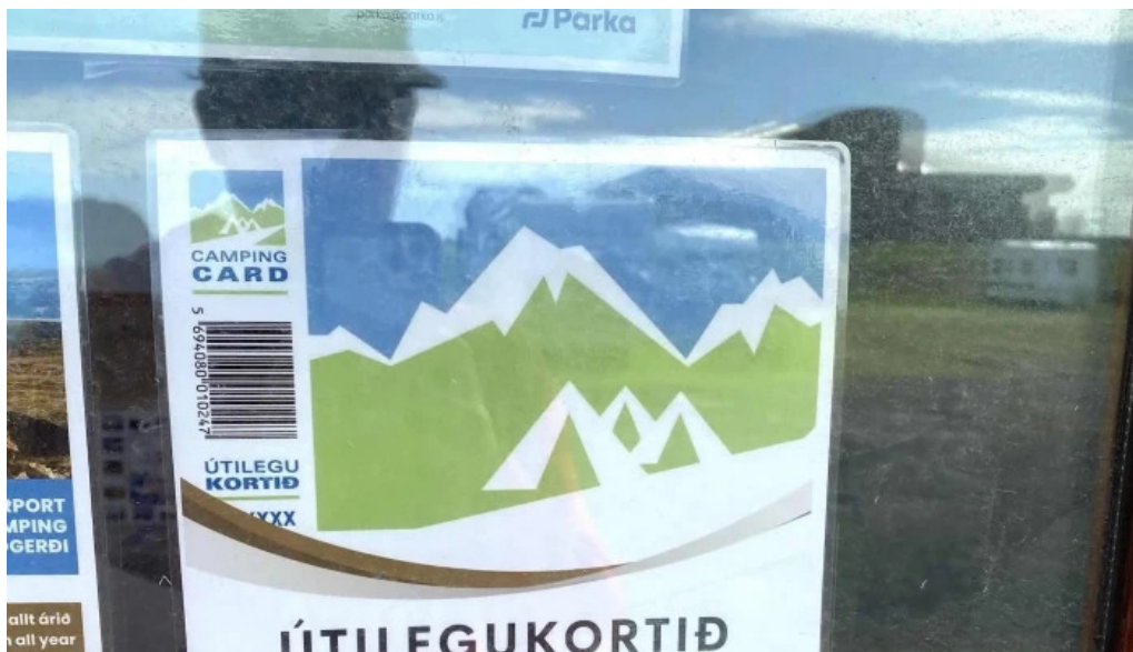
Thorlákshofn tjalðsvæði athugasemdir