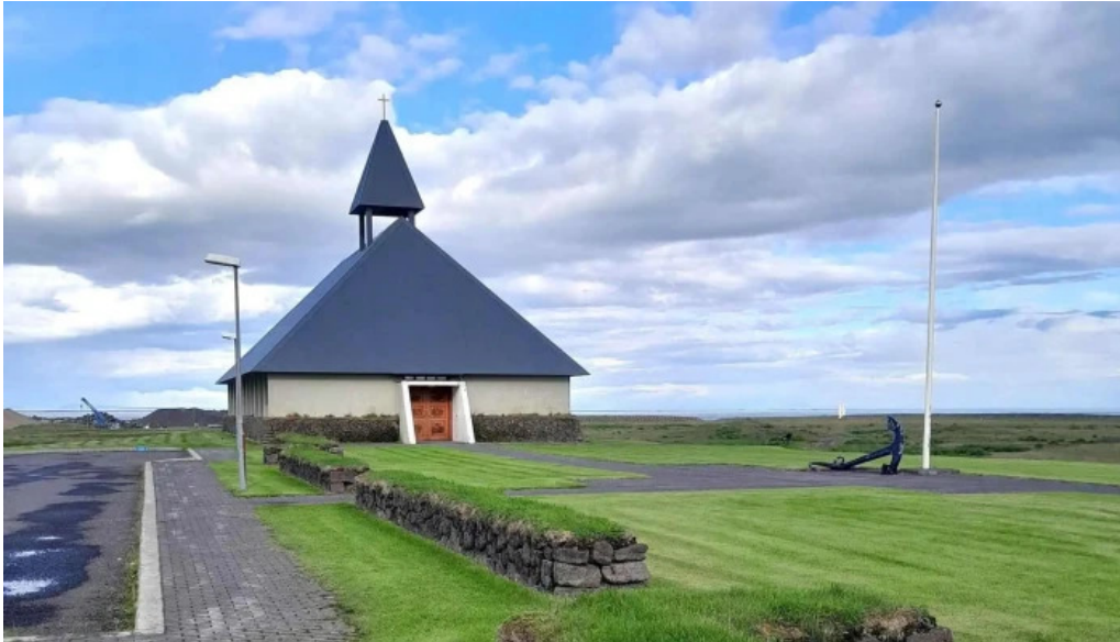
Thorlakshofn tjaldsvaedi kynning