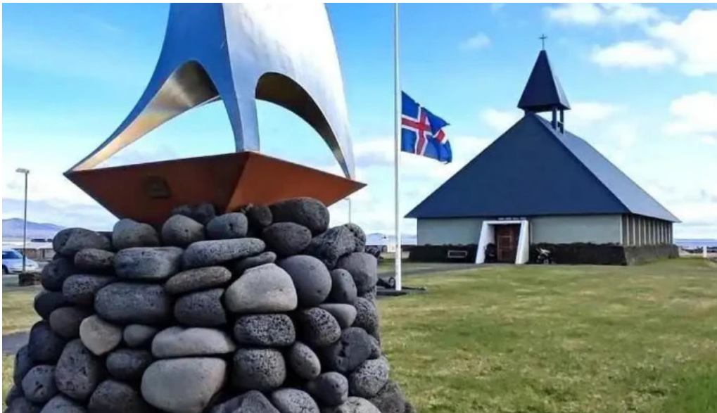
Thorlakshofn tjaldsvæði nærumhverfi