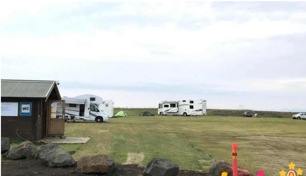
Vogar tjaldsvæði frá eiganda