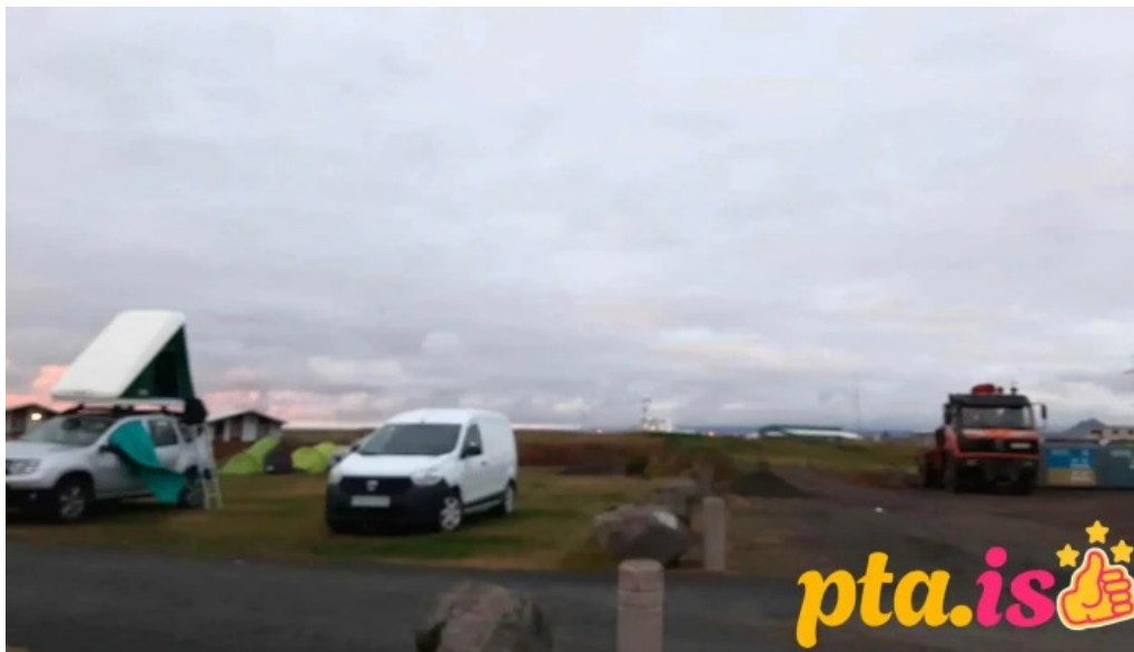
Vogar tjaldsvaedi myndskeld