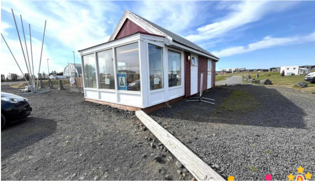
Vogar tjaldsvæði frá gestum