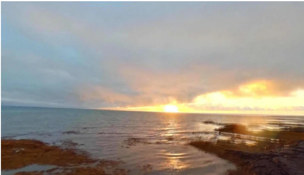
Vogar tjaldsvaedi street view 360deg