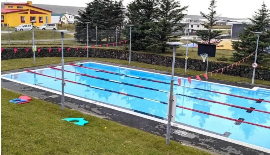
Vogar tjaldsvaedi thjonusta