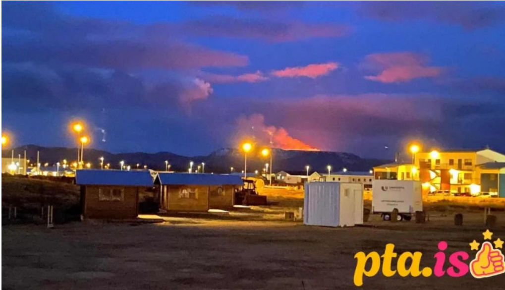
Vogar tjaldsvæði vogar