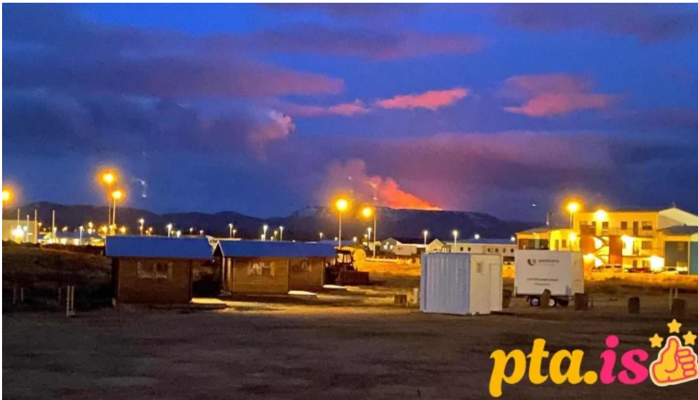
Vogar tjaldsvæði tjaldstæði