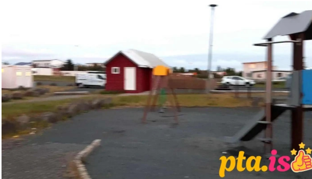
Vogar tjaldsvaedi naerumhverfi