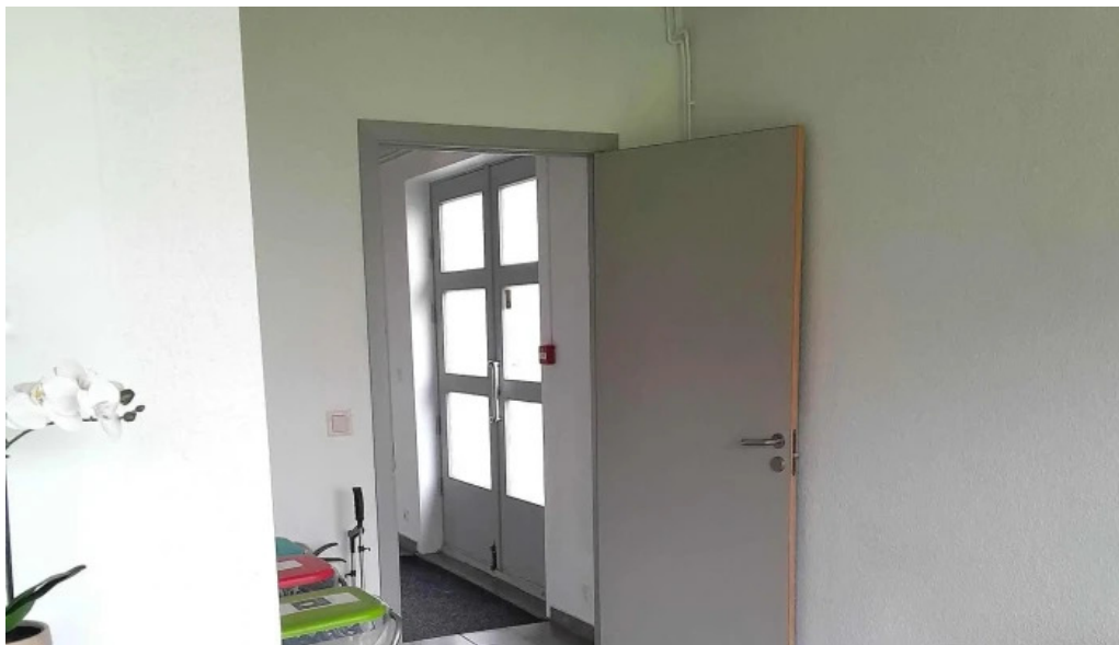
Thorsvollur tjaldsvæði numer