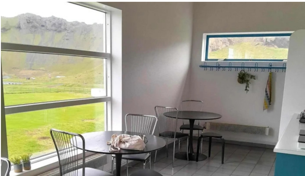
Thorsvollur tjaldsvæði staðsetning