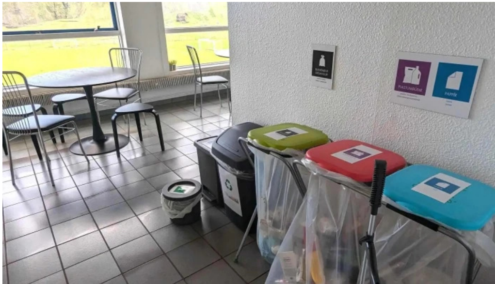
Thorsvollur tjaldsvæði myndir