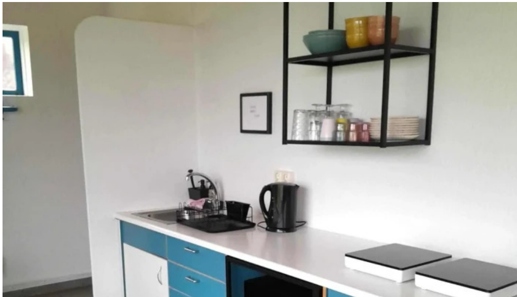
Thorsvollur tjaldsvæði simi