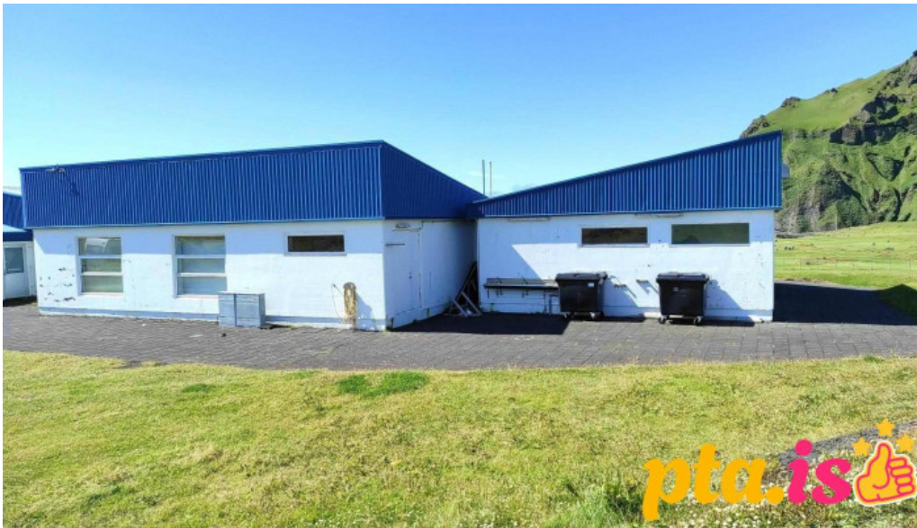
Thorsvollur tjaldsvæði tjaldstæði