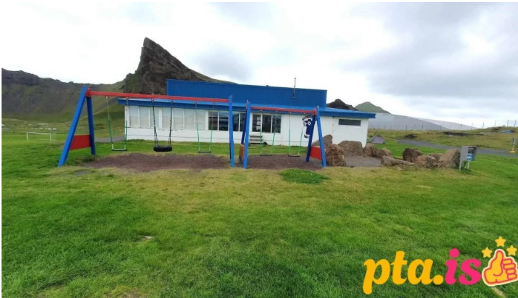
Thorsvollur tjaldsvaedi naerumhverfi