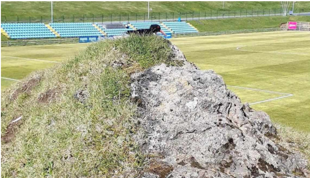
Thorsvollur tjaldsvæði frá gestum