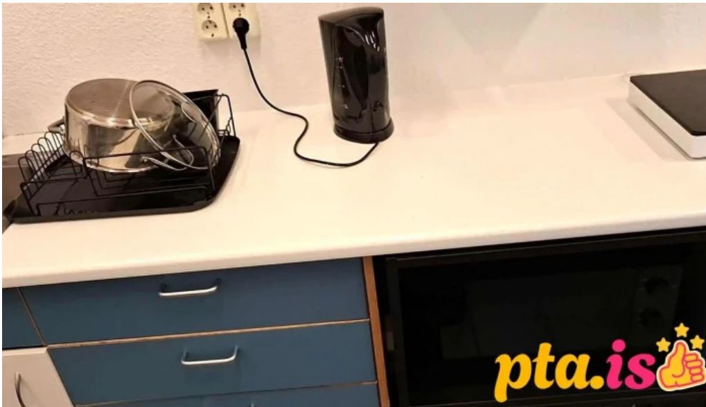
Thorsvollur tjaldsvaedi myndskaid