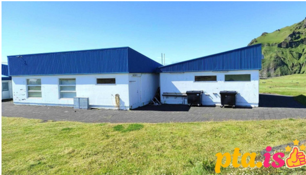
Þorsvollur tjaldsvæði vestmannaeyjabær