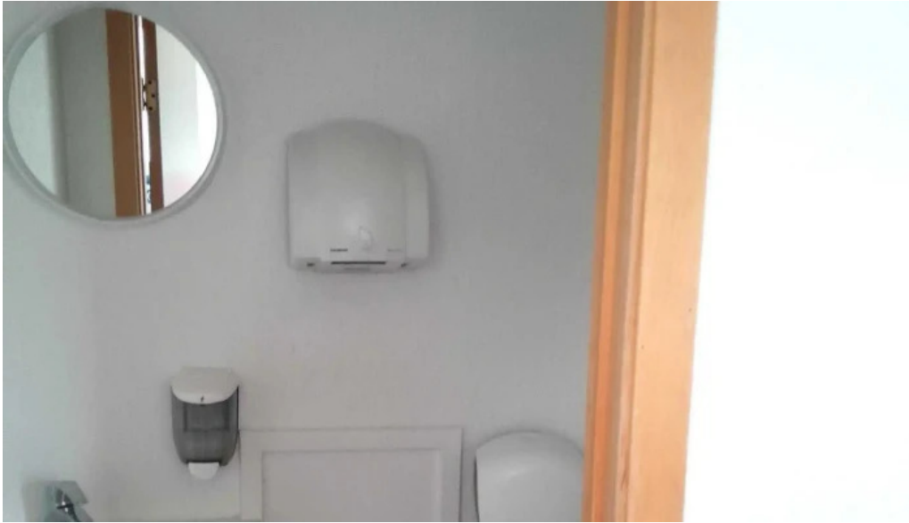
Thorsvollur tjaldsvæði heimilisfang