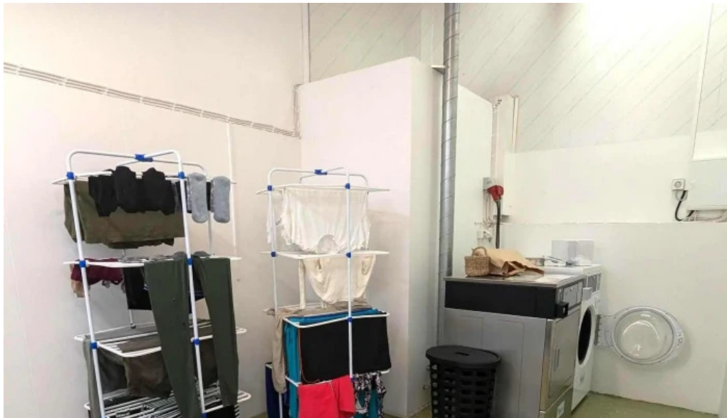
Thorsvollur tjaldsvæði myndbond