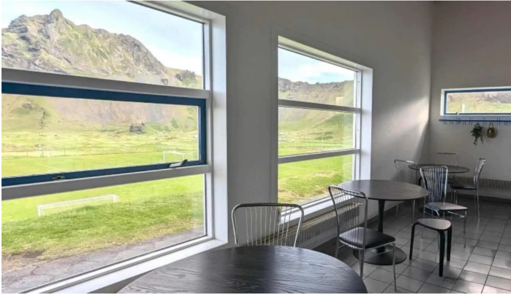
Thorsvollur tjaldsvæði hvar