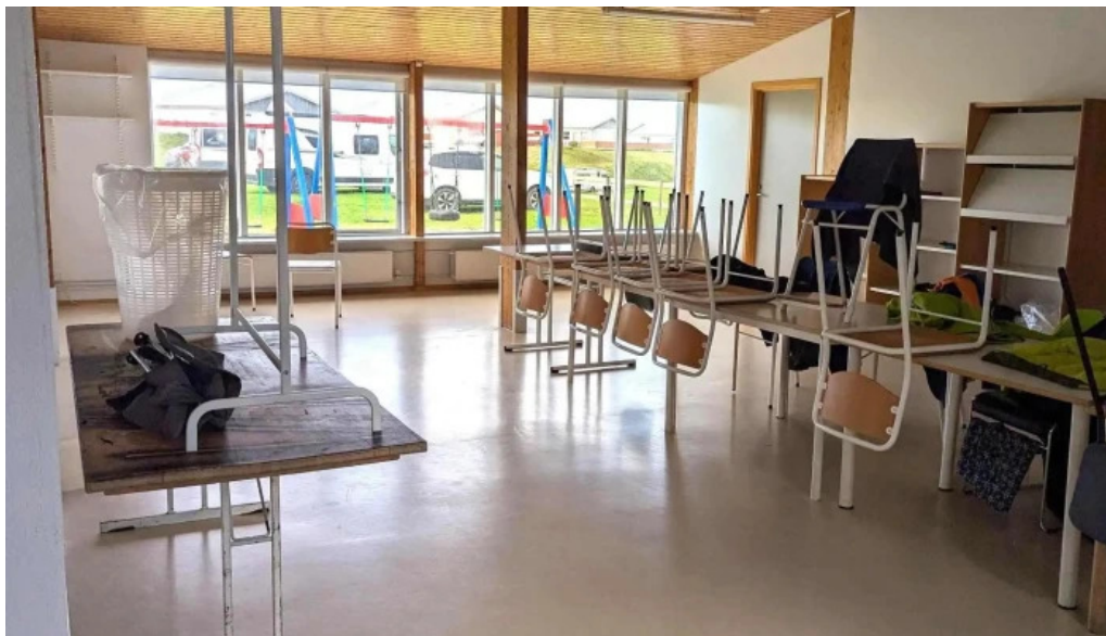
Þorsvollur tjaldsvæði vestmannaeyjabær