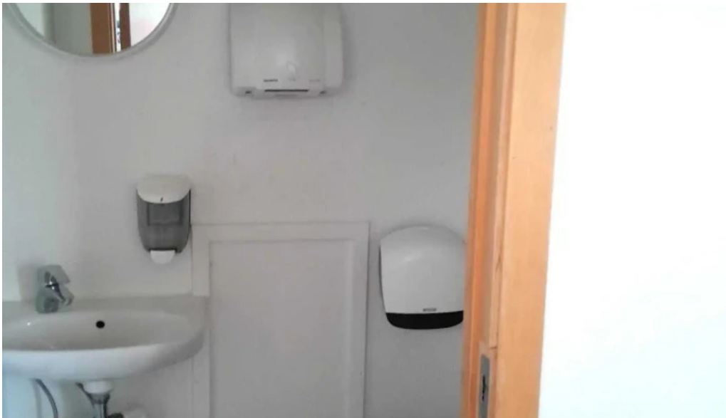
Thorsvollur tjaldsvæði herbergi