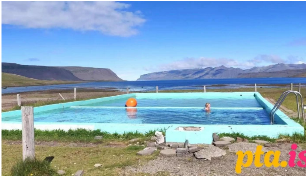
Thingeyraroddi tjaldsvæði thjonusta