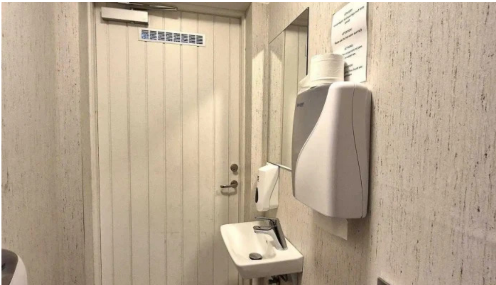
Thingeyraroddi tjaldsvæði herbergi