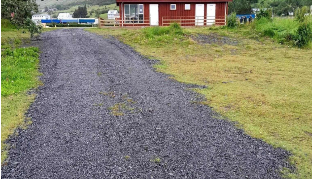
Thingeyraroddi tjaldsvaedi naerumhverfi