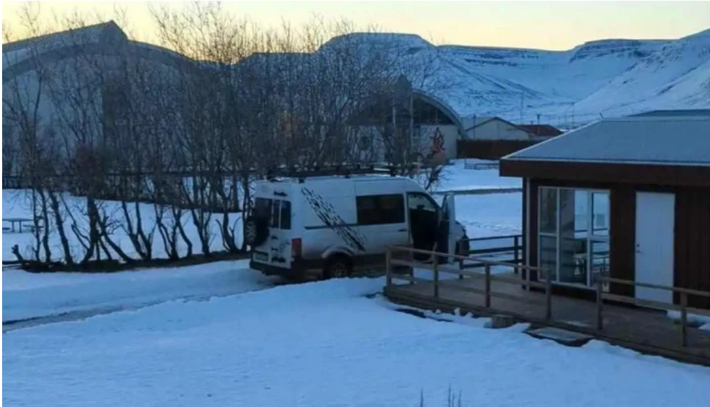
Thingeyraroddi tjaldsvæði frá gestum