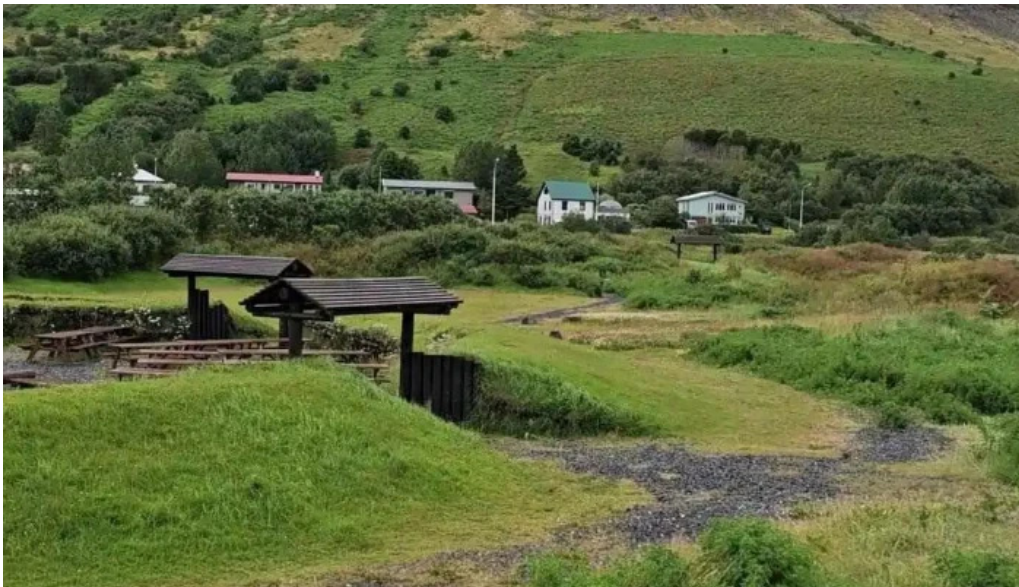
Thingeyraroddi tjaldsvaedi myndskaid