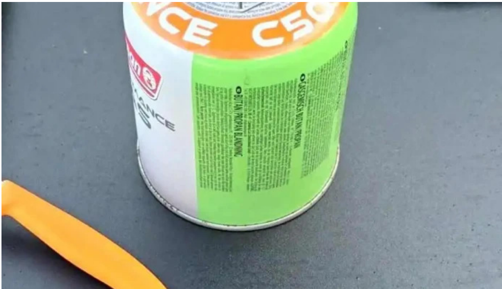
Thingeyraroddi tjaldsvæði matur og drykkur