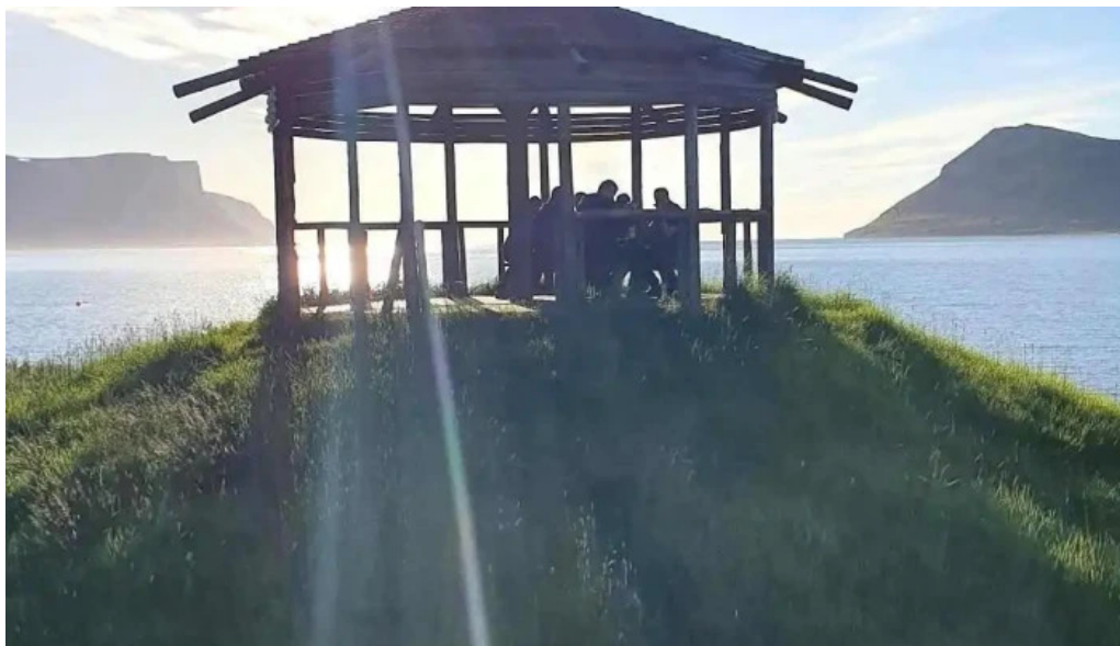
Thingeyraroddi tjaldsvæði stöðuvatn