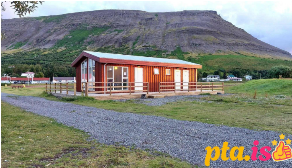
Thingeyraroddi tjaldsvæði tjaldstæði