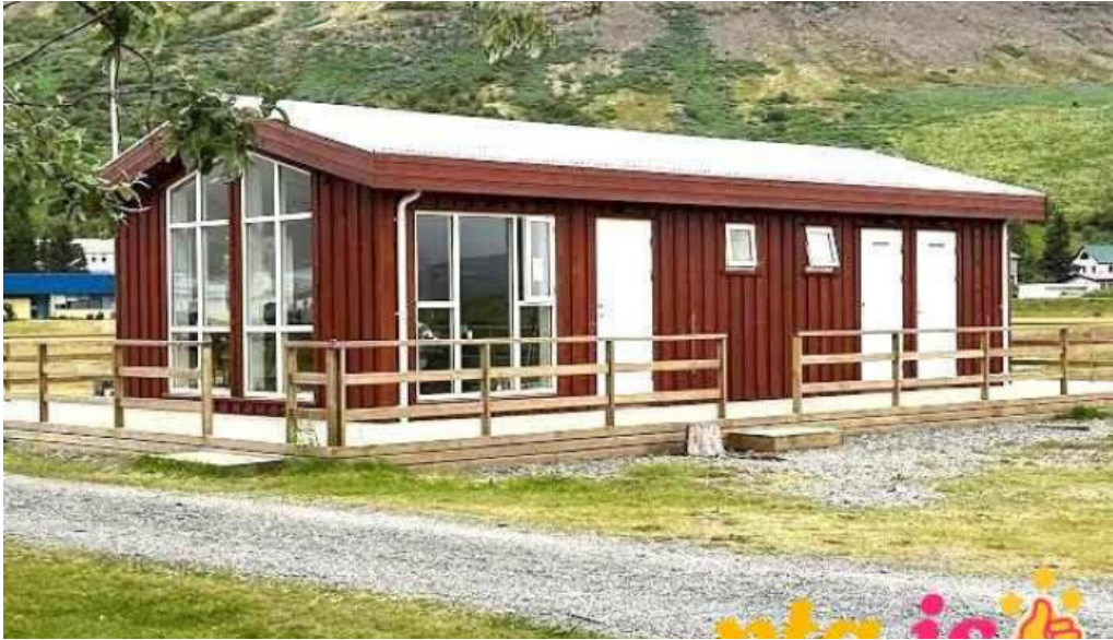
Þingeyraroddi tjaldsvæði thingeyri