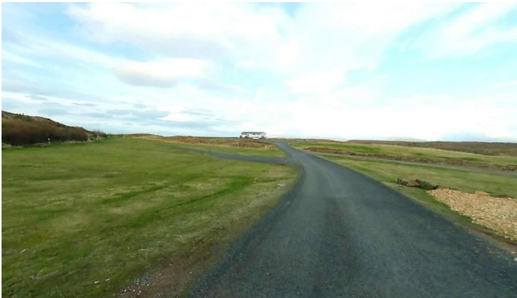
Tjaldstaedi street view 360deg