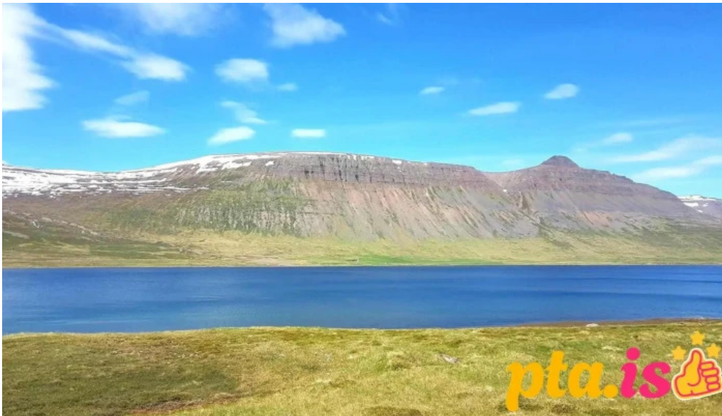
Tjaldstaedi fra gestum