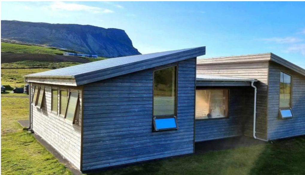
Olafsvik tjaldsvæði olafsvik