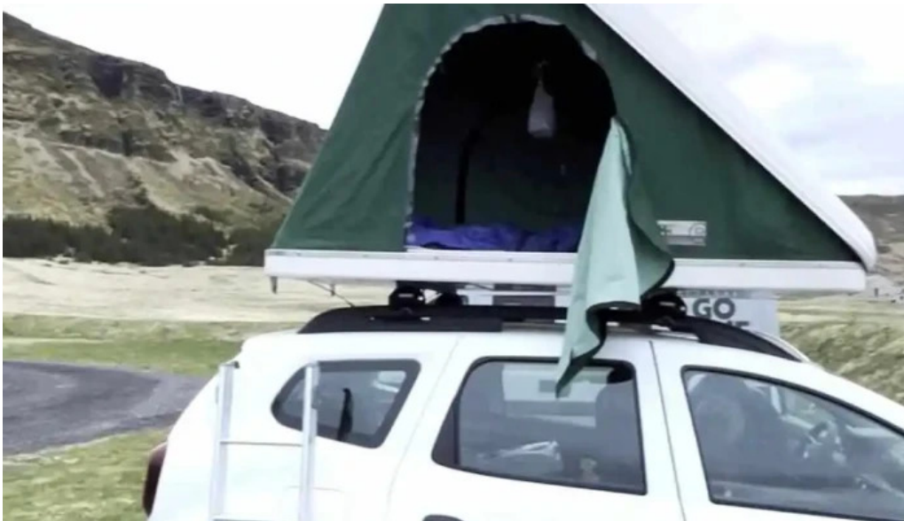
Olafsvik tjaldsvaedi myndskaid