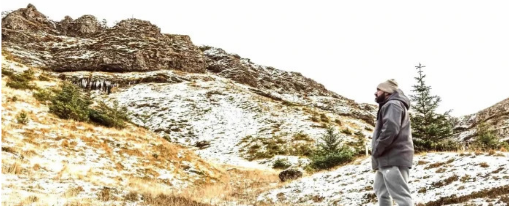
Olafsvik tjalldsvaedi umsagnir