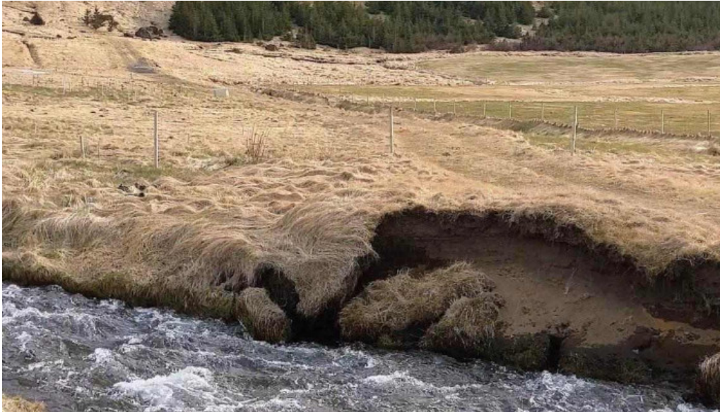
Olafsvik tjaldsvæði fra gestum