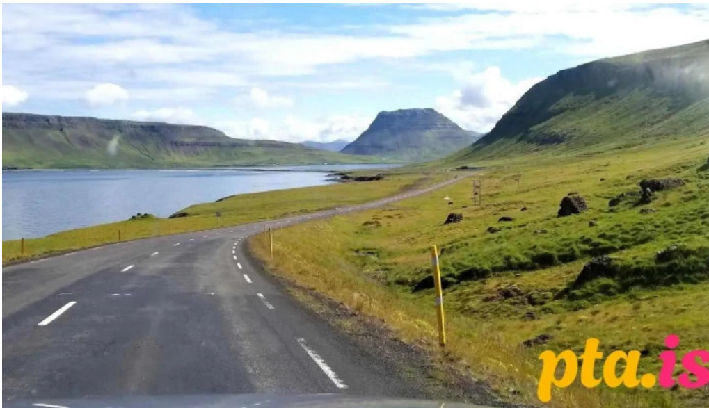
Olafsvik tjaldsvaedi naerumhverfi