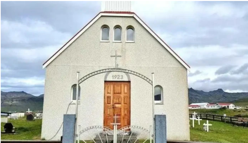
Olafsvik tjaldsvæði olafsvik