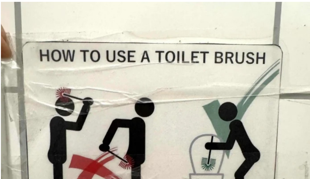
Olafsvik tjaldsvæði svæði