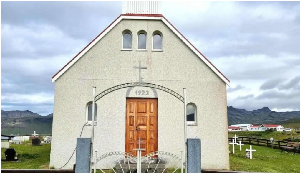
Olafsvik tjaldsvæði tjaldstæði