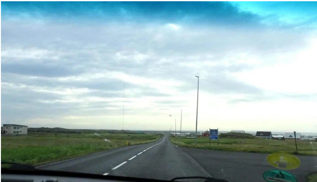
Olafsvik tjaldsvæði verð