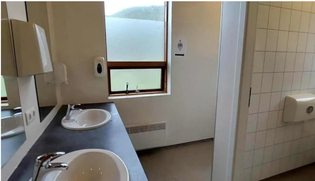
Olafsvik tjaldsvaedi herbergi