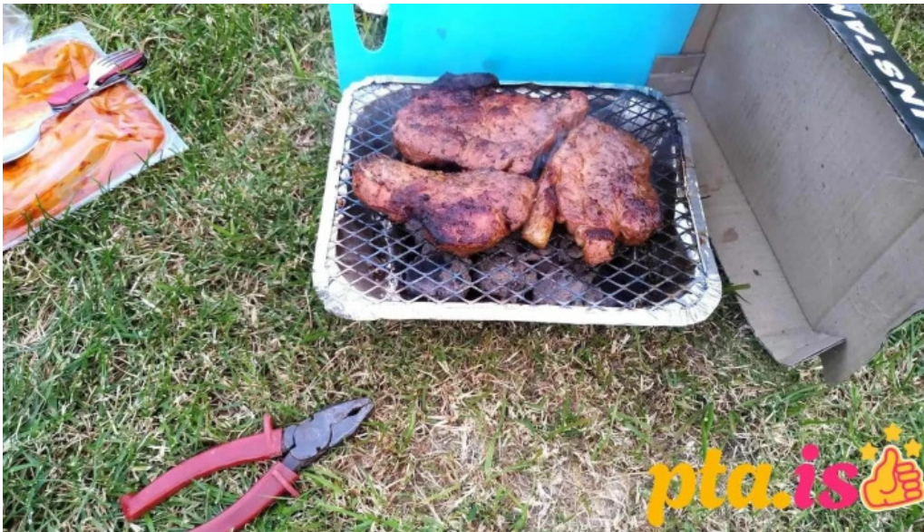
Olafsvik tjaldsvaedi matur og drykkur