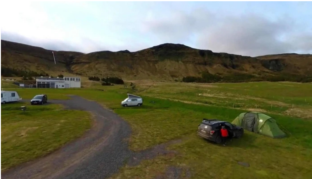
Olafsvik tjaldsvæði street view 360deg