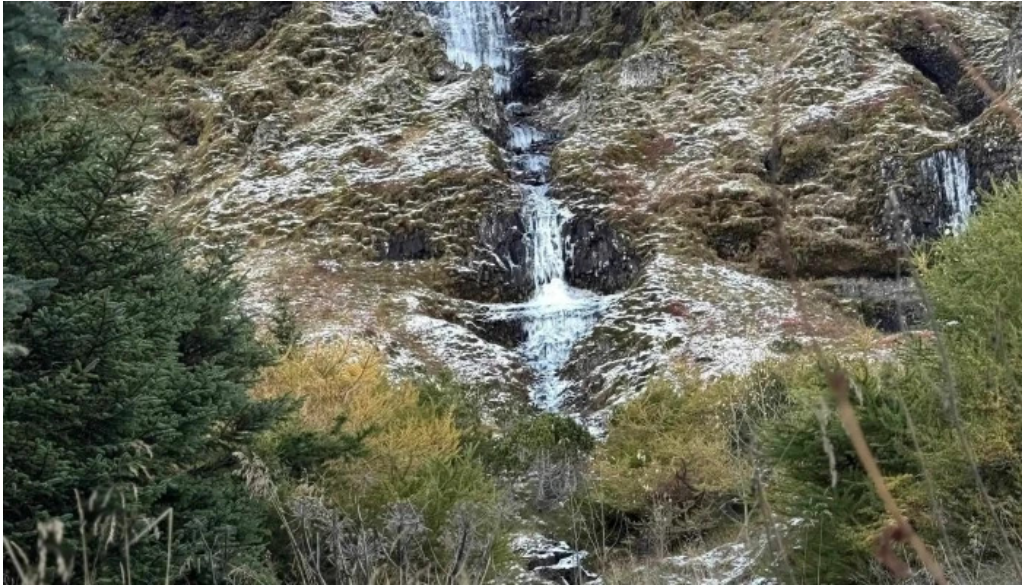
Olafsvik tjaldsvaedi instagram