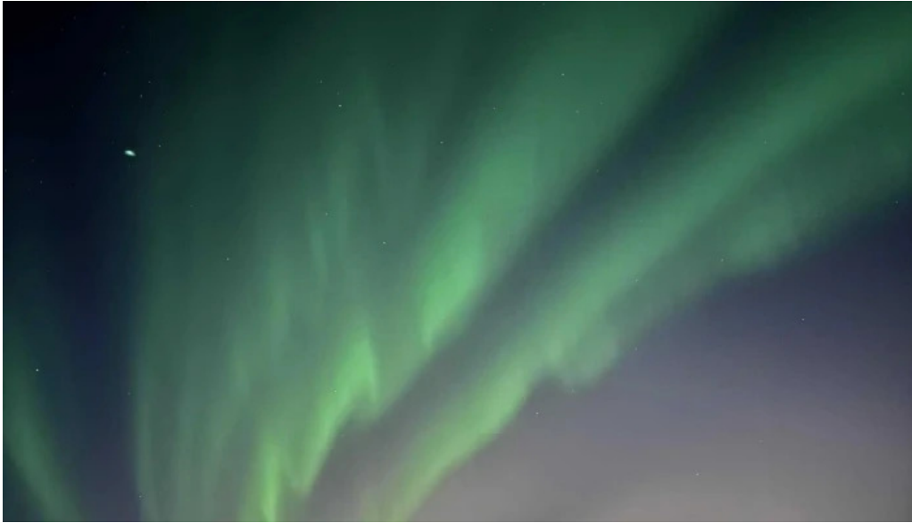
Olafsvik tjalldsvaedi vefsiða