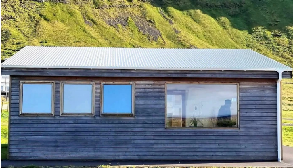
Olafsvik tjaldsvaedi myndbond