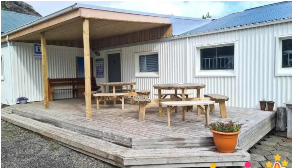
Hjalli kjos kjosahreppur