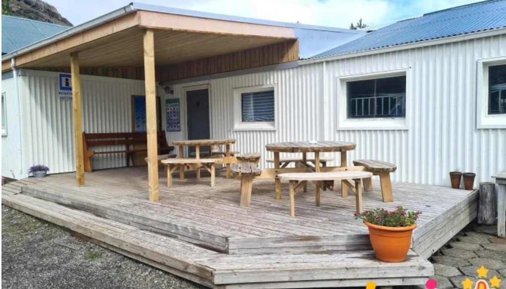
Hjalli kjos tjaldstæði