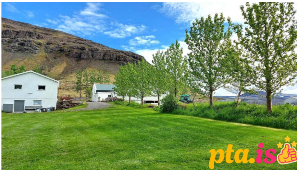
Hjalli kjos fra gestum