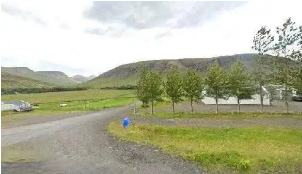
Hjalli kjos street view 360