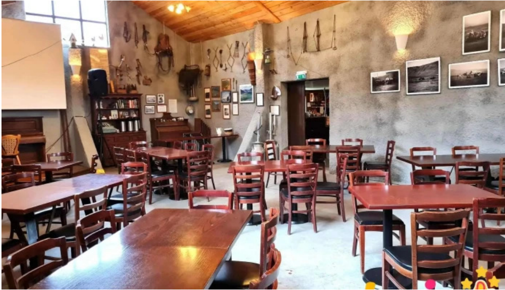
Hjalli kjos fra eiganda