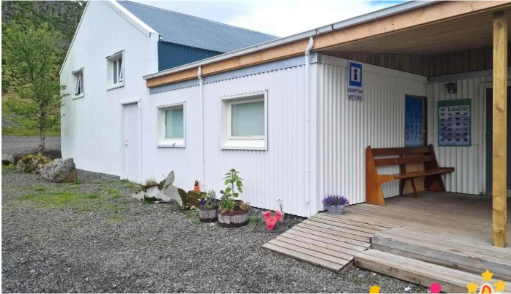
Hjalli kjos nærumhverfi