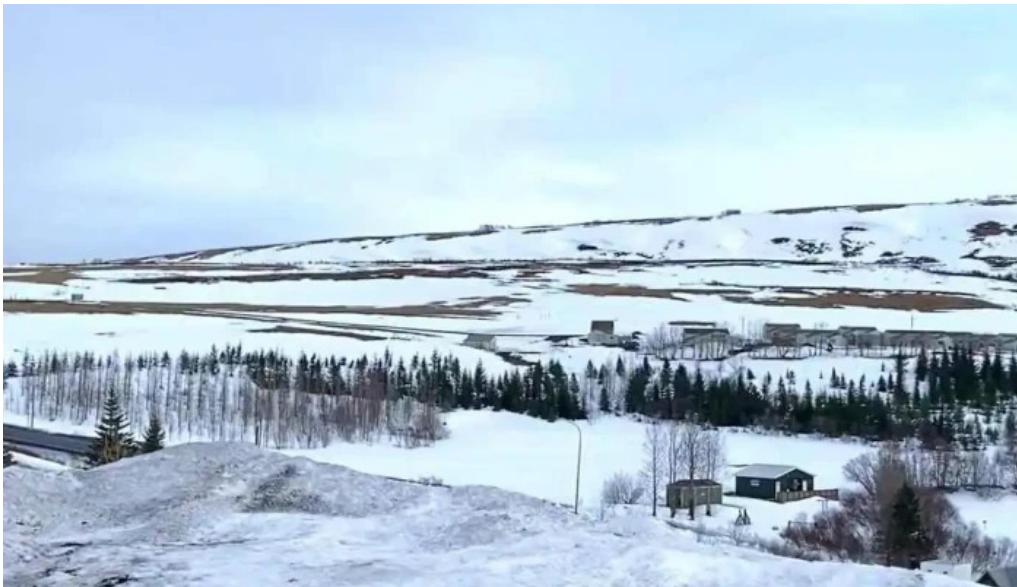
Husavik tjaldsvæði myndskild