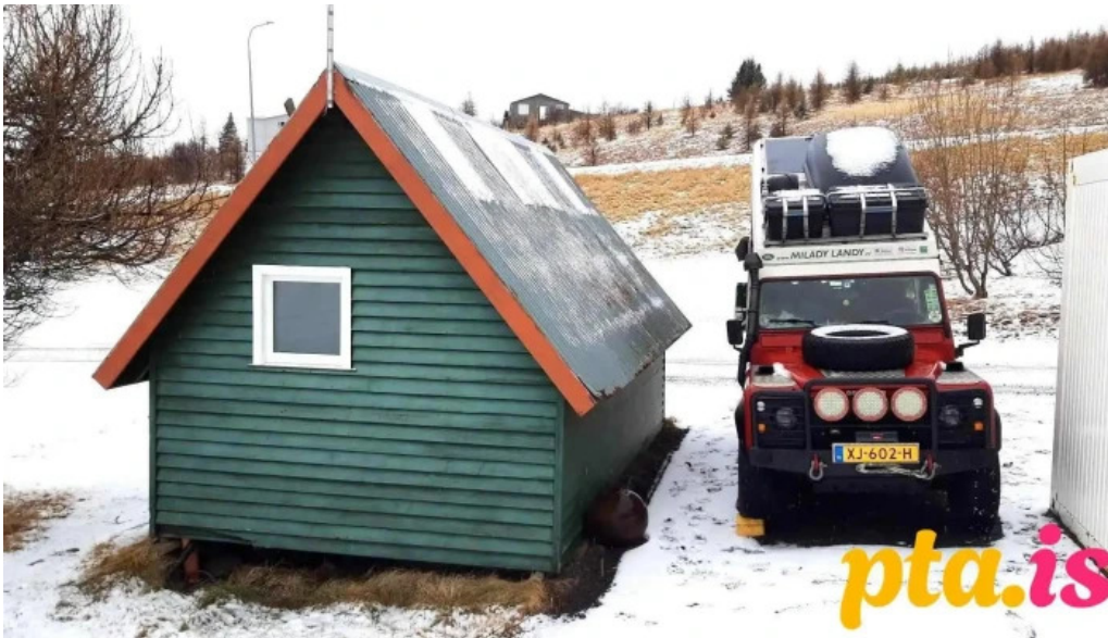
Husavik tjaldsvæði tjaldstæði