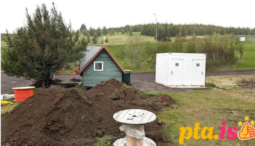
Husavik tjaldsvæði nærumhverfi