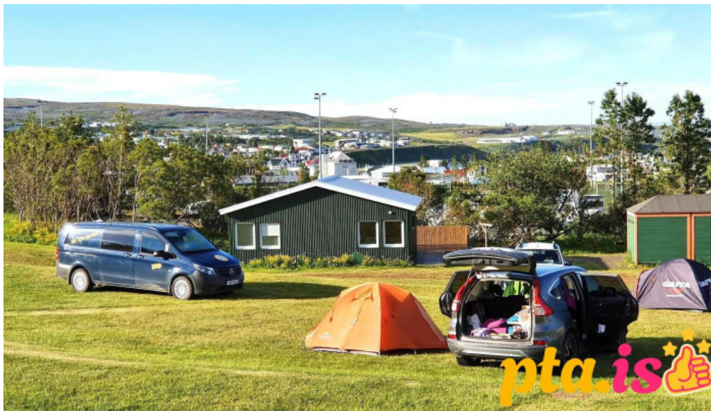
Husavik tjaldsvæði ganga