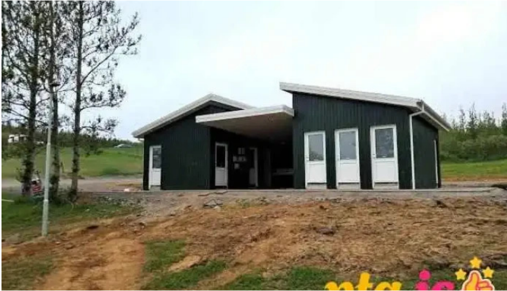
Husavik tjaldsvæði husavik