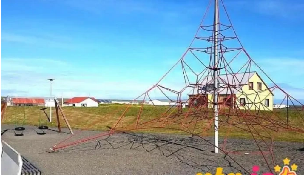
Tjaldsvæði grindavíkur grindavík