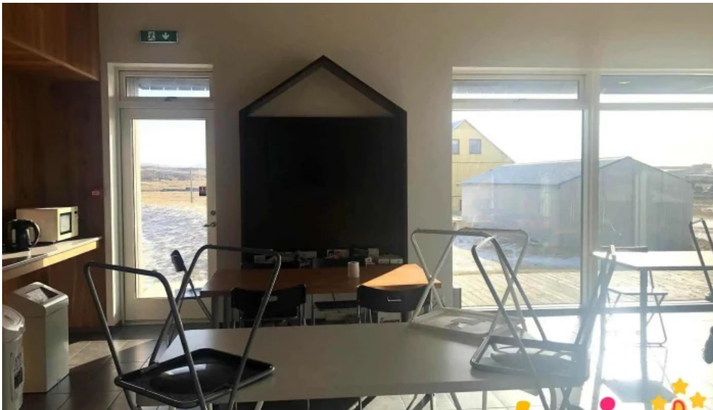
Tjaldsvæði grindavíkur herbergi