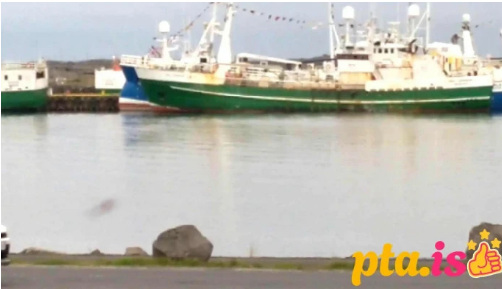
Tjaldsvæði grindavíkur naerumhverfi