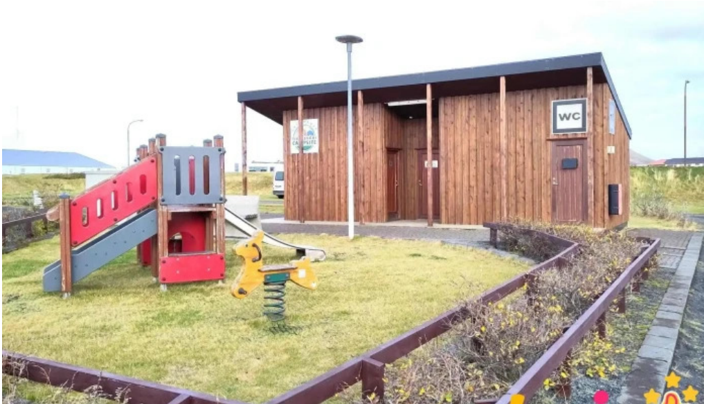
Tjaldsvæði grindavíkur frá gestum