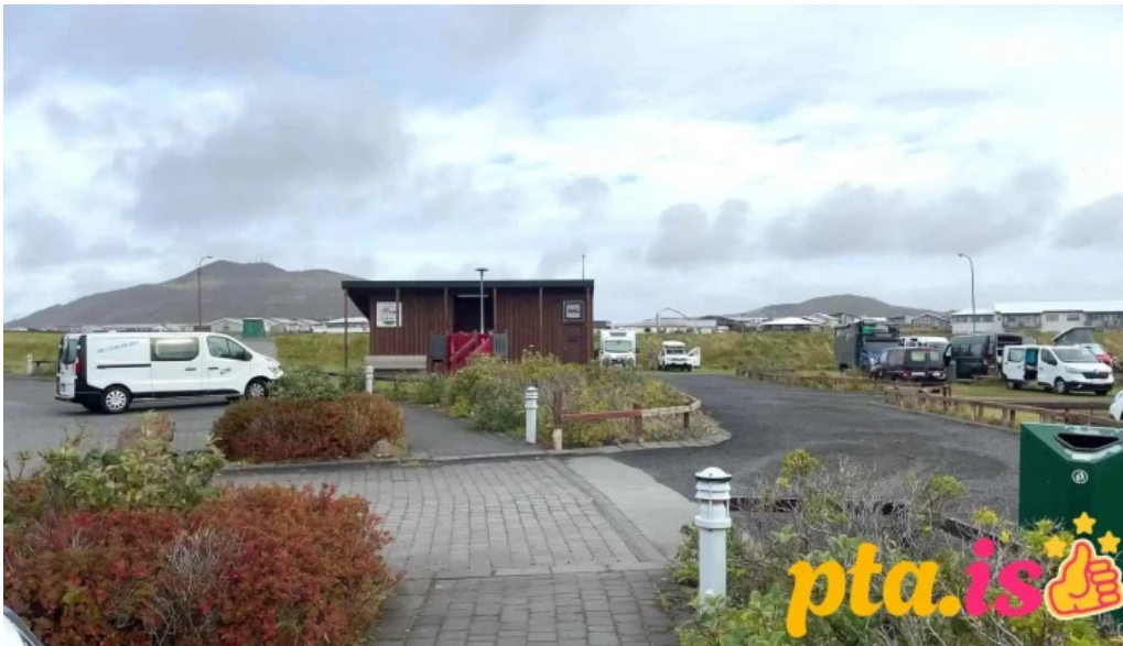
Tjaldsvæði grindavíkur myndskeld