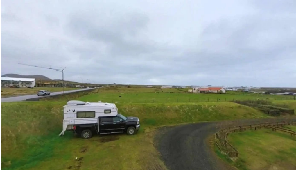
Tjaldsvæði grindavíkur street view 360deg