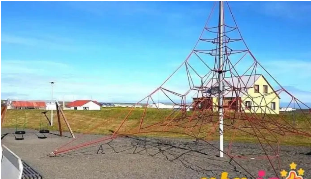
Tjaldsvæði grindavíkur tjaldstæði