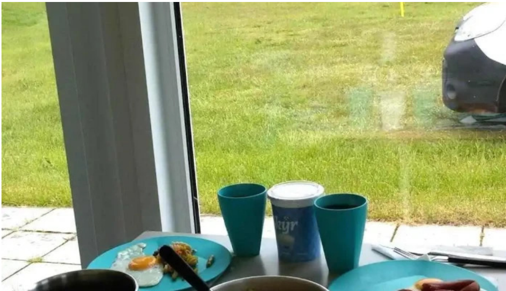
Tjaldsvæði matur og drykkur