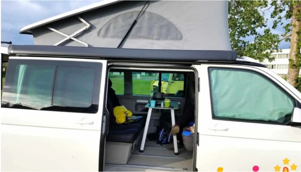
Tjaldsvaedi fra gestum