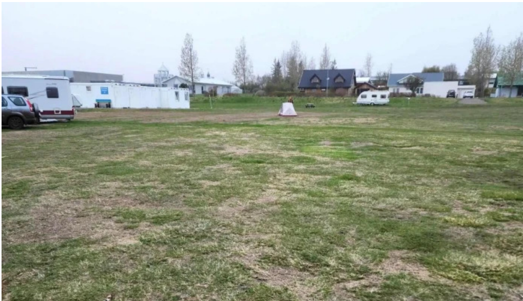
Tjaldsvæði hvernig á að komast þangað