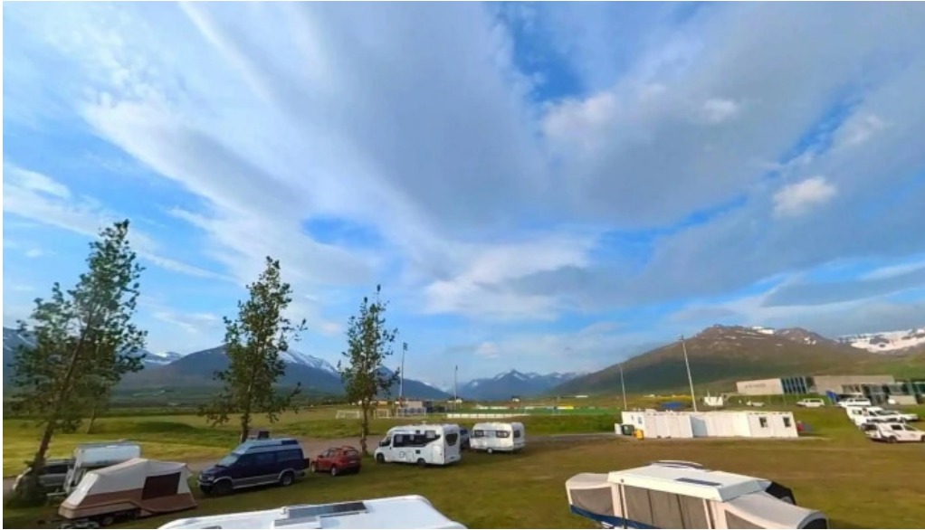
Tjaldsvædi street view 360deg