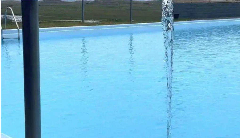
Hreppslaug fra eiganda