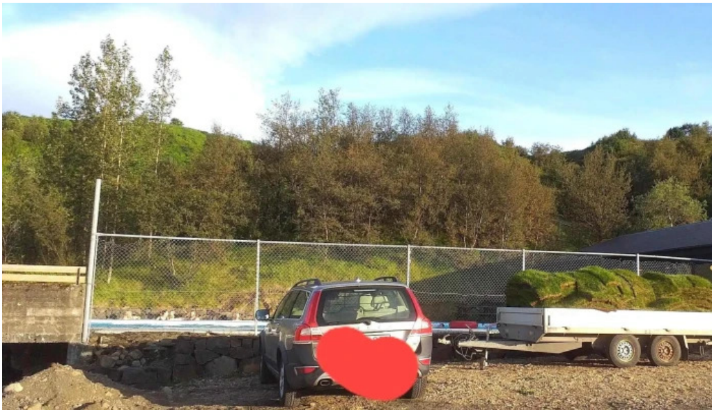
Hreppslaug opið nuna