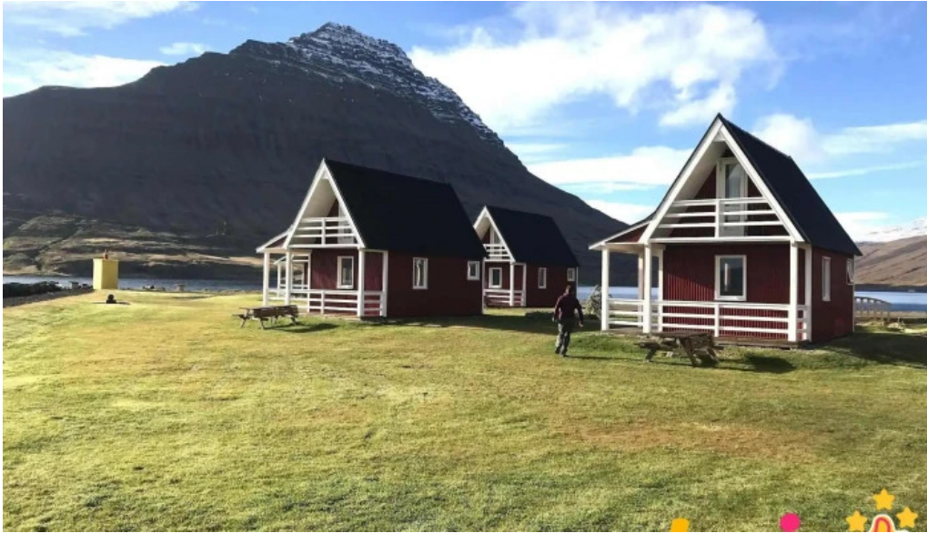
Ferdathjonustan mjoeyri naerumhverfi