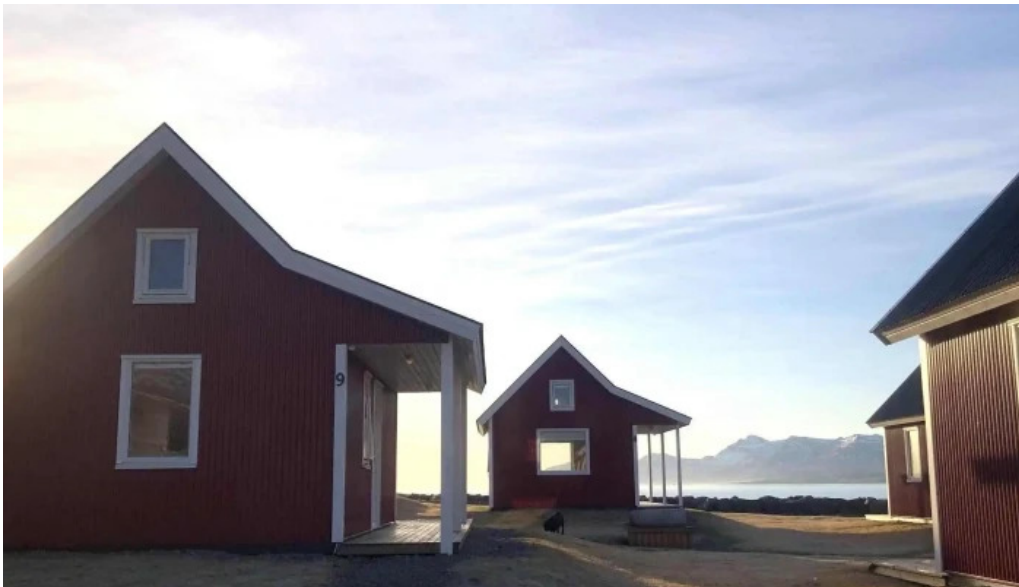
Ferdathjónustan mjoeyri verð