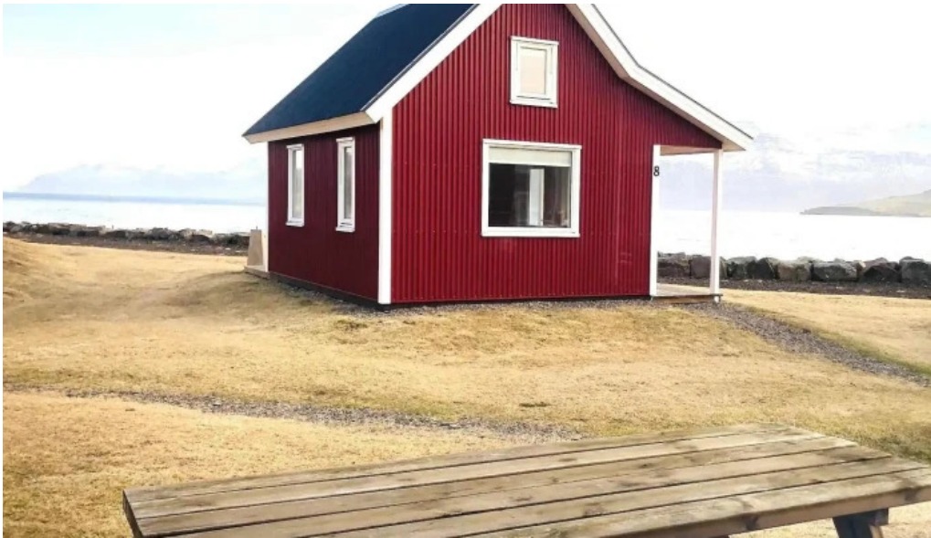
Ferdathjonustan mjoeyri myndir