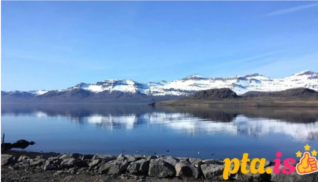
Ferdathjonustan mjoeypri fra gestum