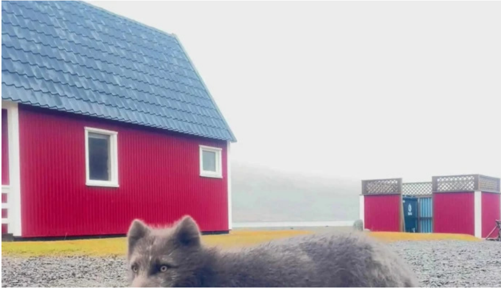
Ferdathjonustan mjoeyri umsagnir