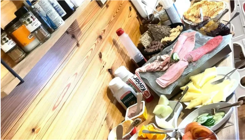
Ferdathjonustan mjoeyri simi