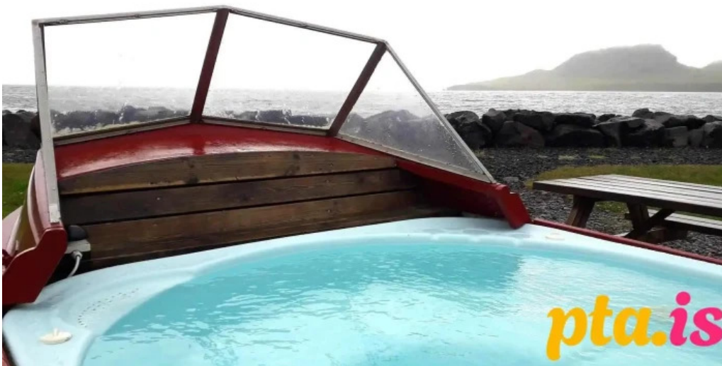
Ferdathjonustan mjoeyri thjonusta