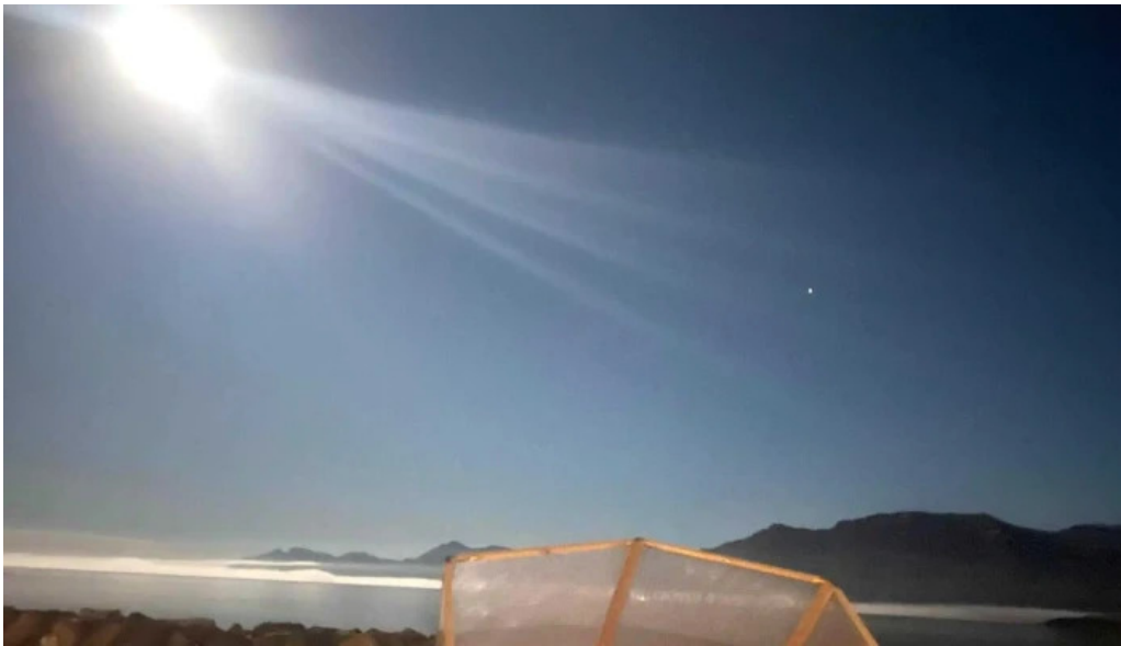
Ferdathjonustan mjoeyri instagram