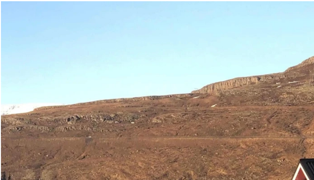
Ferdathjonustan mjoeypri eskifjorður