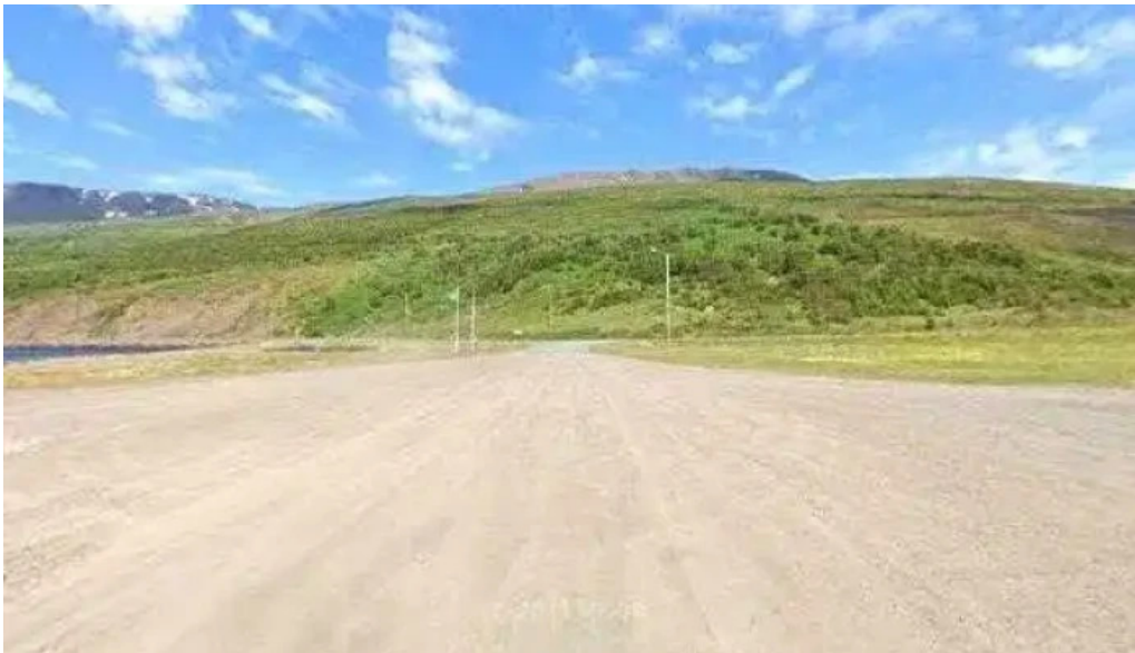
Ferdathjonustan mjoeyri street view 360deg