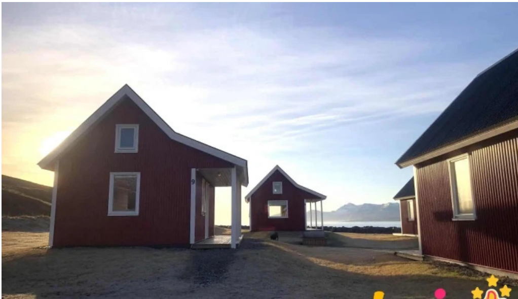
Ferdathjonustan mjoeyri nyjast