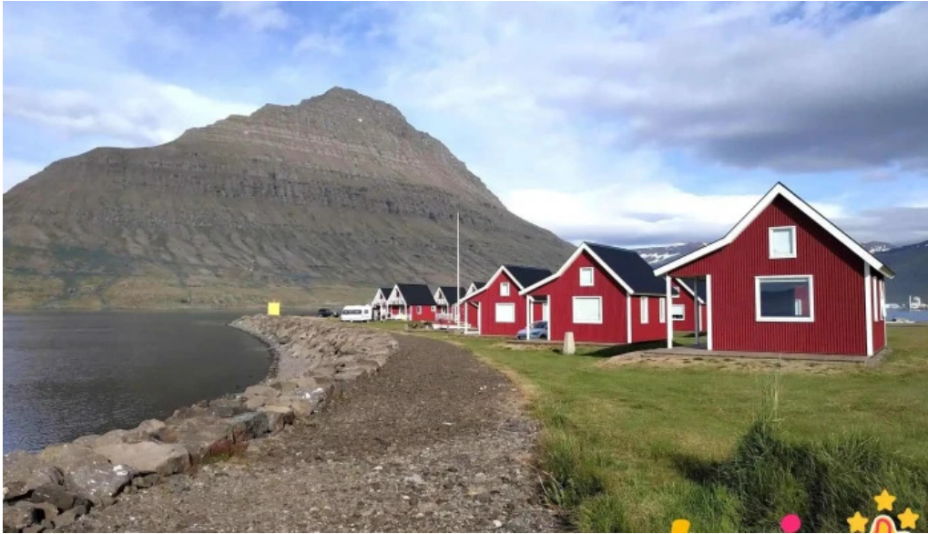
Ferdathjonustan mjoeyri sumarleyfisibuð