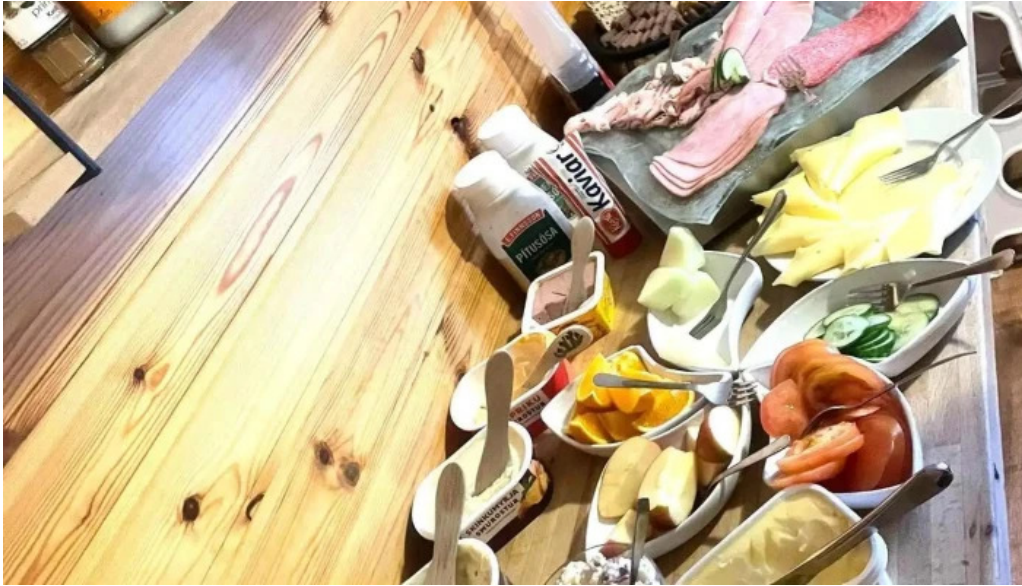
Ferdathjonustan mjoeyri matur og drykkur