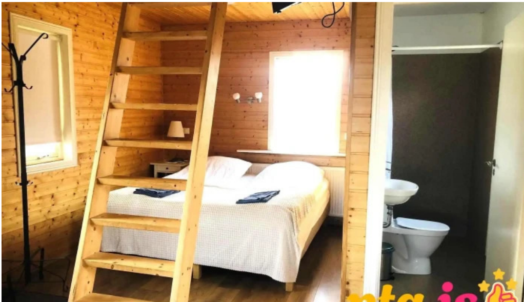
Ferdathjonustan mjoeyri herbergi