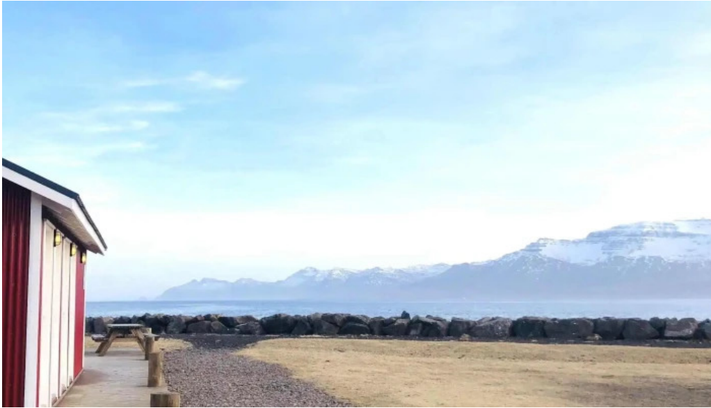
Ferdathjonustan mjoeyri hvernig a að komast þangað