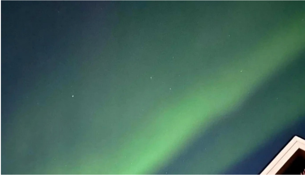
Ferdathjonustan mjoeyri afslættir