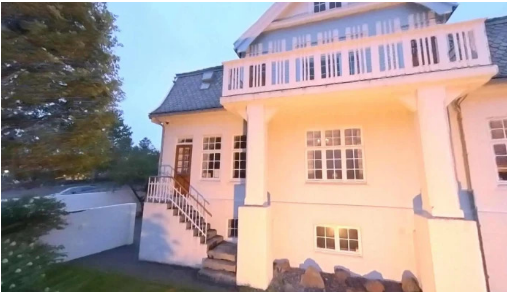
Skrifstofa forseta islands street view 360