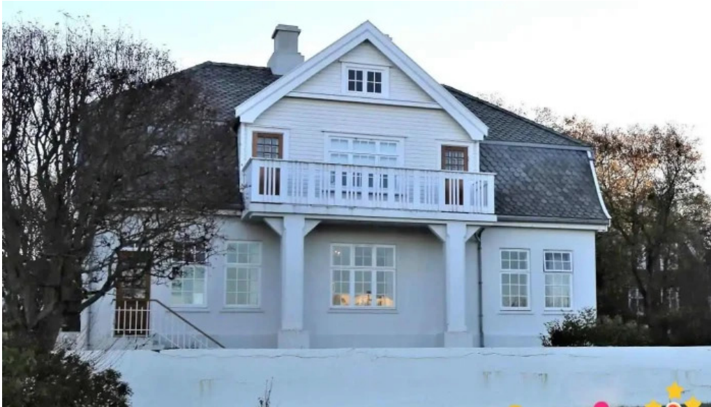
Skrifstofa forseta Íslands Reykjavík