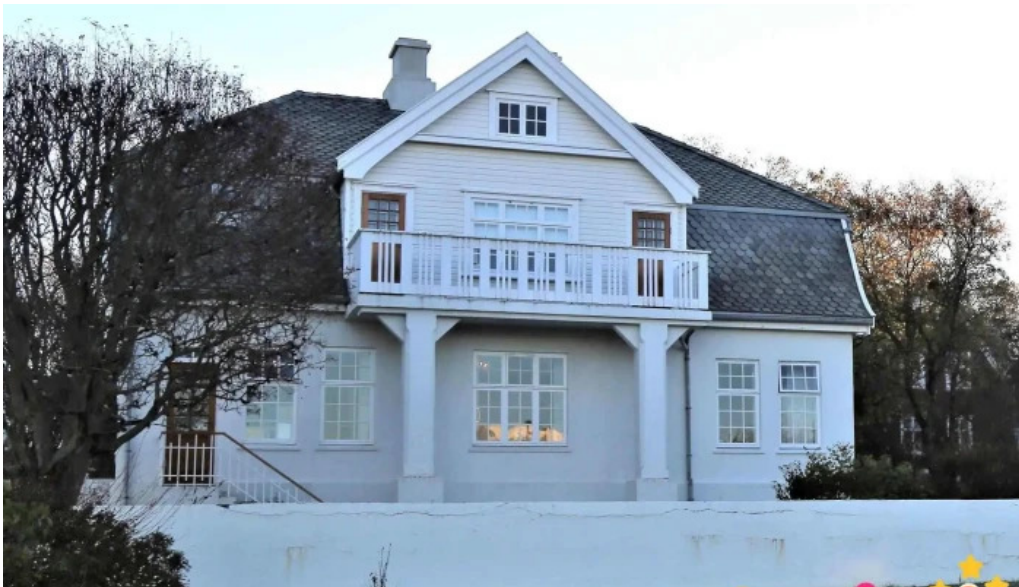
Skrifstofa forseta islands stjornvold