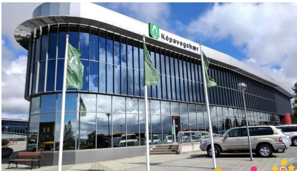
Bæjarskrifstofur kópavogs stjornvold