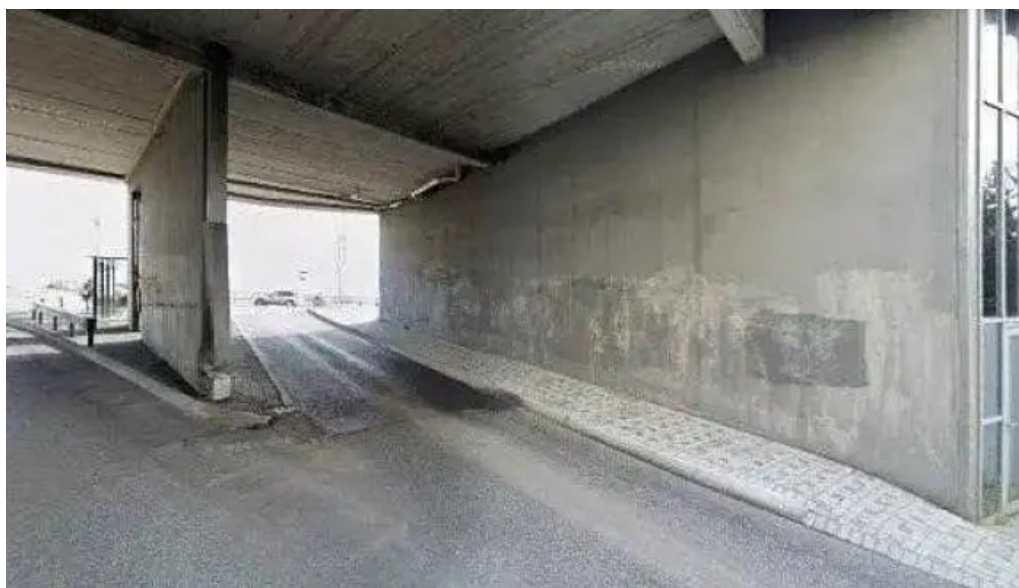
Bæjarskrifstofur kopavogs street view 360deg