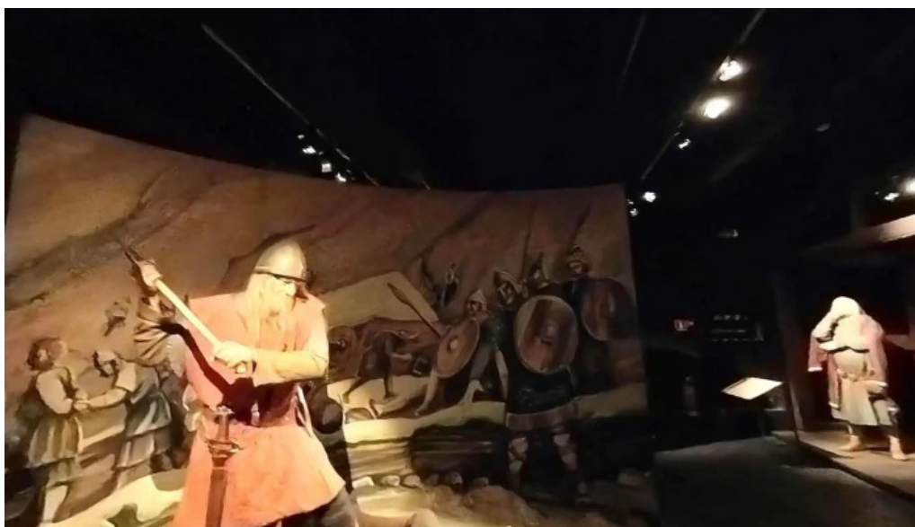
Sogusafnid street view 360