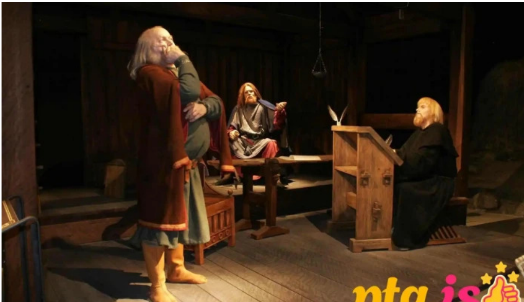
Sogusafnid fra eiganda