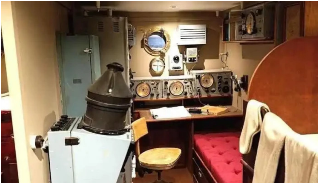
Pakkhúsið byggðasafn hafnarfjarðar hafnarfjorður