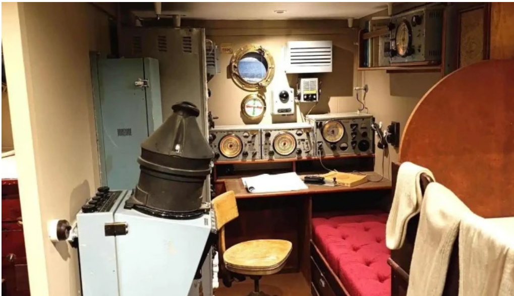
Pakkhusid byggdasafn hafnarfjardar sogusafn