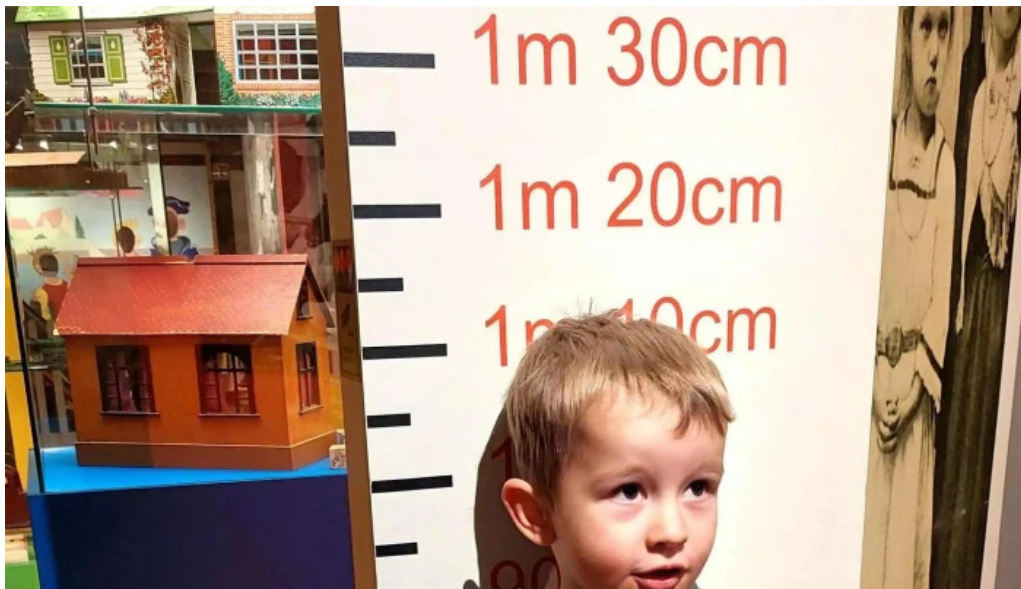
Pakkhusid byggdasafn hafnarfjardar vefsiða