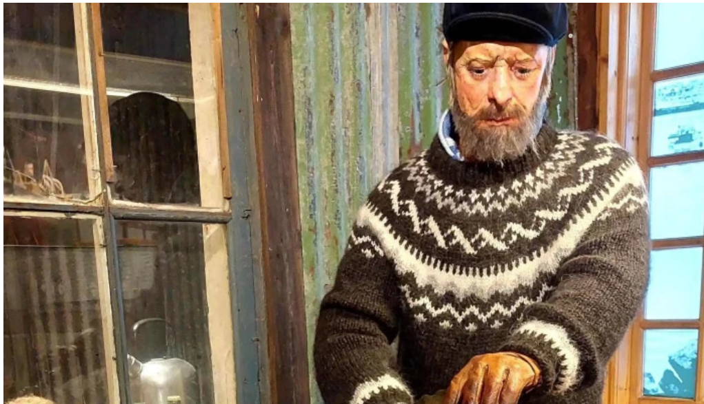
Pakkhusid byggdasafn hafnarfjardar einkunn