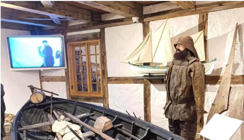
Pakkhusid byggdasafn hafnarfjardar afslættir