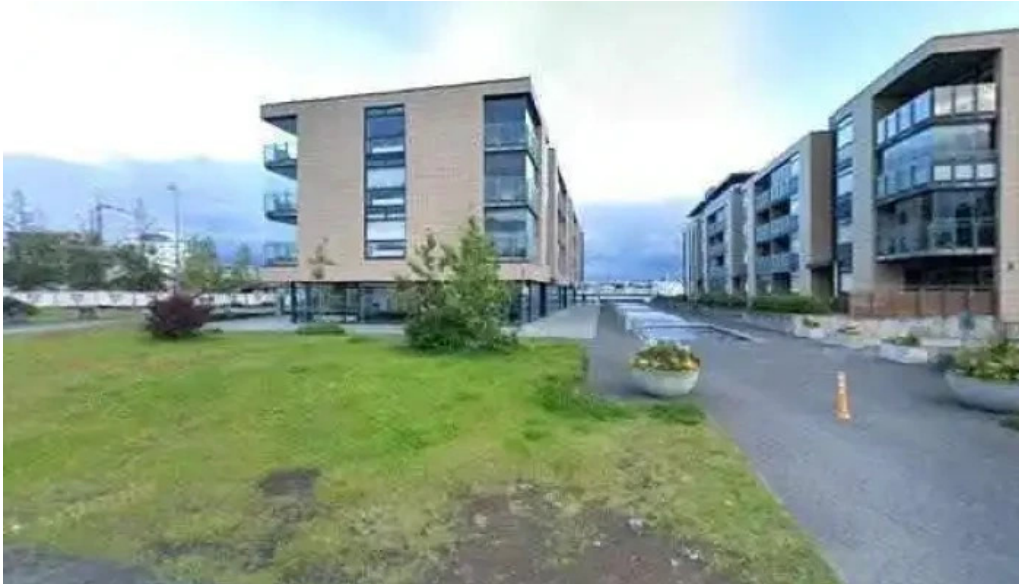
Pakkhusid byggdasafn hafnarfjardar street view 360deg