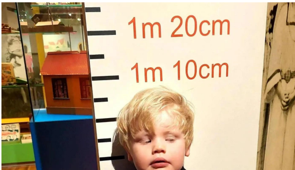
Pakkhusid byggdasafn hafnarfjardar hafnarfjorður