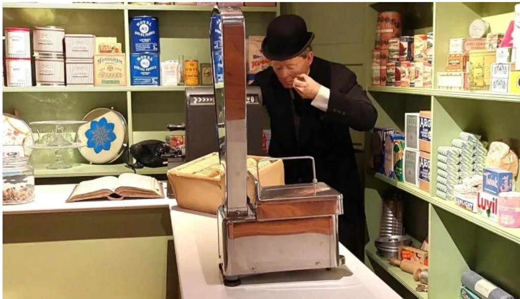
Pakkhusid byggdasafn hafnarfjardar verð