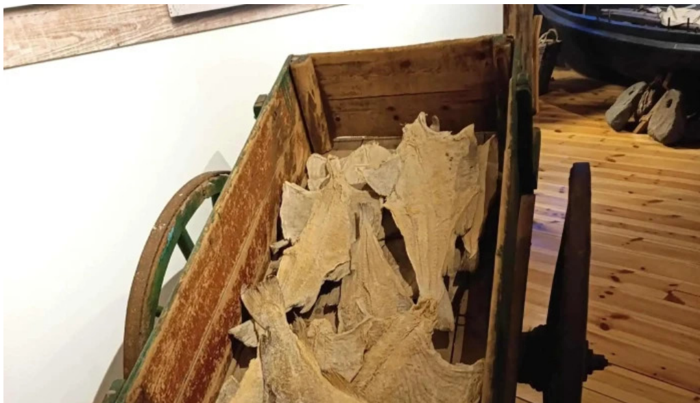
Pakkhusid byggdasafn hafnarfjardar ætlun