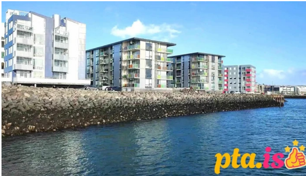
Pakkhusid byggdasafn hafnarfjardar myndskaid