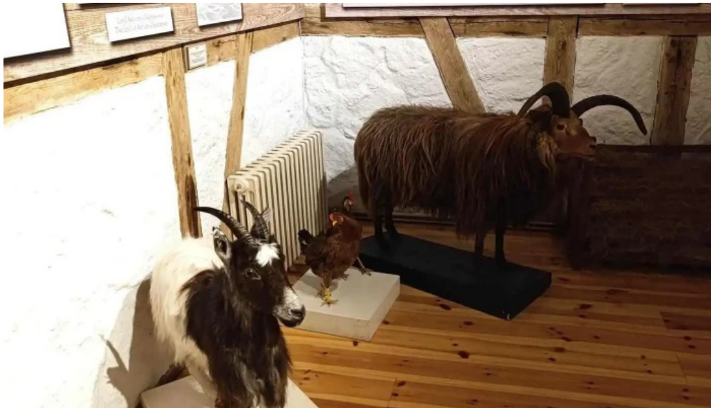
Pakkhusid byggdasafn hafnarfjardar nyjast