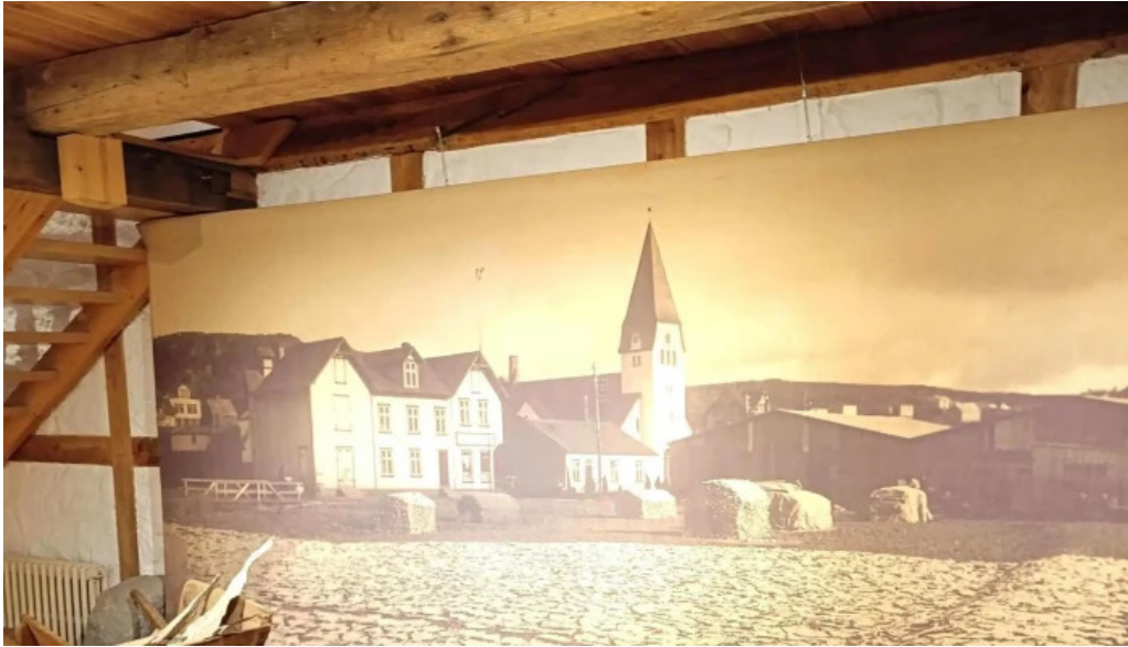
Pakkhusid byggdasafn hafnarfjardar athugasemdir