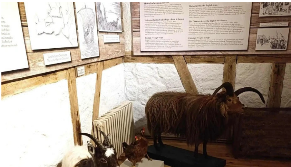
Pakkhusid byggdasafn hafnarfjardar myndbond