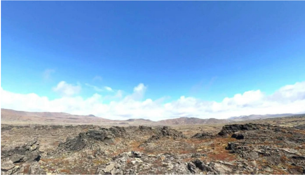
Selatangar street view 360deg