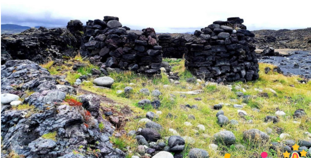
Selatangar sogulegt kennileiti