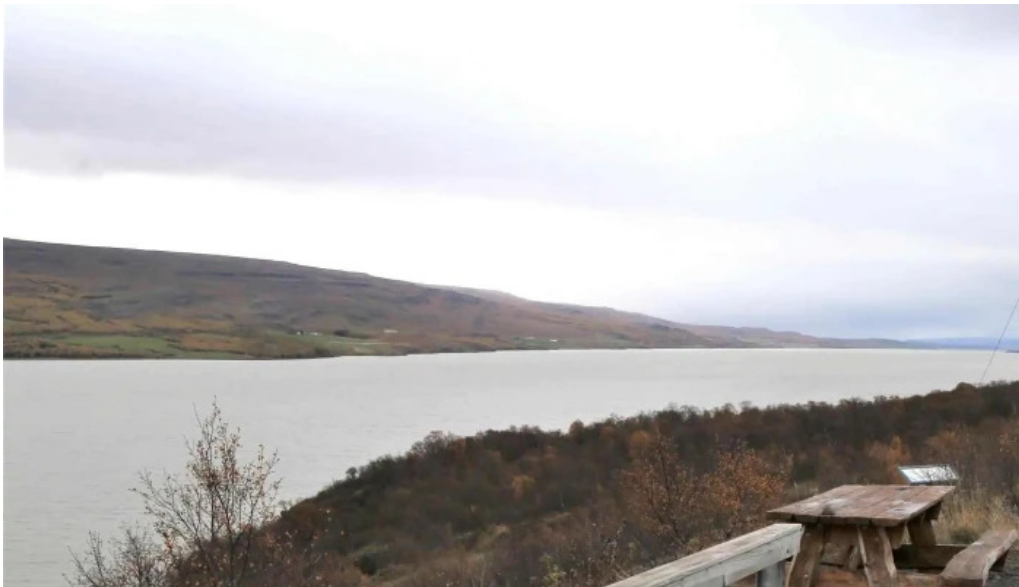
Lagarfljotsormurinn nálægt mer