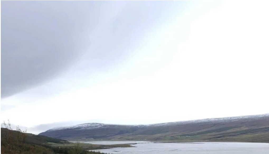
Lagarfljotsormurinn hvernig a að komast þangað