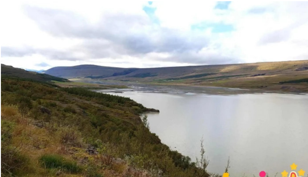
Lagarfljotsormurinn sogulegt kennileiti