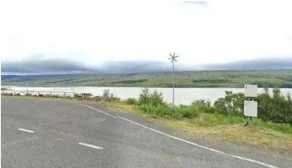
Lagarfljotsormurinn street view 360deg