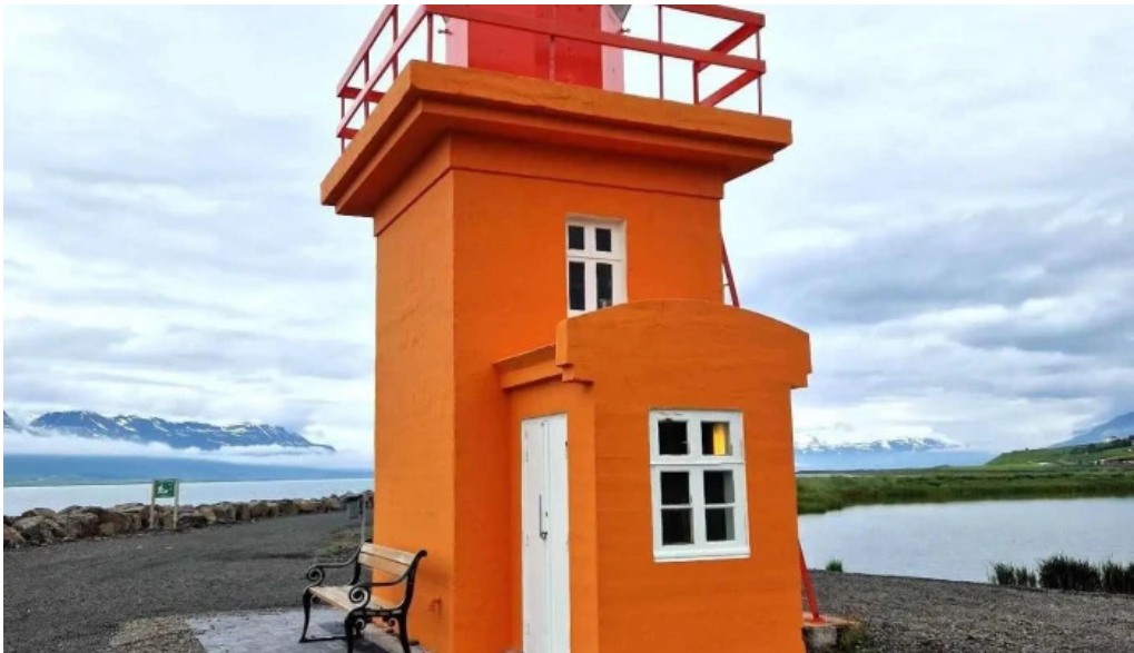
Svalbardseyrarviti sogulegt kennileiti