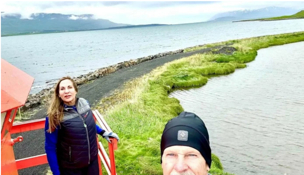
Svalbardseyrarviti hvernig a að komast þangað