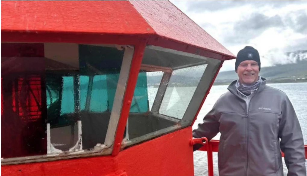
Svalbardseyrarviti nálægt mer