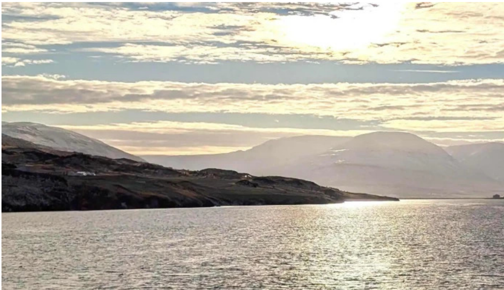
Svalbardseyrarviti opið nuna