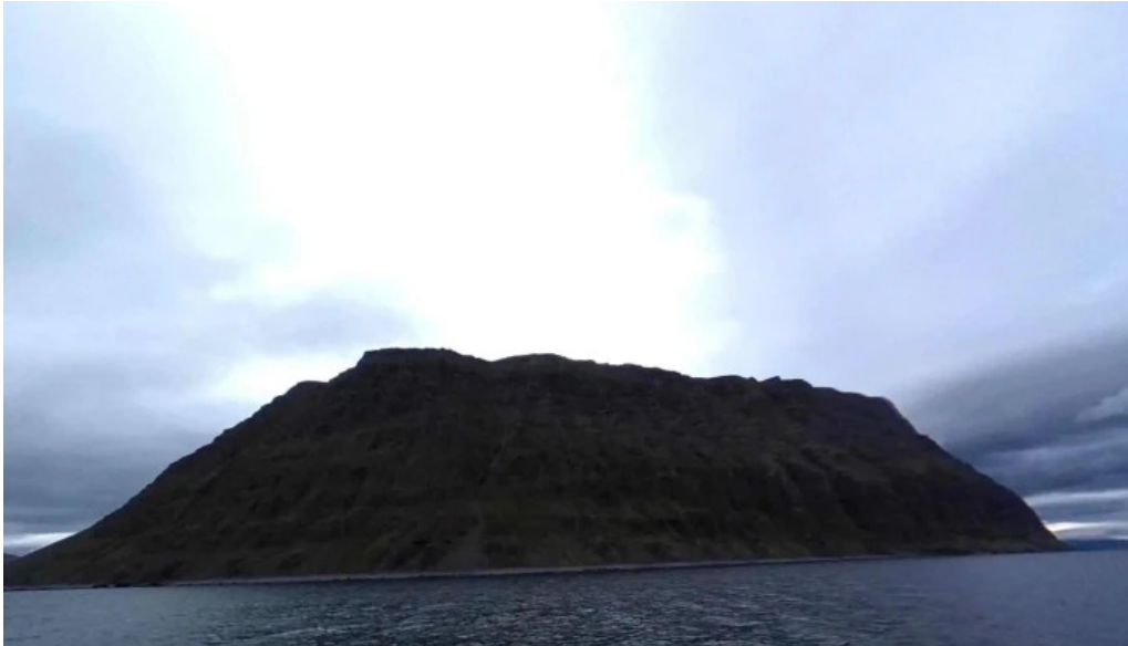
Grunnavik sogulegt kennileiti