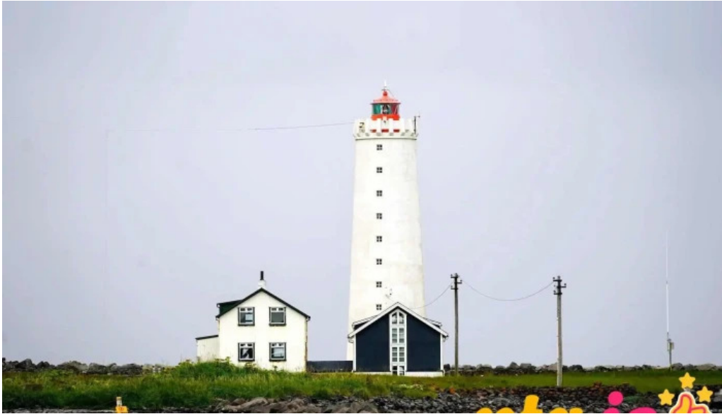
Grottuviti sogulegt kennileiti