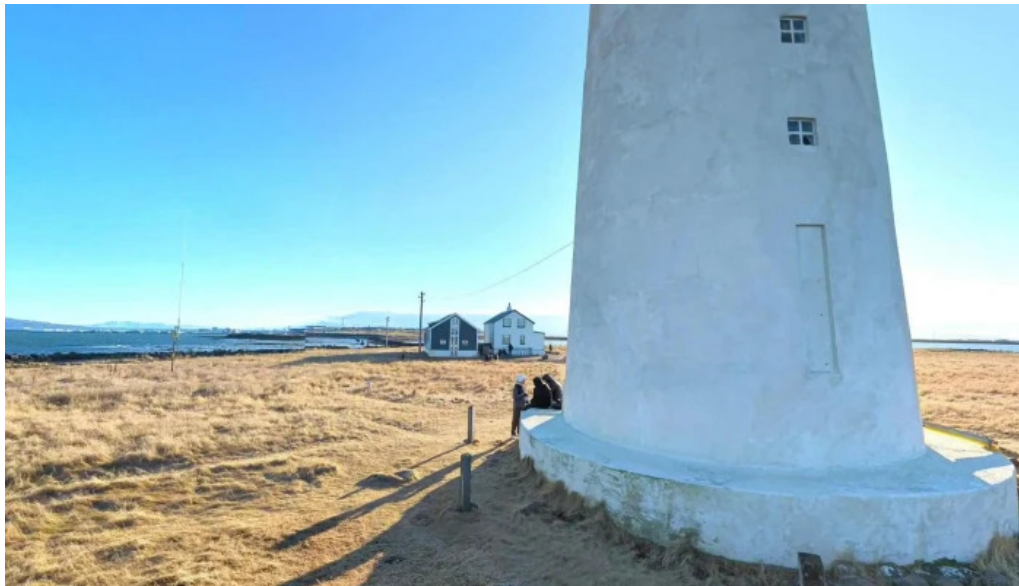
Gróttuviti street view 360