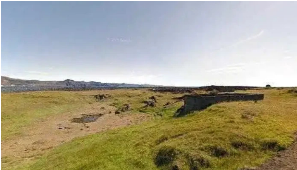
Þorkotlustaðahverfi street view 360