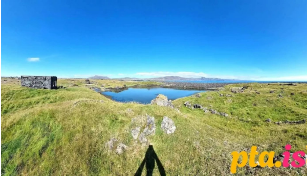
Thorkotlustadahverfi sogulegt kennileiti