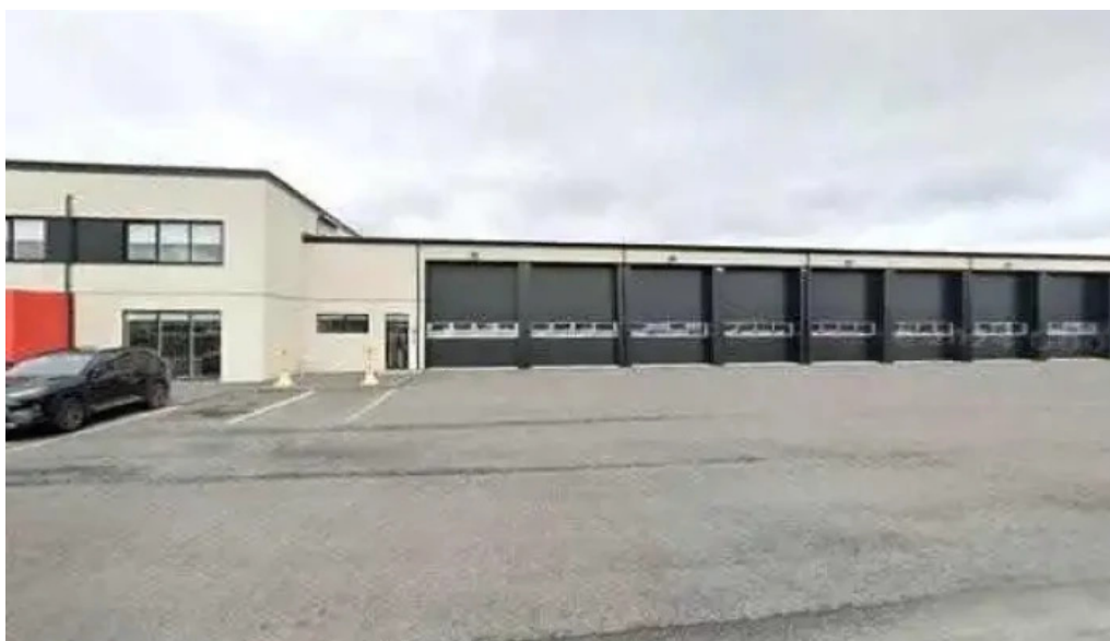
Brunavarnir sudurnesja street view 360deg