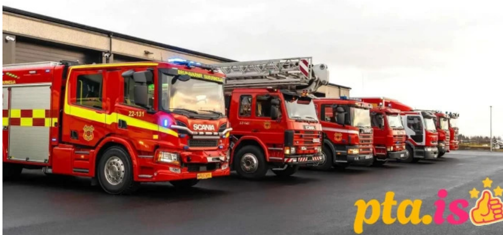
Brunavarnir suðurnesja keflavik