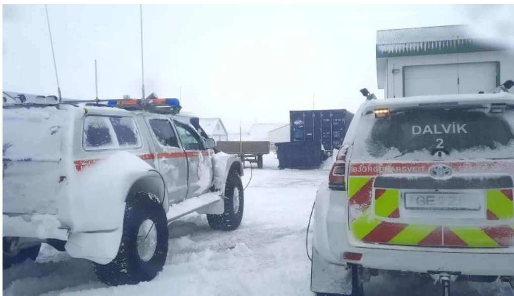
Slokkvilid dalvikur dalvik