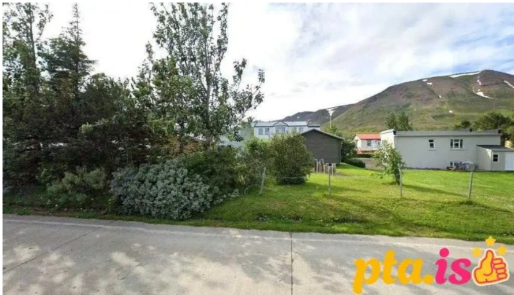
Slokkvilið dalvikur dalvik