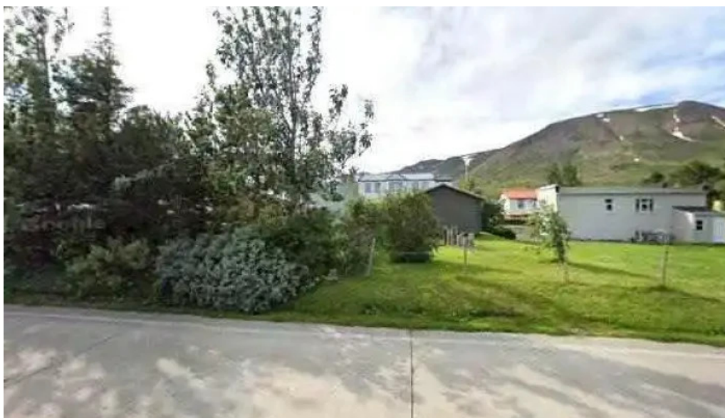
Slokkvilid dalvikur slokkvistoð