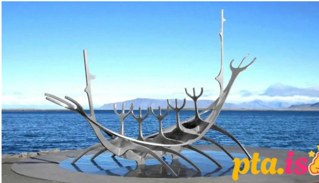
Sun voyager reykjavik iceland fra eiganda