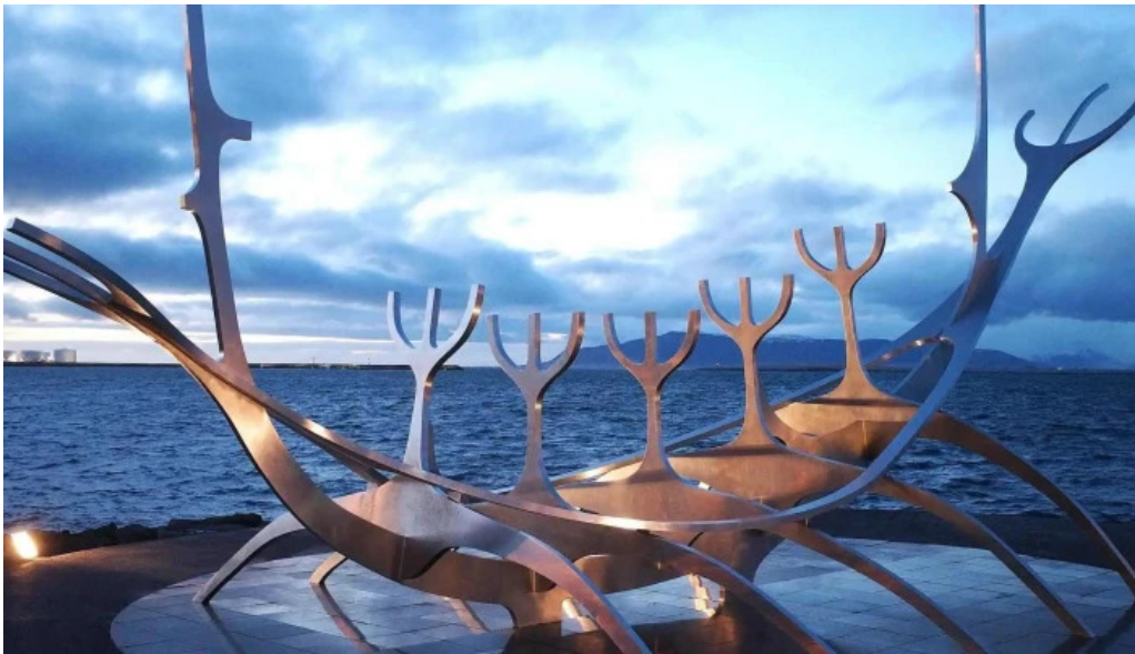
Sun voyager reykjavik iceland hvar