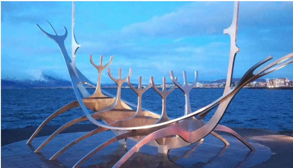
Sun voyager reykjavik iceland simi