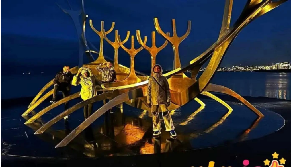
Sun voyager reykjavik iceland nyjast