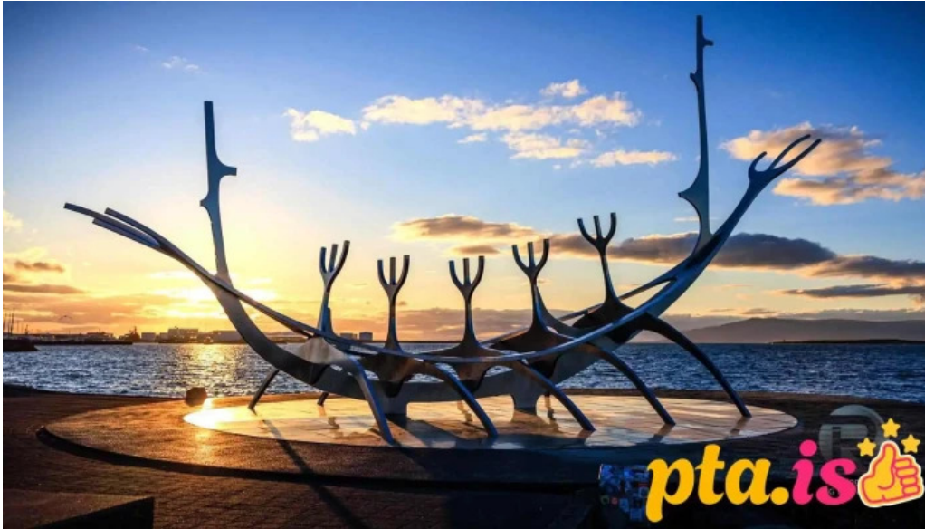
Sun voyager reykjavik iceland skulptur