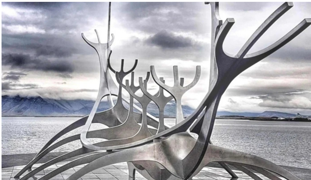
Sun voyager reykjavik iceland myndbond