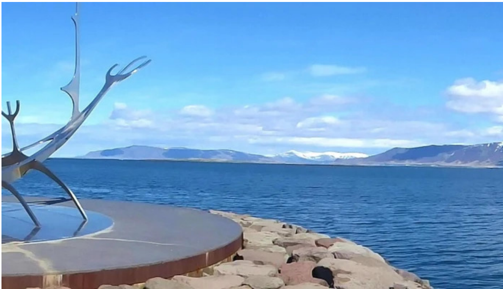
Sun voyager reykjavik iceland nalægt mer