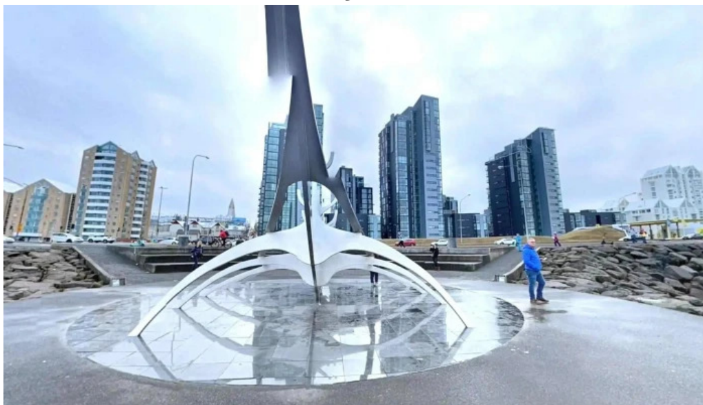
Sun voyager reykjavik iceland street view 360deg