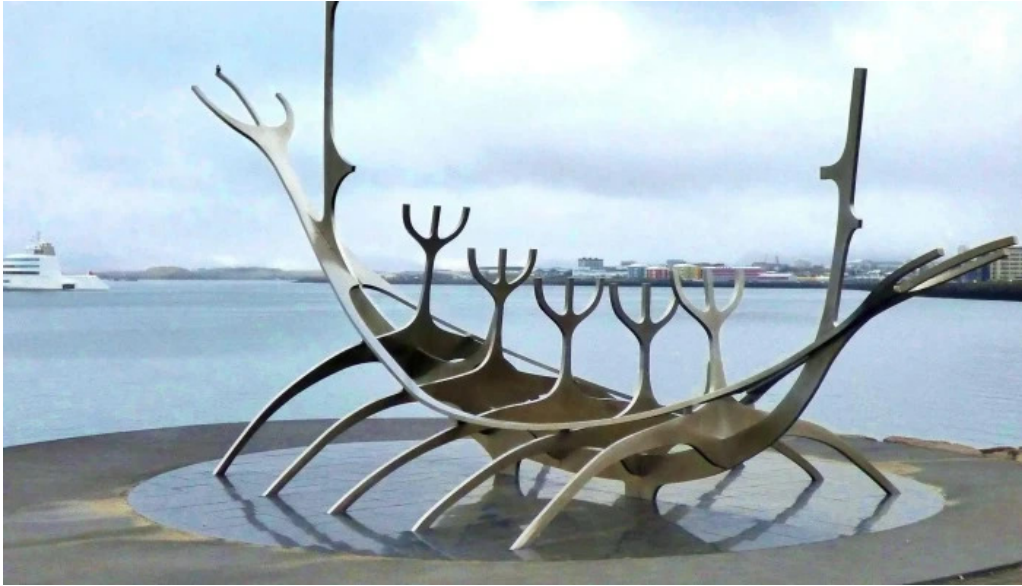
Sun voyager reykjavik iceland instagram