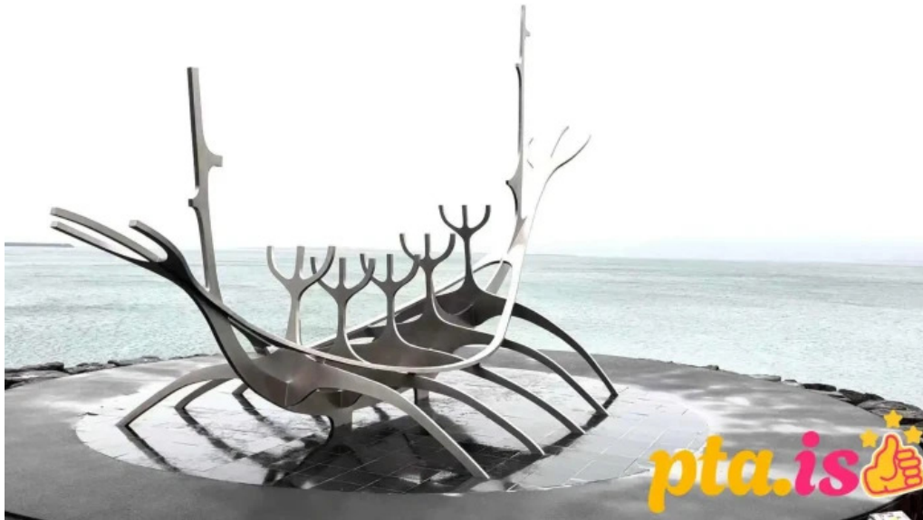
Sun voyager reykjavik iceland myndskaid