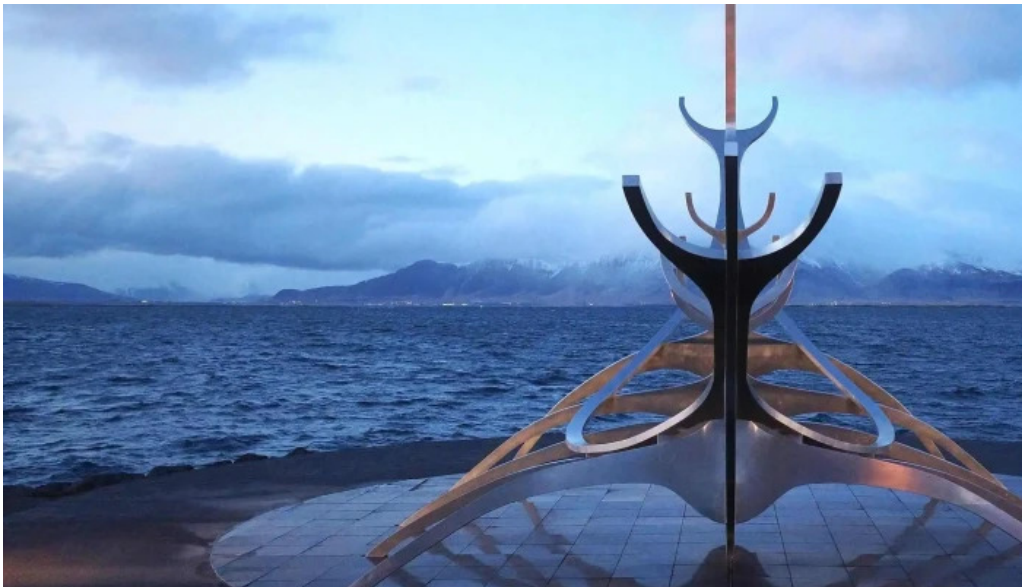
Sun voyager reykjavik iceland reykjavik