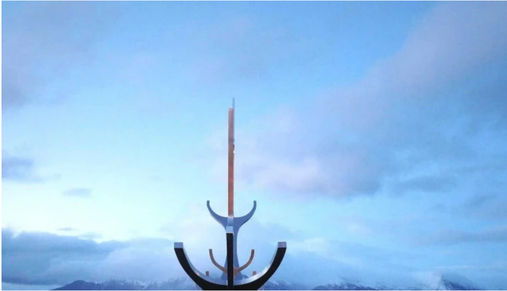
Sun voyager reykjavik iceland safn