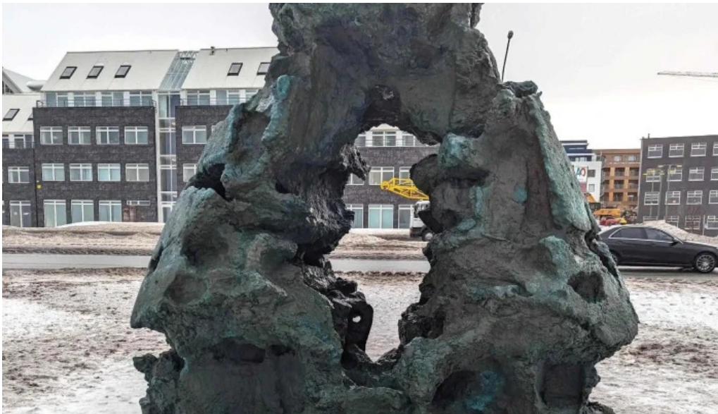
Islandsvardan nálægt mer