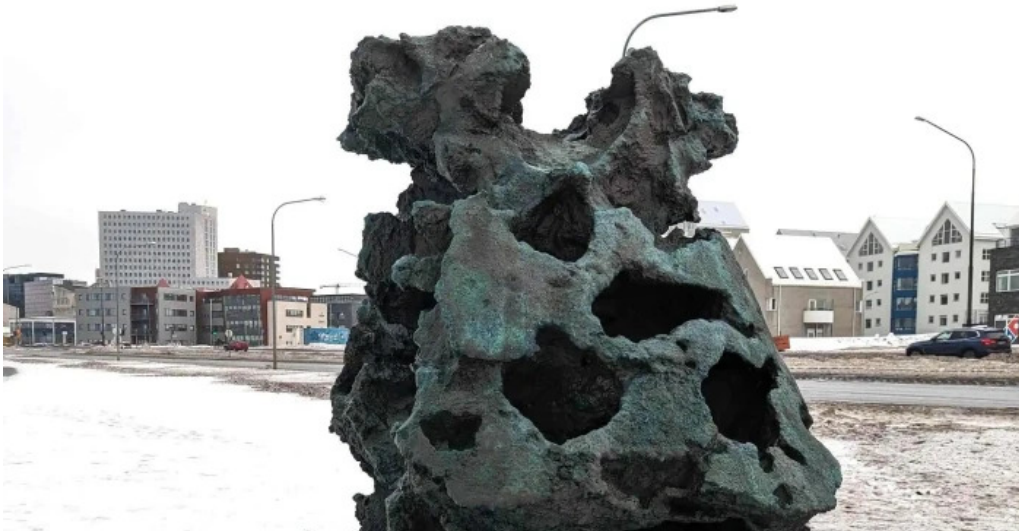
Islandsvardan hvernig a að komast þangað