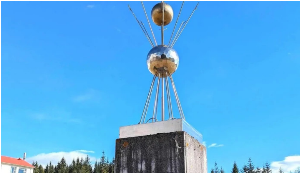
Lifslongun eftir sigurjon olafsson mosfellsbær