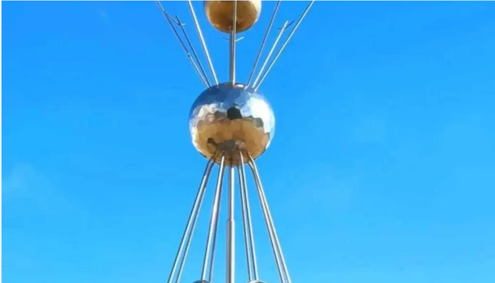
Lifslongun eftir sigurjon olafsson myndskeid