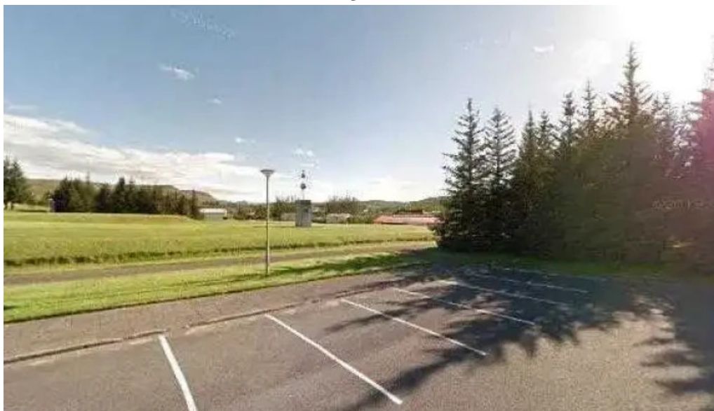
Lifslongun eftir sigurjon olafsson street view 360deg