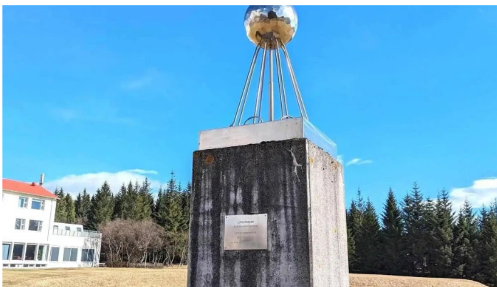
Lifslongun eftir sigurjon olafsson skulptur