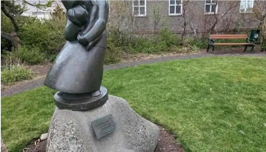
Fykur yfir haedir asmundur sveinsson skulptur