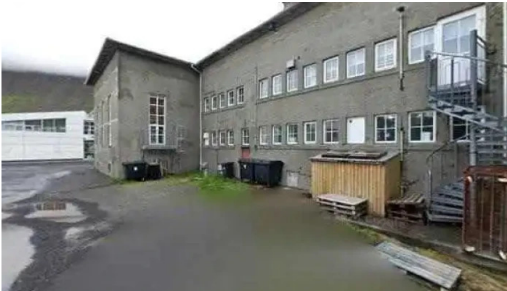
Fýkur yfir haedir asmundur sveinsson street view 360deg