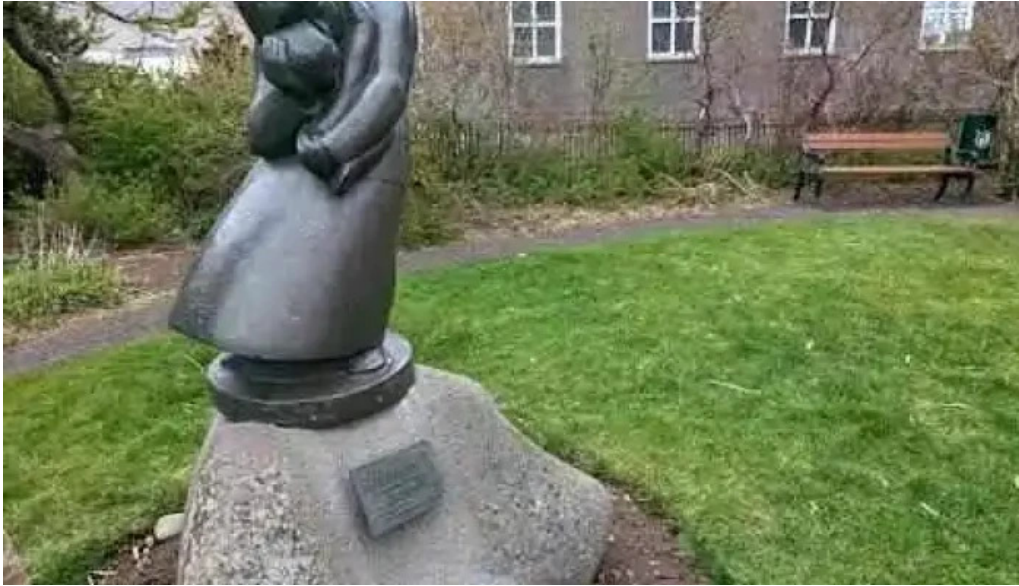
Fýkur yfir hæðir asmundur sveinsson isafjorður