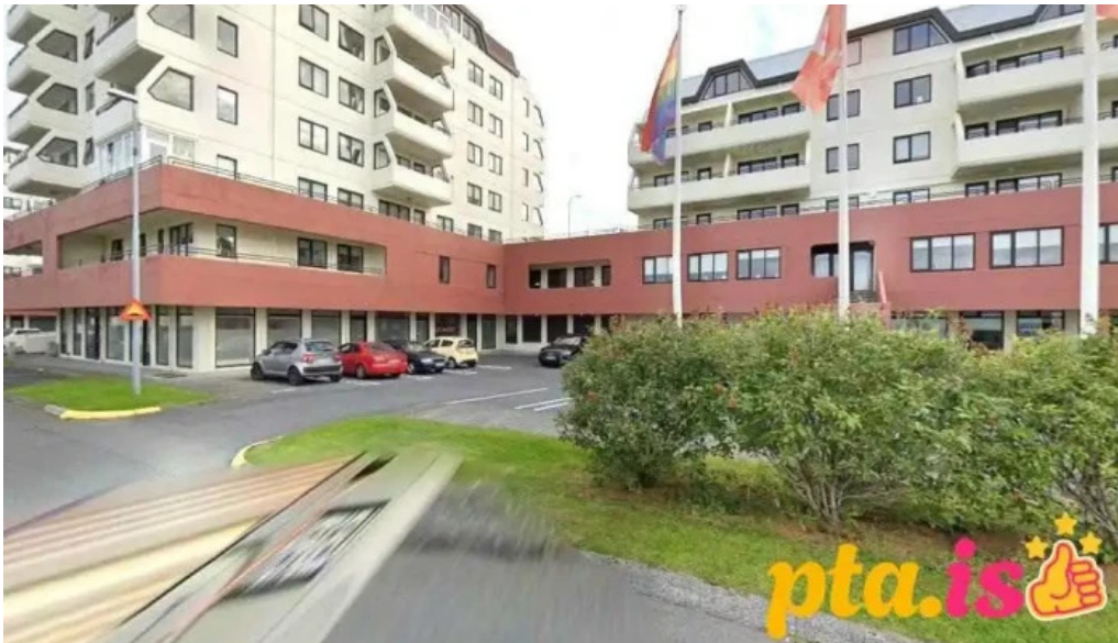
Bæjarskrifstofur seltjarnarness seltjarnarnes