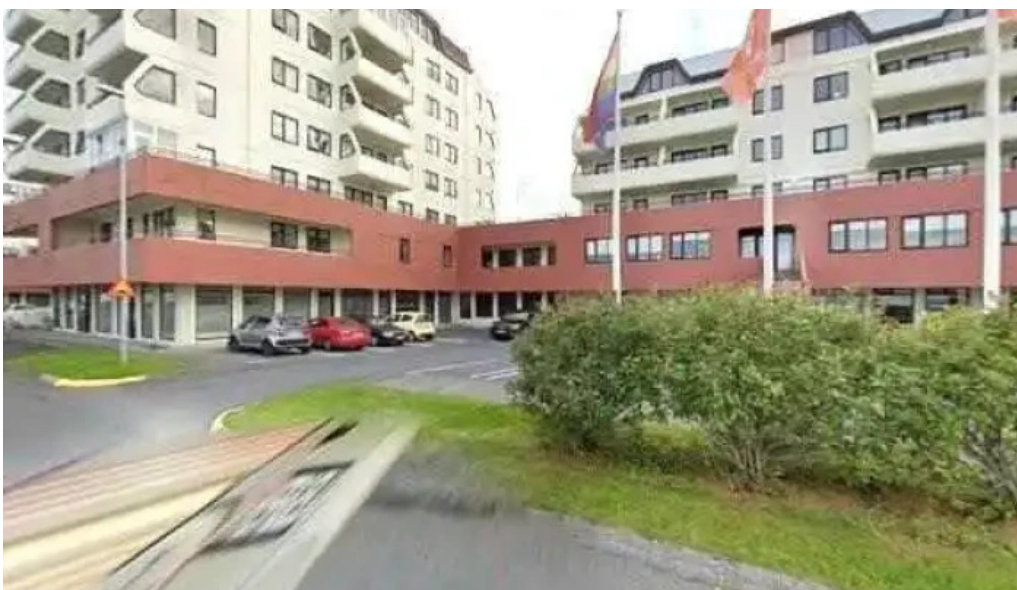
Bæjarskrifstofur seltjarnarness skrifstofa fyrirtækis