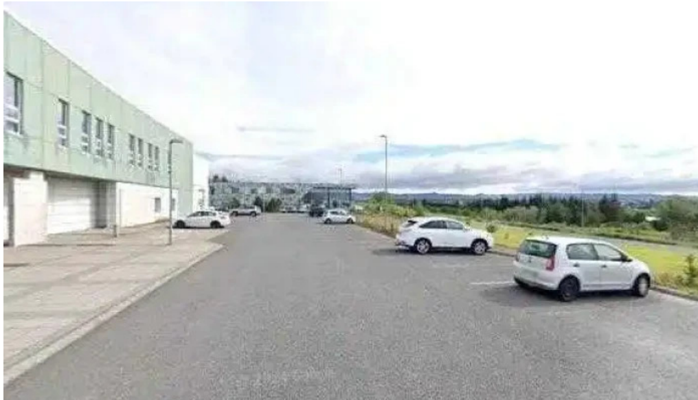
Postdreifing skrifstofa fyrirtækis